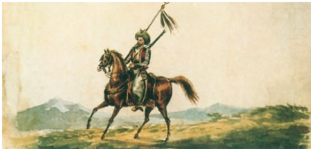
Михаил Лермонтов. Кавказский горец верхом. 1836 Акварель

и условия дуэли, возможно, осуществить попытки к примирению сторон, то есть выполнить обязательные требования, связанные с правильной ее организацией.