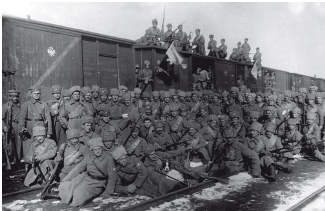
Фото 7. Один из железнодорожных составов мятежного чехословацкого корпуса. Весна-лето 1918 г.

В самом начале января 1918 г. М. Н. Рютин прибыл в Иркутск, где только что закончились десятидневные декабрьские бои с белогвардейцами и была установлена Советская власть. Находившийся в Иркутске ЦИК Советов Сибири (Центросибирь) сразу же назначил его командующим войсками Иркутского военного округа. В данной должности он проработал около 2,5 месяцев. В марте 1918 г. избран заместителем председателя Иркутского губернского исполкома Советов и проработал на этой должности до 13 июня 1918 г. В мае 1918 г. Рютину пришлось участвовать в подавлении мятежа в родном Балаганском уезде и ликвидировать там белогвардейский офицерский отряд. 31 мая он активно участвовал в ликвидации белогвардейского восстания в Иркутске и был членом Ревтрибунала [9, с. 60]. Кроме того, Мартемьян Никитич в это время являлся членом объединённой редакционной коллегии советских газет Иркутской губернии [11, с. 170].