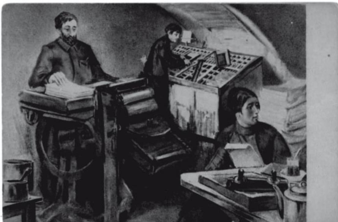
Фото 4. Рабочая обстановка типичной подпольной типографии XIX в.