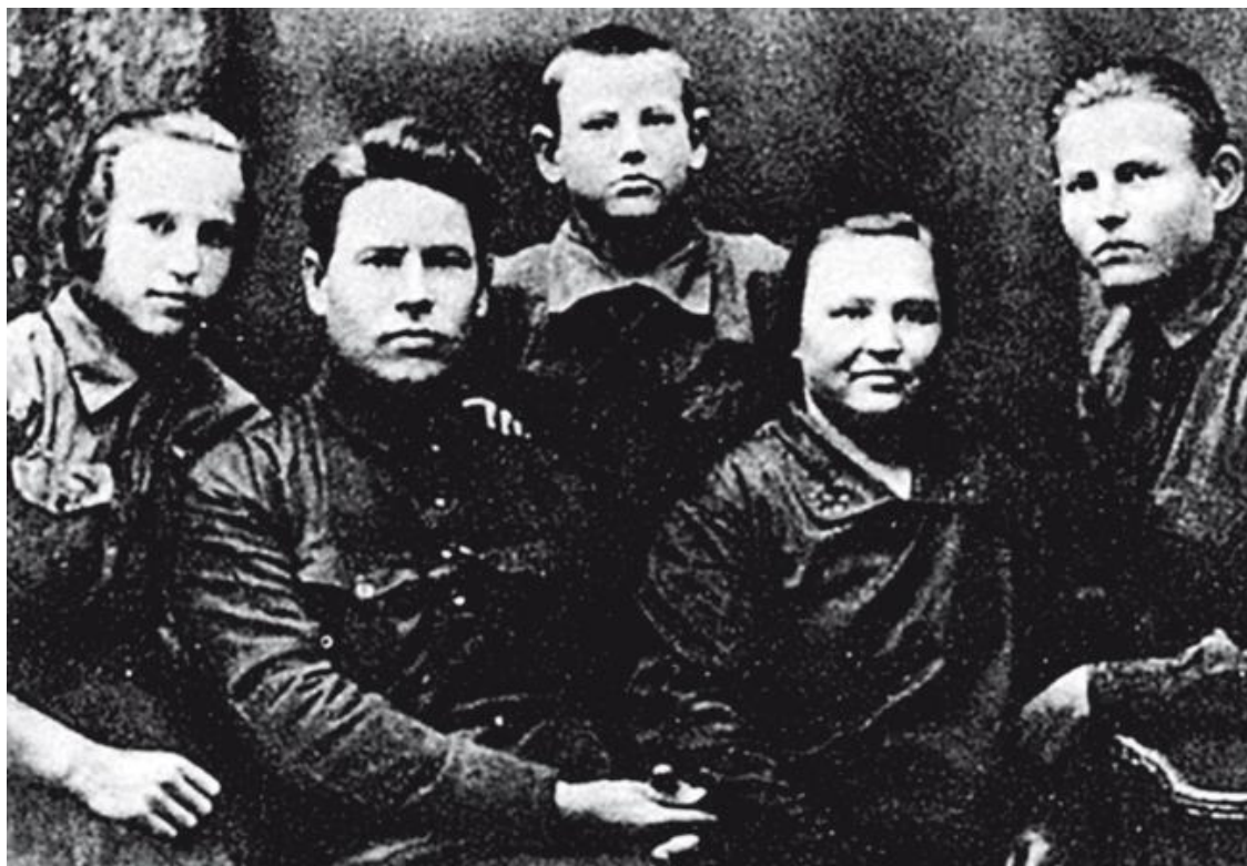
Фото 6. Советский политический и партийный деятель, кандидат в члены ЦК ВКП(б) в 1927–1930 гг. Мартемьян Рютин в кругу семьи.

До самой реабилитации одними из первых и немногих, в режиме исключения, положительных или хотя бы нейтральных упоминаний о Рютине стали сборник документов «Борьба за власть Советов в Иркутской губернии» (1959) [4, с. 55] (при этом в именном указателе сборника Рютин отсутствует), и книга Г. И. Андреева о революционном движении на Китайско-Восточной железной дороге (КВЖД) (1983). [5].