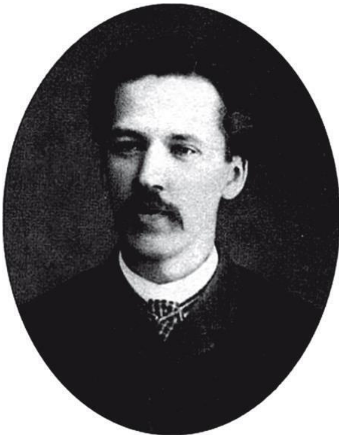
Фото 5. Сергей Зубатов – крупнейший деятель политического сыска, начальник Московского охранного отделения и Особого отдела Департамента полиции министерства внутренних дел Российской империи

Можно ли говорить о неких «нравственных устоях» такого человека как Зинаида Гернгросс? Она пыталась убедить Бурцева, что «служила идее», была «честным сотрудником», а эсеры, «преступная шайка», причиняющая народу вред. Так верить ей или нет, верить в ее идейность и бескорыстность – задается вопросом Бурцев?