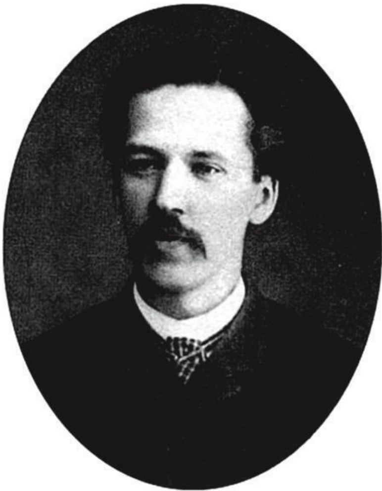
Фото 5. Сергей Зубатов – крупнейший деятель политиче-