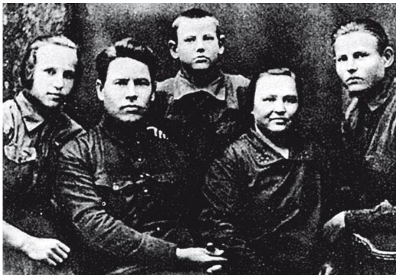
Фото 6. Советский политический и партийный деятель, кандидат в члены ЦК ВКП(б) в 1927–1930 гг. Мартемьян Рютин в кругу семьи.