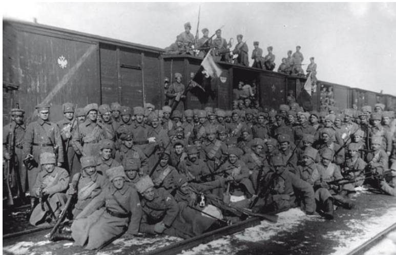
Фото 7. Один из железнодорожных составов мятежного чехословацкого корпуса. Весна-лето 1918 г.

В конце мая – начала июня 1918 г. обстановка в Сибири резко изменилась не в пользу Советской власти: началось контрреволюционное выступление Чехословацкого корпуса, к которому присоединились вышедшие из подполья бело-офицерские, бело-казацкие и эсеровские вооруженные формирования. В течение июня – июля Советская власть в Западной Сибири была ликвидирована, а в Восточной Сибири она продержалась до конца августа 1918 г., но в течение всего лета советская территория здесь непрерывно уменьшалась.