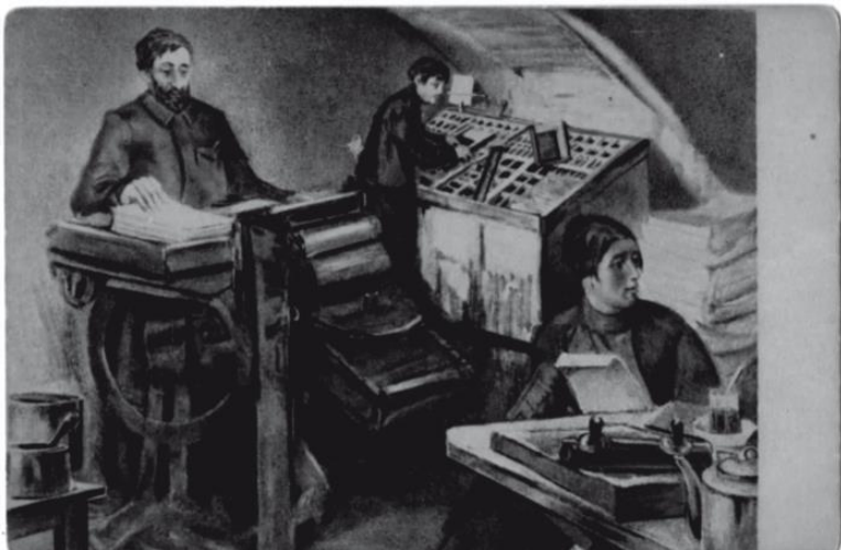
Фото 4. Рабочая обстановка типичной подпольной типографии XIX в.

деньги в тюрьму в Германию в 1916 году – целый год...» 44 .