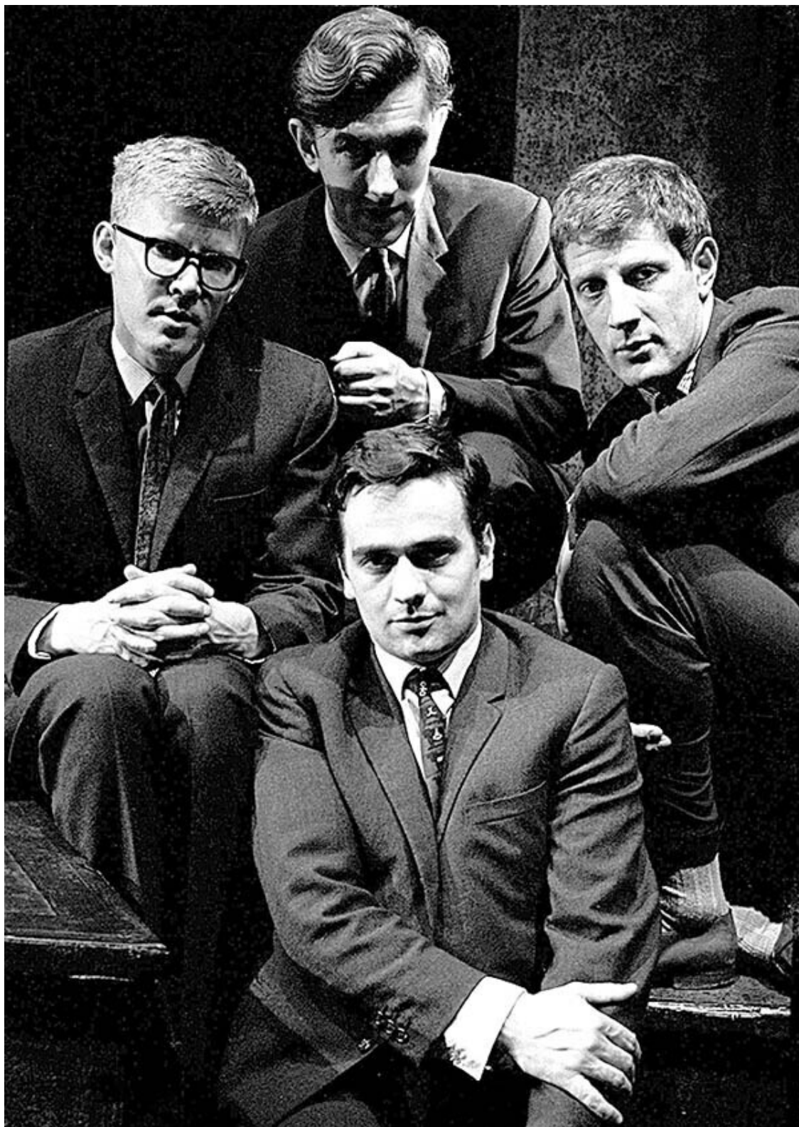
«Пришел конец – и да исчезнет мир!» Актеры спектакля «За гранью» готовятся к концу света.