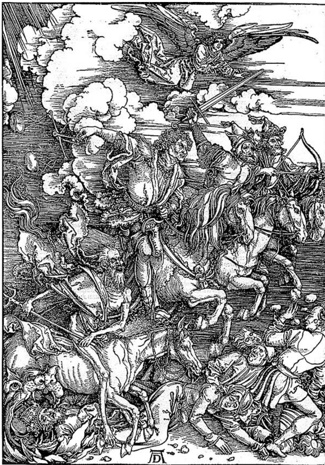
Альбрехт Дюрер. «Четыре всадника Апокалипсиса» (1498)

Удобная черта христианского эсхатона – неопределенность, которую Христос оставил в душах учеников, говоря о его сроках: «О дне же том и часе никто не знает, ни Ангелы небесные, а только Отец Мой один» (Мф 24:36).