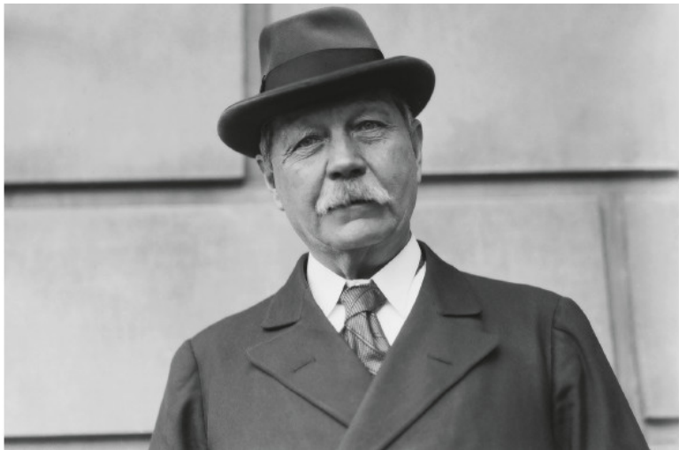
Сэр Артур Игнатиус Конан Дойль 22 мая 1859 – 7 июля 1930