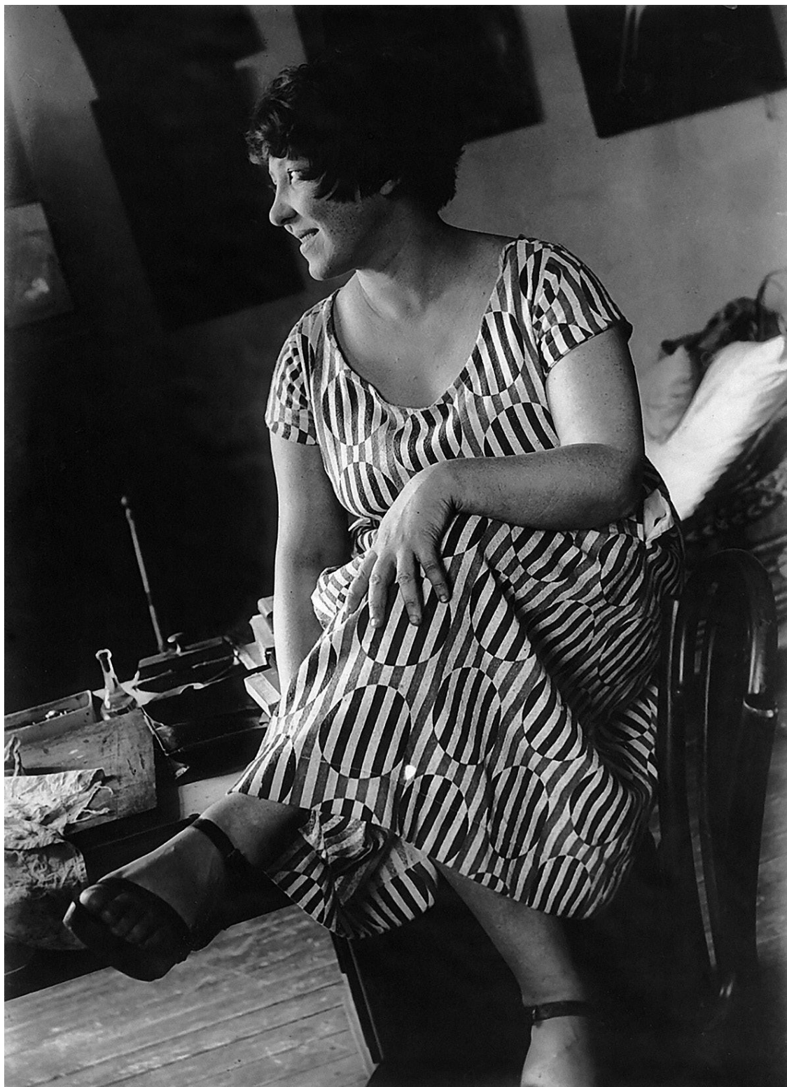
В.Ф. Степанова в платье, сшитом из ткани, напечатанной по ее рисунку на Первой ситценабивной фабрике в Москве.