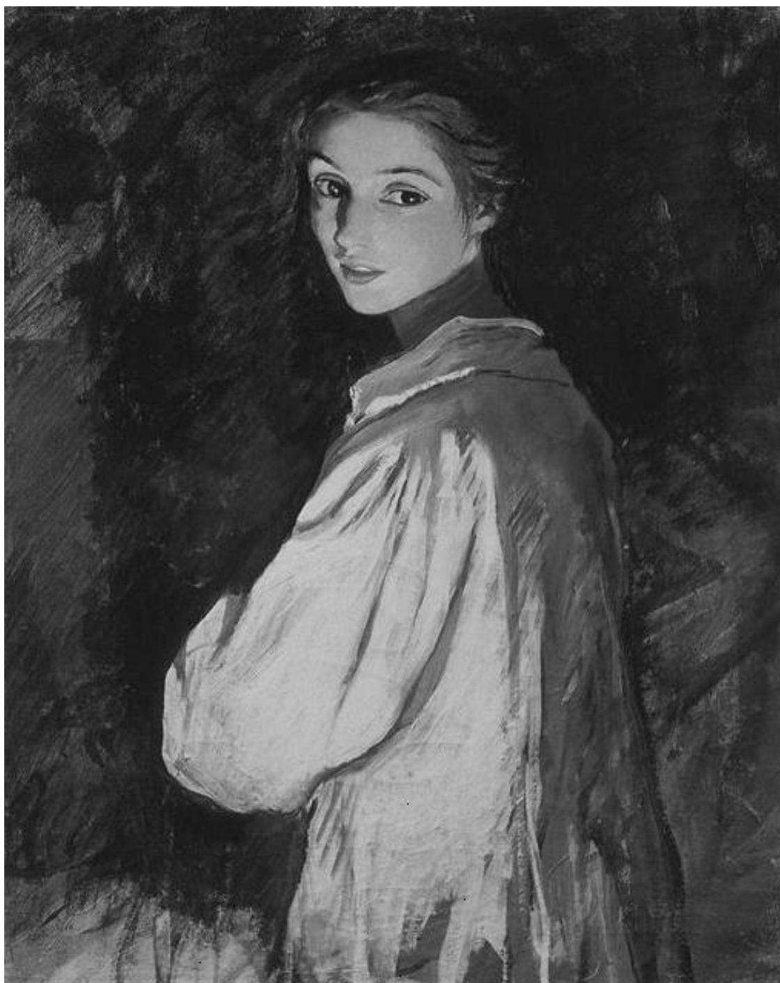
Рис. 3. З. Серебрякова. Девушка со свечой. Автопортрет. 1911

Отдохнувший здоровый человек испытывает легкость и прохладу в теле, покой в груди и ясность в голове. Он как будто наполнен светом. Его энергетика живет широко, а сознание спокойно. Такой человек отдает себе отчет в том, где он находится и что с ним происходит. Он знает, как действовать дальше.