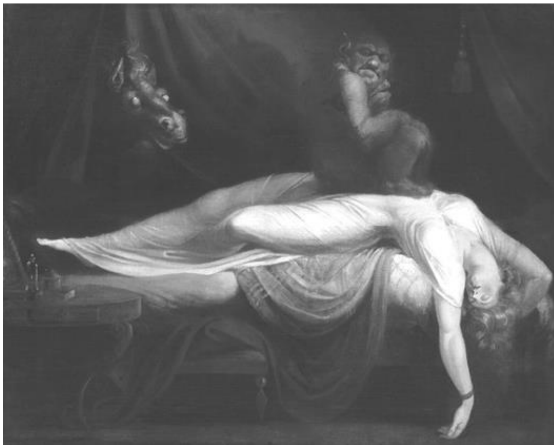
Рис. 2. И.Г. Фюссли. Ночной кошмар. 1790