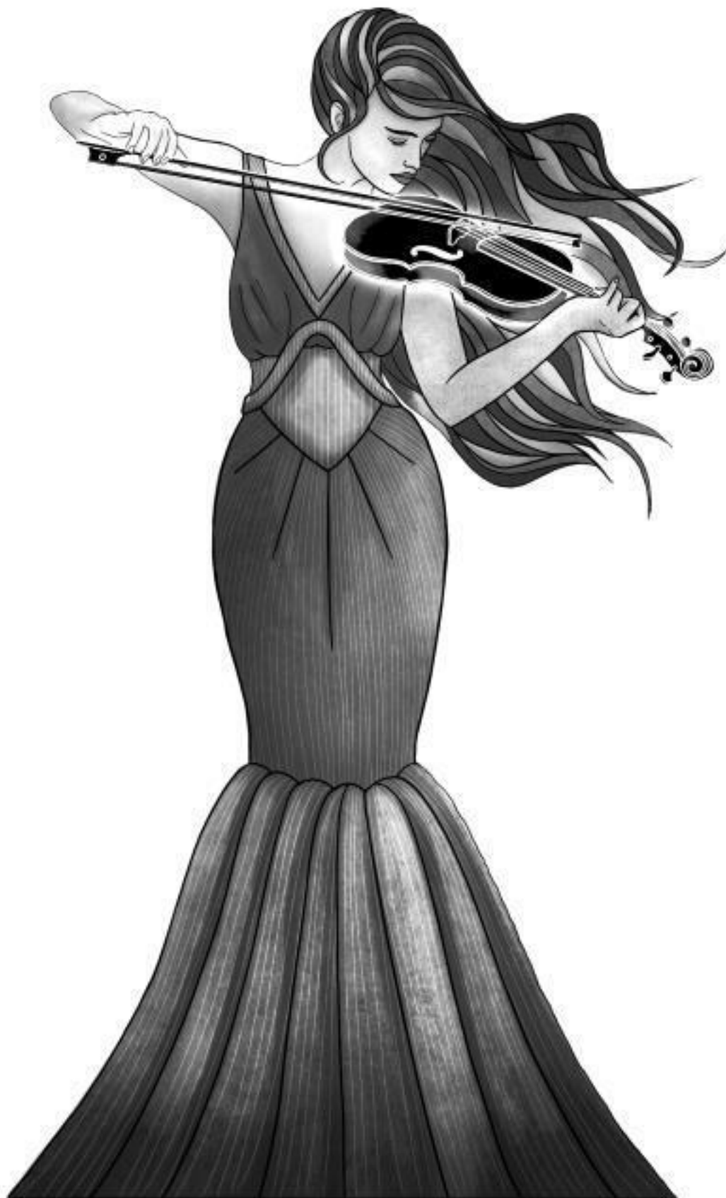
E. J. Mellow Symphony for a Deadly Throne