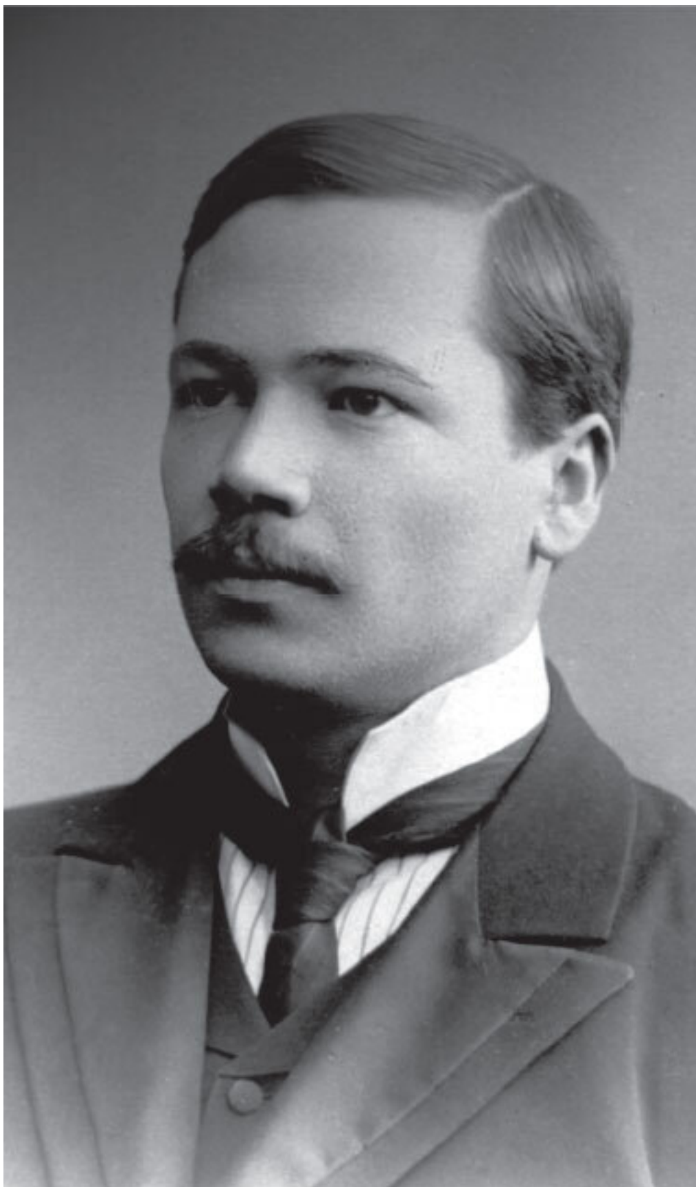
Серия основана в 1998 г.