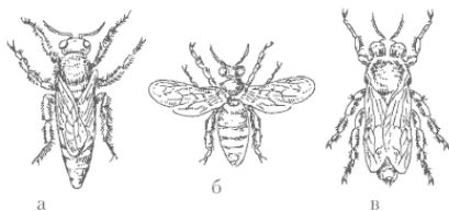
Рис. 1. Особи пчелиной семьи: а – матка, б – рабочая пчела, в – трутень

Матка – особь в пчелиной семье, способная воспроизводить потомство. По размерам и массе она превосходит всех остальных пчел. Длина ее тела в зависимости от породы и сезона года колеблется от 20 до 25 мм, масса плодной матки – от 200 до 250 мг, неплодной – от 150 до 200 мг. Полноценная плодная матка откладывает за сутки от 1000 до 2000 яиц, за сезон 150–200 тысяч штук. На откладку одного яйца матка тратит 40–46 секунд. Масса его в зависимости от возраста матки, количества пчел в семье и периода сезона колеблется от 0,128 до 0,221 мг. Молодые матки откладывают яйца большей массы, чем старые.