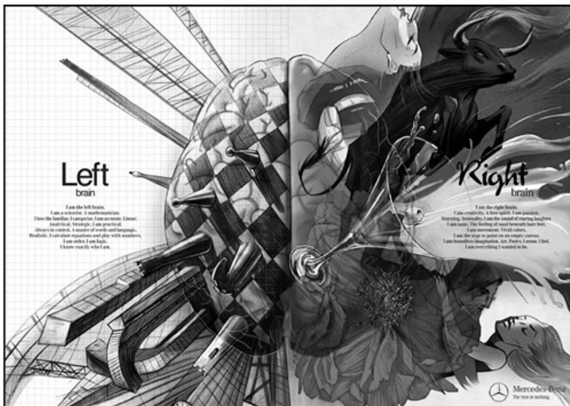
Рис. 1. Рекламный плакат «стреляет» сразу по двум «зайцам»: по левополушарным и правополушарным людям

Объявление дает понять, что рекламируемый автомобиль доставит удовольствие как левой половине нашего мозга, так и правой. Все будет прекрасно как в прагматическом, так и в эмоциональном плане.