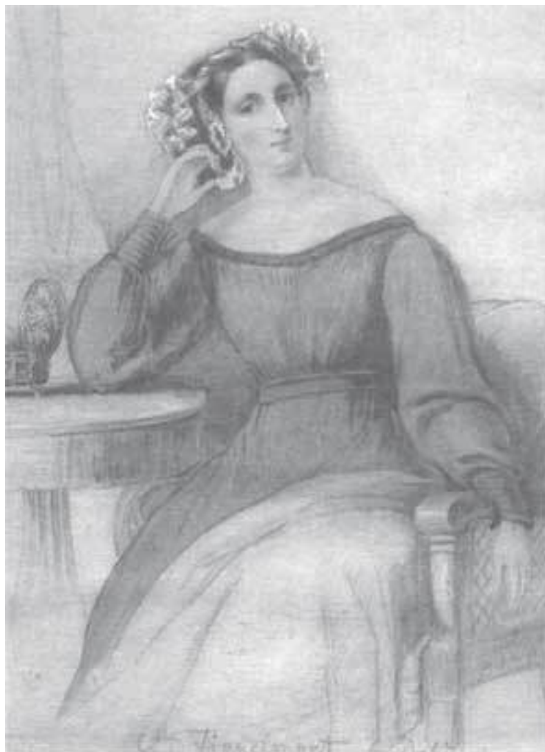
Графиня Долли Фикельмон

Между тем то, что доподлинно известно о Пушкине и Долли, отнюдь не свидетельствует, что между ними была любовная связь. Скорее наоборот. Долли отличалась сильным характером и расчетливой осторожностью. Ее осмотрительное, сдержанное поведение, вполне соответствующее ее положению супруги высокопоставленного дипломата, снискало ей безупречную репутацию и при Дворе, и в свете. Рисковать этой репутацией и своим положением в обществе ради случайного любовного приключения она едва бы стала.