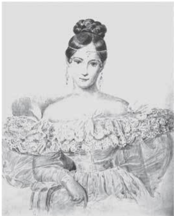
Н. Н. Пушкина