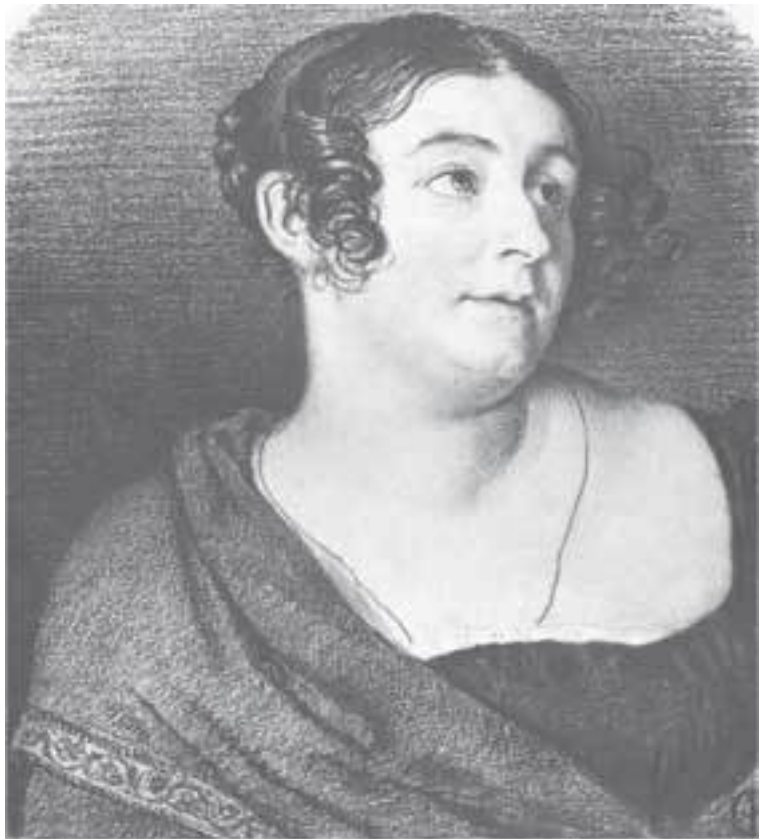
Е. М. Хитрово

Долли – Елизавета Михайловна Хитрово. Ее дружба с Пушкиным, а в какое-то время и нечто большее чем дружба, не были тайной для окружающих.