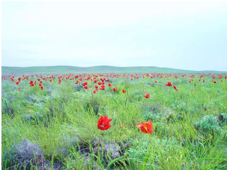
Степь в цвету