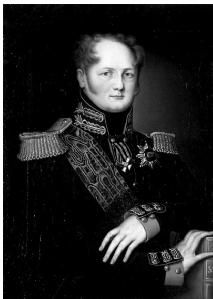
Император Александр I