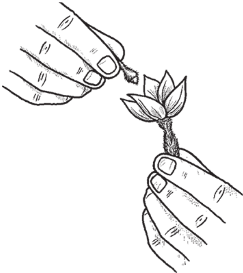
Рис. 3. Искусственное опыление

При обработке цветков огурца воспользуйтесь мягкой кисточкой, перенося с ее помощью пыльцу с мужского цвет-