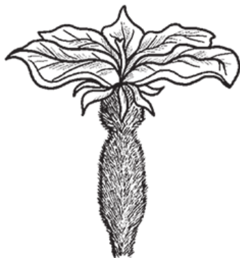
Рис. 2. Цветки огурца: а – мужские; б – женские