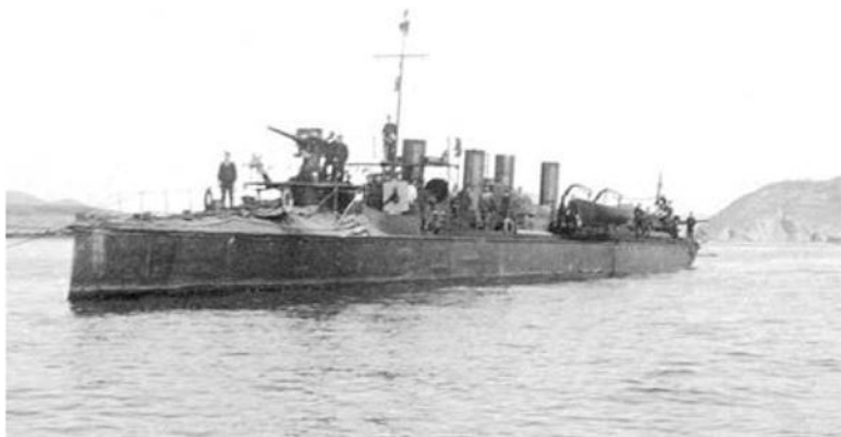
Миноносец «Сильный» типа «Сокол»

несколько минут я уже был на адмиральской пристани в сопровождении вестового, тащившего вещи, а еще минут через пять высаживался на «Решительный».