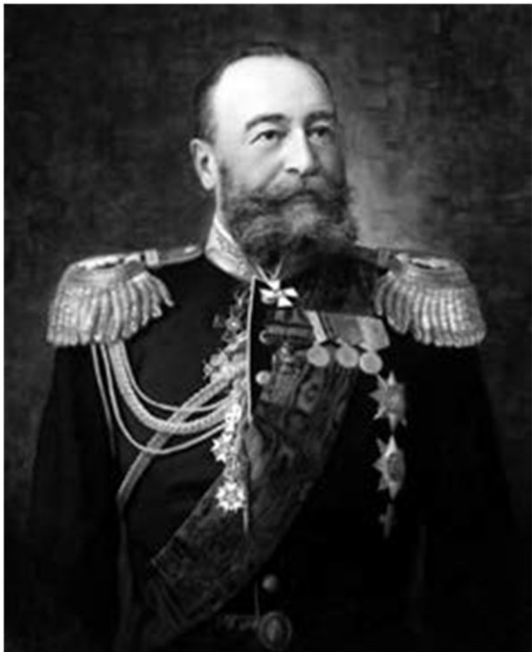
Адмирал Евгений Иванович Алексеев – наместник на Дальнем Востоке и главнокомандующий русских войск в