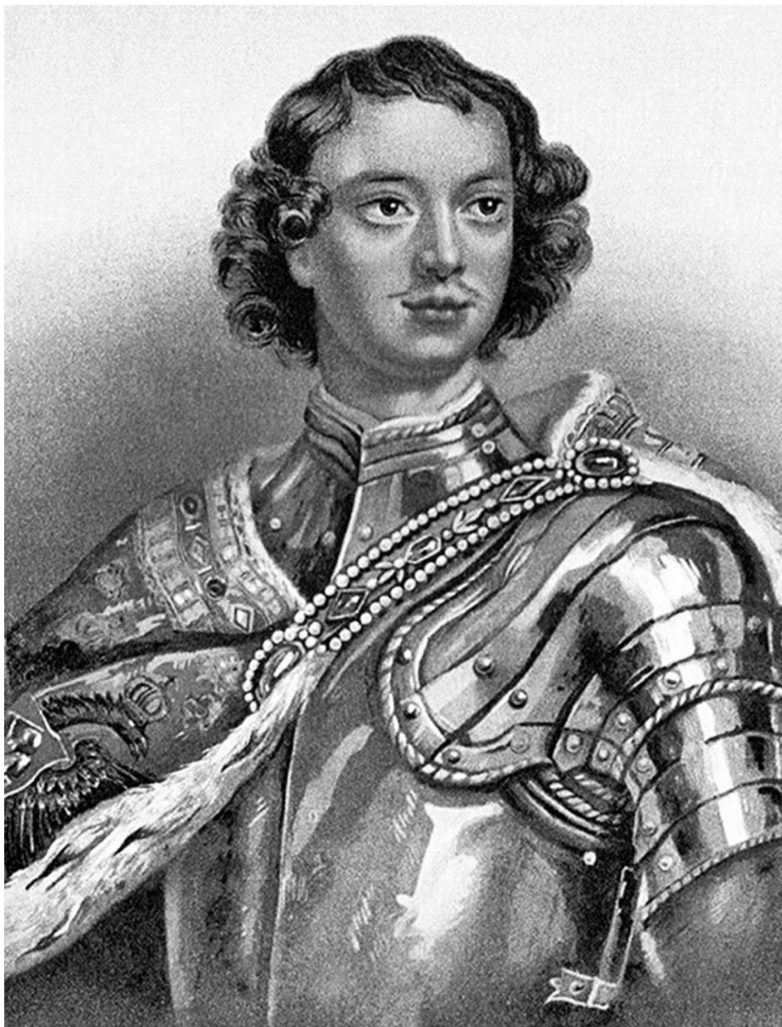
Рисунок с картины Кнеллера С.Г. Конец XIX в.

Мы узнаем, что юный Петр был окружен карлами и карлицами, что его первый наставник, подъячий Зотов, велел изготовлять для царевича так называемые «куншты», то есть картинки для наглядного обучения; мы узнаем, что между игрушками Петра занимало видное место разного рода оружие и что для него писались иконы. Все это не представляет собой ничего особенного и было обыкновенным явлением в отроческой жизни царских детей.