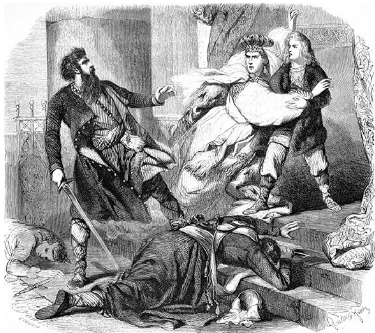
Révolte des Strelitses. — Le jeune Pierre le Grand au couvent de Troitza (d'après Steuben).