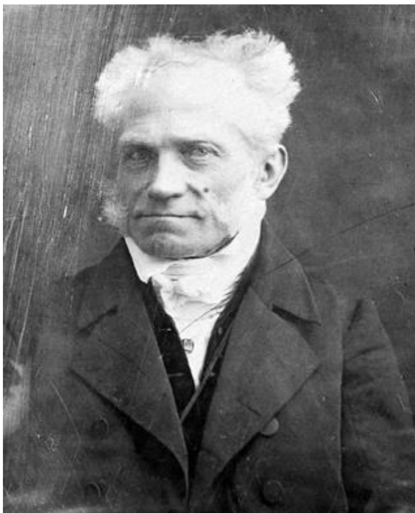
А. Шопенгауэр (фото 1845 года)

Время для подавляющего большинства людей имеет свойство сжиматься по мере удаления от настоящего момента. Прошлогодняя турпоездка на модный курорт – как это было давно! Культура прошлого десятилетия – это почти ретро и уж точно не современность. Между двумя мировыми войнами было около двадцати лет относительного мира – это мы еще помним, хотя уже можем спутать 1 августа и 1 сентября 1914 и 1939 годов. Но вот Алексей Михайлович и Иван Калита для нас – почти современники, несмотря на разделяющие их два столетия. А уж первые Рюрики, древние греки и римляне, фараоны и шумеры – вообще что-то однородное, сваленное в нашей памяти в одну большую историческую кучу под названием «при царе Горохе». Столетия спрессовались.