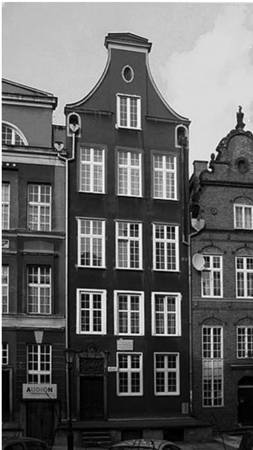
Дом в Данциге, где в 1788 году родился Шопенгауэр

Более правдоподобно выглядит утверждение, что предки философа были данцигскими землевладельцами и даже почетными гражданами города, а один из них имел честь принимать у себя на ночлег русского царя Петра Первого с царицей.