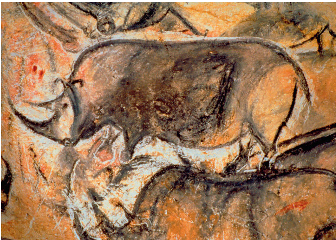
Носорог из пещеры Шове нарисован примерно 33 000 лет назад