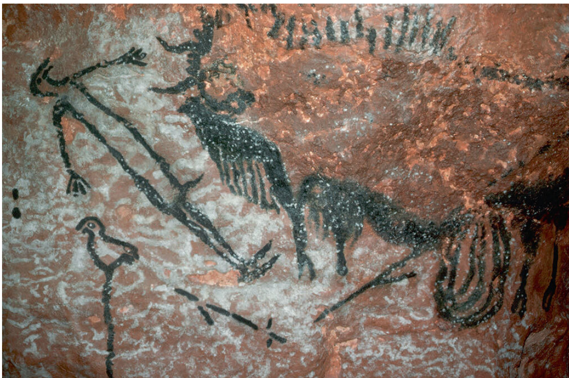
Наскальная живопись в пещере Ласко: сцена охоты с одним из первых известных изображений человека