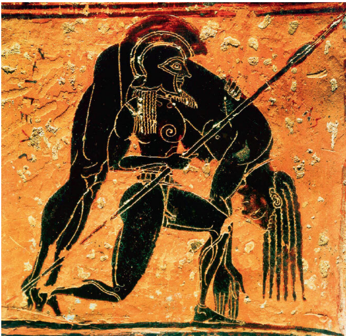
Фрагмент изображения на ручке Вазы Франсуа: Аякс несет тело мертвого Ахилла.

Разбитая на 638 кусочков, ваза была почти полностью восстановлена. Кратер (древнегреческий сосуд для смешивания вина с водой с широкой горловиной и двумя ручками по бокам) необычайно больших размеров (66 см в высоту) выполнен в технике чернофигурной росписи. Это ранний пример керамики, подписанный мастерами: гончаром Эрготимом и художником Клитием. Осознание авторами своей творческой индивидуальности – одно из завоеваний греческой культуры.