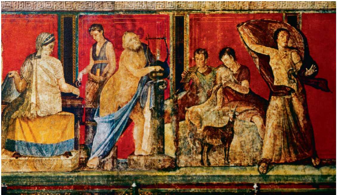
Фрески виллы Мистерий свидетельствуют о почитании в Помпеях Диониса, распространение культа которого относится ко II в. до н. э.