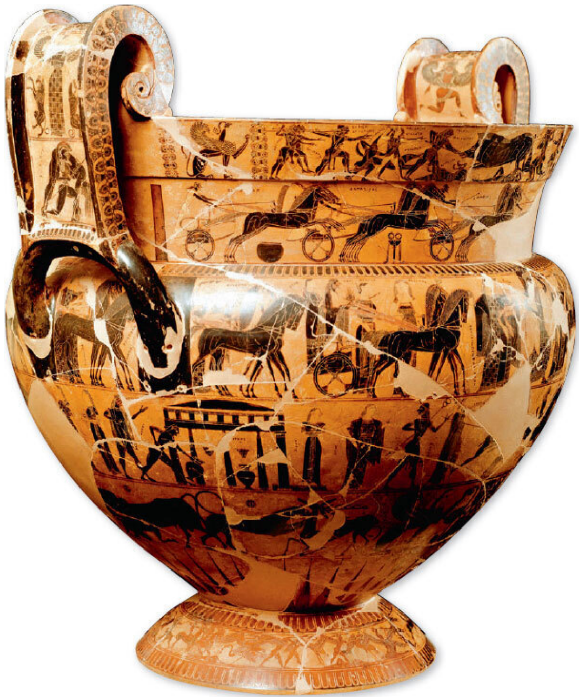
Гордость Археологического музея Флоренции, Ваза Франсуа создана ок. 570 г. до н. э. гончаром Эрготимом и художником Клитием.