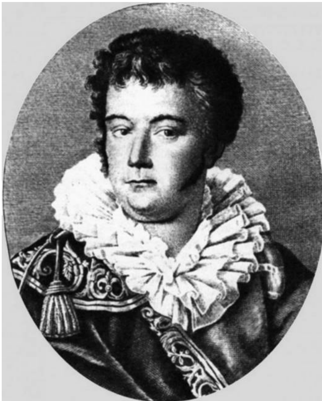
Алексей Яковлев. Гравюра XIX в.

«Звездный час» Яковлева начался не сразу и растянулся на семь лет – примерно с 1804 по 1811 год. Он прославился как великолепный исполнитель главных ролей в классических пьесах У. Шекспира, Ф. Шиллера, Ж. Расина, Вольтера. Именно Алексей Яковлев стал первым Отелло (1806) и Гамлетом (1810) на русской сцене. Правда, это были не «оригинальные» шекспировские роли, а исполнение переделок оригинала.