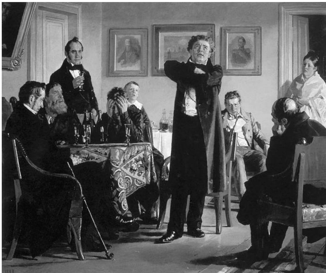
Актер Мочалов среди почитателей. Художник Н.В. Неврев. 1888 г.

В сущности, Мочалов всю жизнь играл одну многогранную роль – разочарованного, полного страдания мыслящего человека, остро осознающего свое одиночество и пороки окружающего мира и становящегося в итоге либо борцом, либо жертвой. Недаром его звездной ролью стал Гамлет (первый русский поэтический перевод пьесы У. Шекспира, сделанный Н.А. Полевым, 1837). За эту пьесу Мочалов сражался самоотверженно – против постановки высказались буквально все, от М.С. Щепкина до дирекции театра. Но Павел Степанович поставил жесткое условие: или он уходит из труппы, или «Гамлет» будет. И премьера, состоявшаяся 22 января 1837 года, за пять дней до пушкинской дуэли, потрясла зрителей. Гамлет – Мочалов поражал то вспышками ярости, то осознанием своей обреченности, срывами в отчаяние, скорбью, которые сменялись четким осознанием своей готовности к итоговой борьбе. Общее мнение публики выразил смотревший спектакль восемь раз В.Г. Белинский: «Мы видели чудо». Через год критик написал специальную статью «“Гамлет”, драма Шекспира. Мочалов в роли Гамлета», где утверждал, что на сцене зрители видели Гамлета «не столько шекспировского, сколько мочаловского», потому что исполнитель «придал Гамлету более силы и энергии... и дал ему грусти и меланхолии гораздо менее, нежели сколько должен ее иметь шекспировский Гамлет». Белинский считал Мочалова «единственным в Европе талантом для роли Гамлета» и утверждал, что дарование Мочалова является «великим и гениальным».