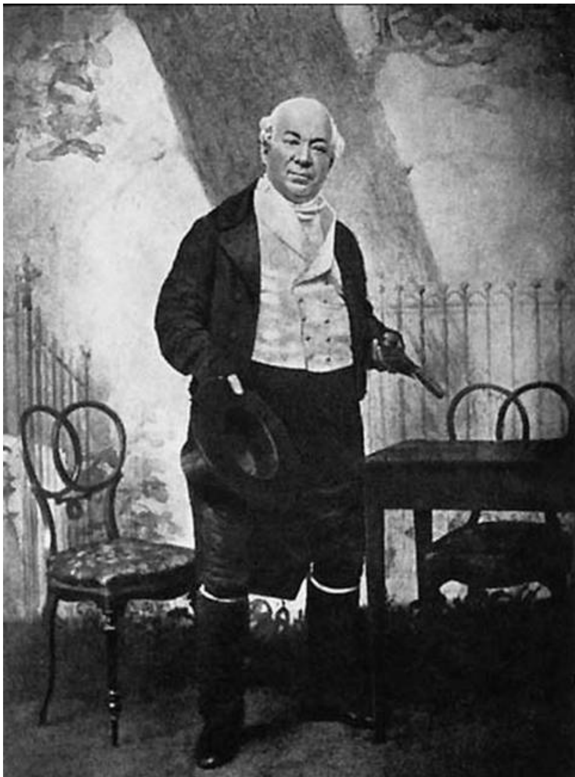
Василий Живокини в роли Жовиаля. Фото второй половины XIX в.

С 14 октября 1824 года и до самой смерти, на протяжении полувека, актер был верен Малому театру и со временем стал одним из символов театральной Москвы. На ранних этапах карьеры он удачно совмещал несколько театральных профессий – был музыкантом в оркестре, исполнял оперные партии, танцевал в балетах (роль Амура в «Амуре и Психее» К. Кавоса), но затем сосредоточился на актерской карьере. Живокини мастерски играл все роли, в которых был хотя бы оттенок комизма, – от купцов Островского, гоголевских и грибоедовских персонажей (в «Ревизоре» он был выдающимся Добчинским, а в «Горе от ума» – Репетило-