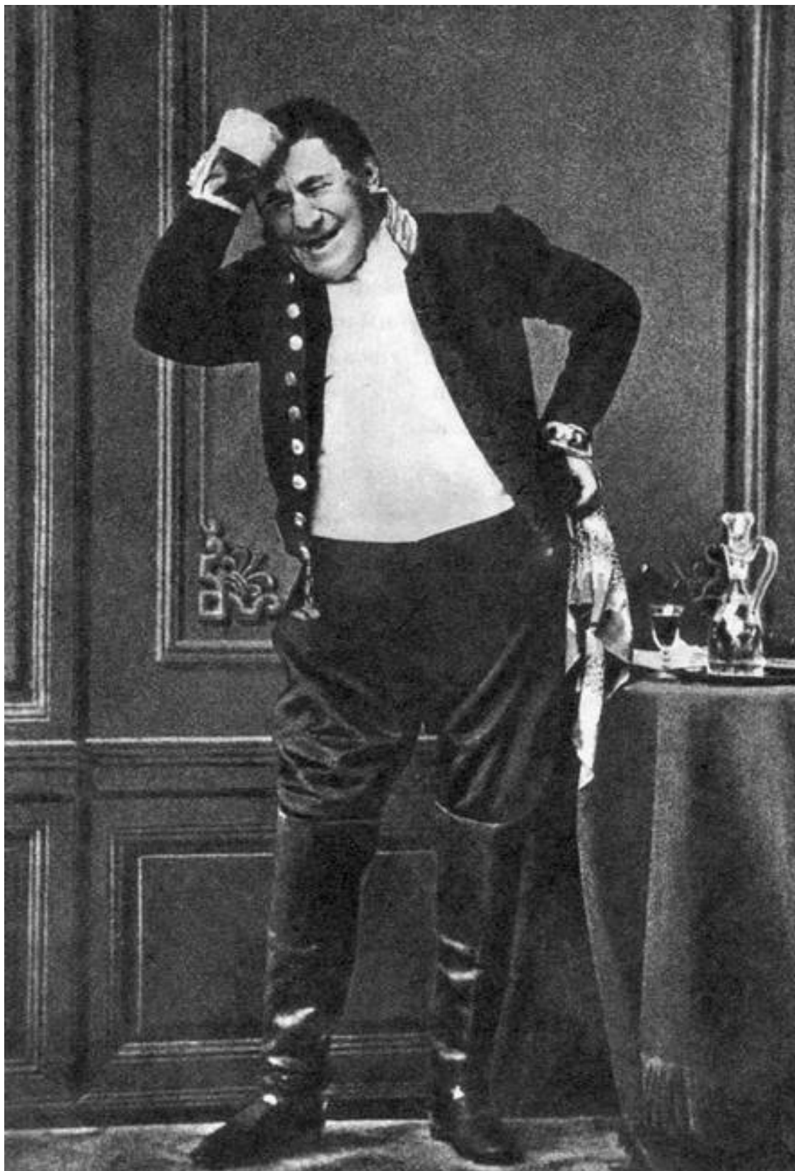
Иван Сосницкий в роли Городничего. Фото второй половины XIX в.

В истории русского театра Сосницкий остался как один из лучших мастеров перевоплощения. Так, в комедии Вольтера «Чем богат, тем и рад» он играл сразу восемь разных ролей. В.Г. Белинский так писал об артисте: «Сосницкий превосходен, невозможно требовать боль-