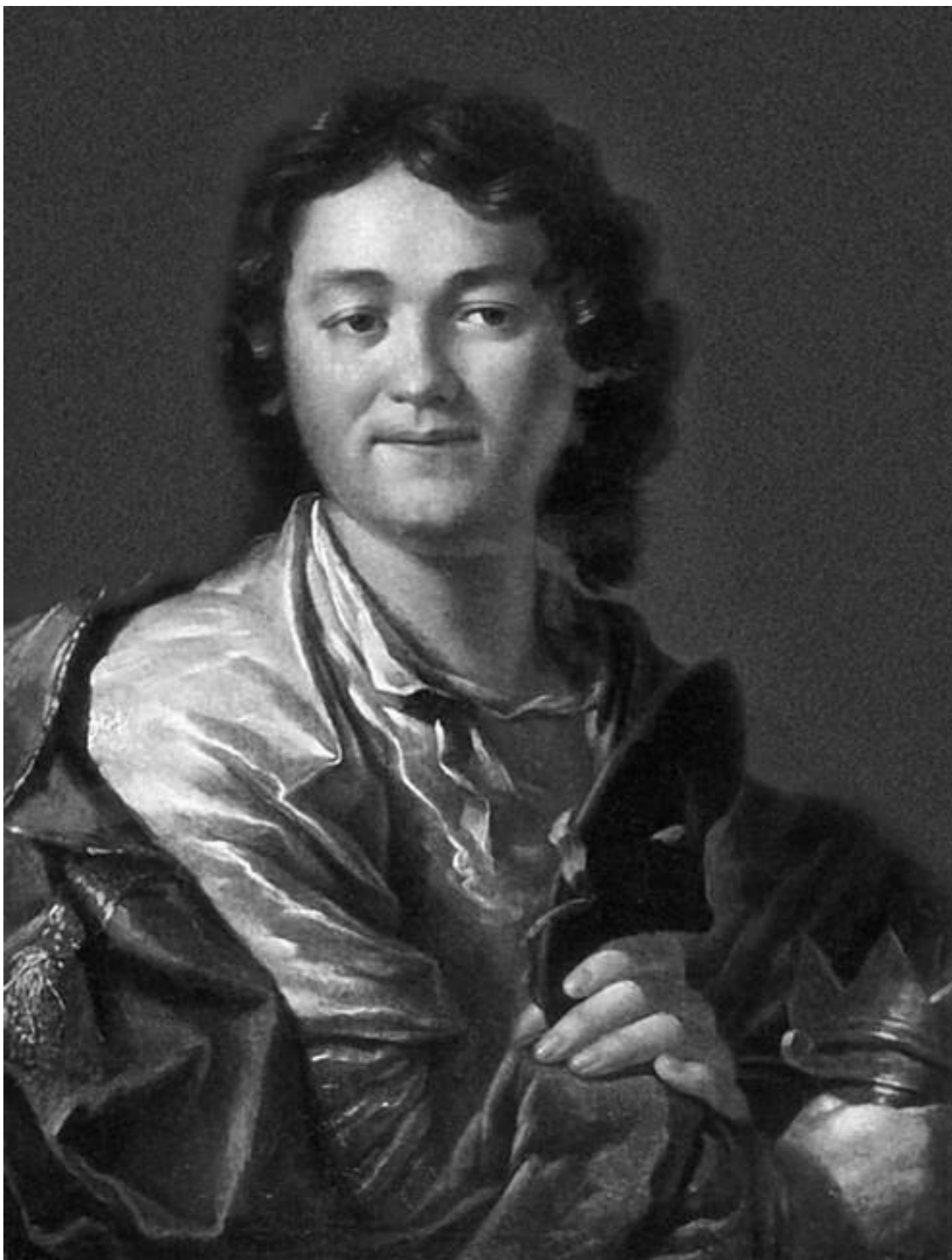
Федор Волков. Художник А.П. Лосенко. 1763 г.

Похоронили Федора Волкова на кладбище московского Андроникова монастыря, но, к сожалению, его могила была утрачена. Только в конце XX века на кладбище был установлен мемориальный знак в память о создателе русского театра.