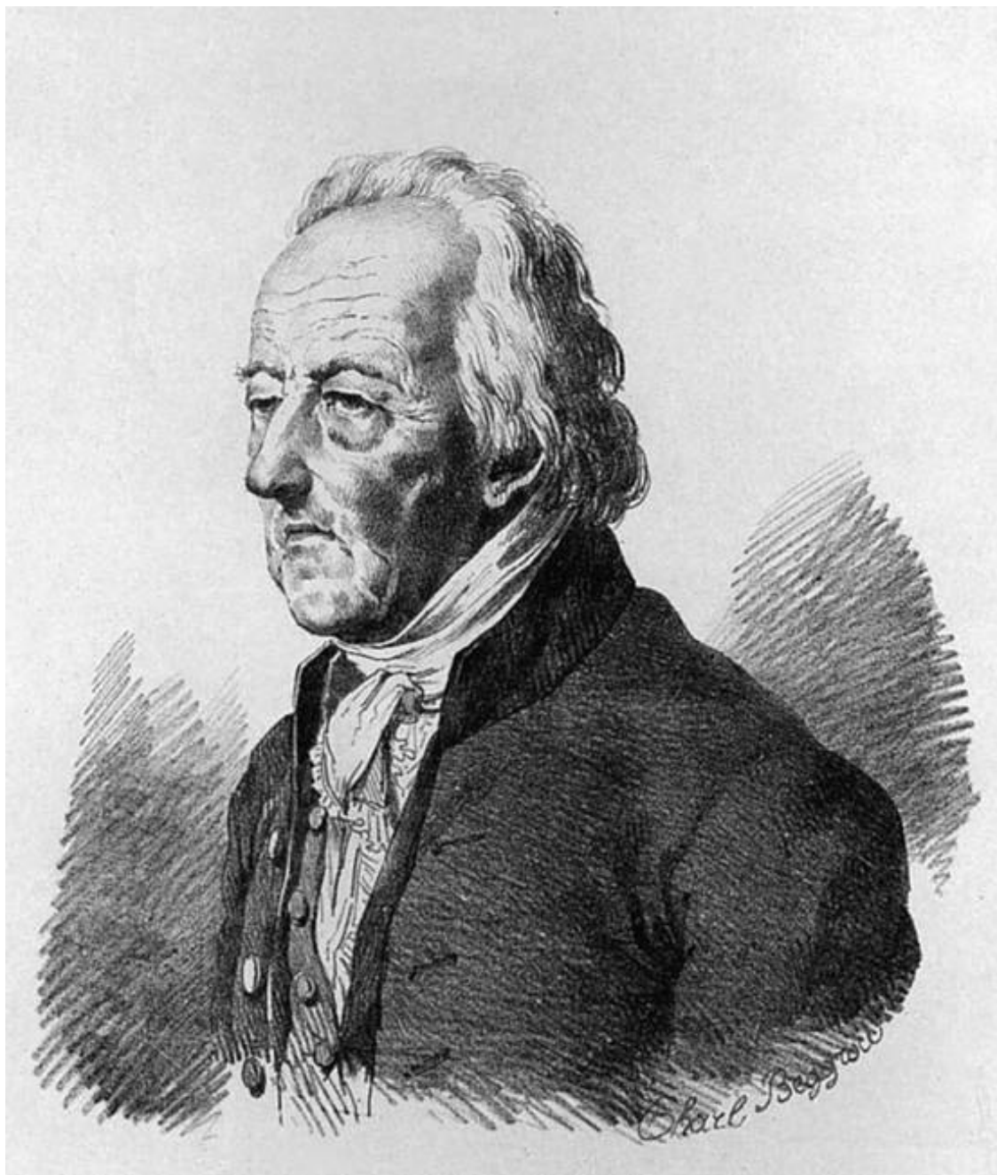
Иван Дмитревский. Гравюра XIX в.

Интересно, что уже современники отмечали несовершенство актерской техники Дмитревского. Он обладал негромким и несильным голосом, к тому же сильно шепелявил; знатоки театра находили его трагедийные роли слишком напыщенными, кокетливыми и одновременно холодными. Но одновременно все в голос признавали удивительную особенность Дмитревского-актера – когда он находился на сцене, все мгновенно покорялись магии его игры, не обращая внимания на недостатки.