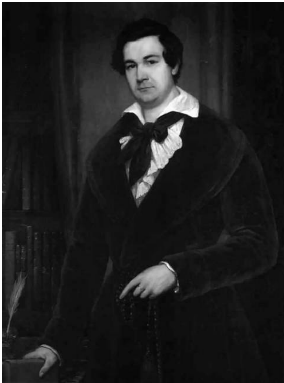
Портрет Василия Каратыгина. Художник В.А. Тропинин. 1842 г.

Но когда горячился, то голос изменял ему и видно было, что говорит юноша. После каждого акта со всех сторон начинались суждения; но общий результат оных был тот, что он много обещает. Теперь еще произношение неправильно, жесты неловки и часто неприличны; излишнее мотание головою, неуместная горячность и прочие недостатки весьма приметны. Однако ж в некоторых местах произносил он стихи превосходно».