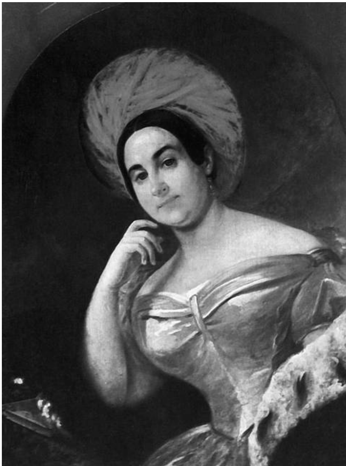
Екатерина Семенова. Художник К.П. Брюллов. Около 1836 г.