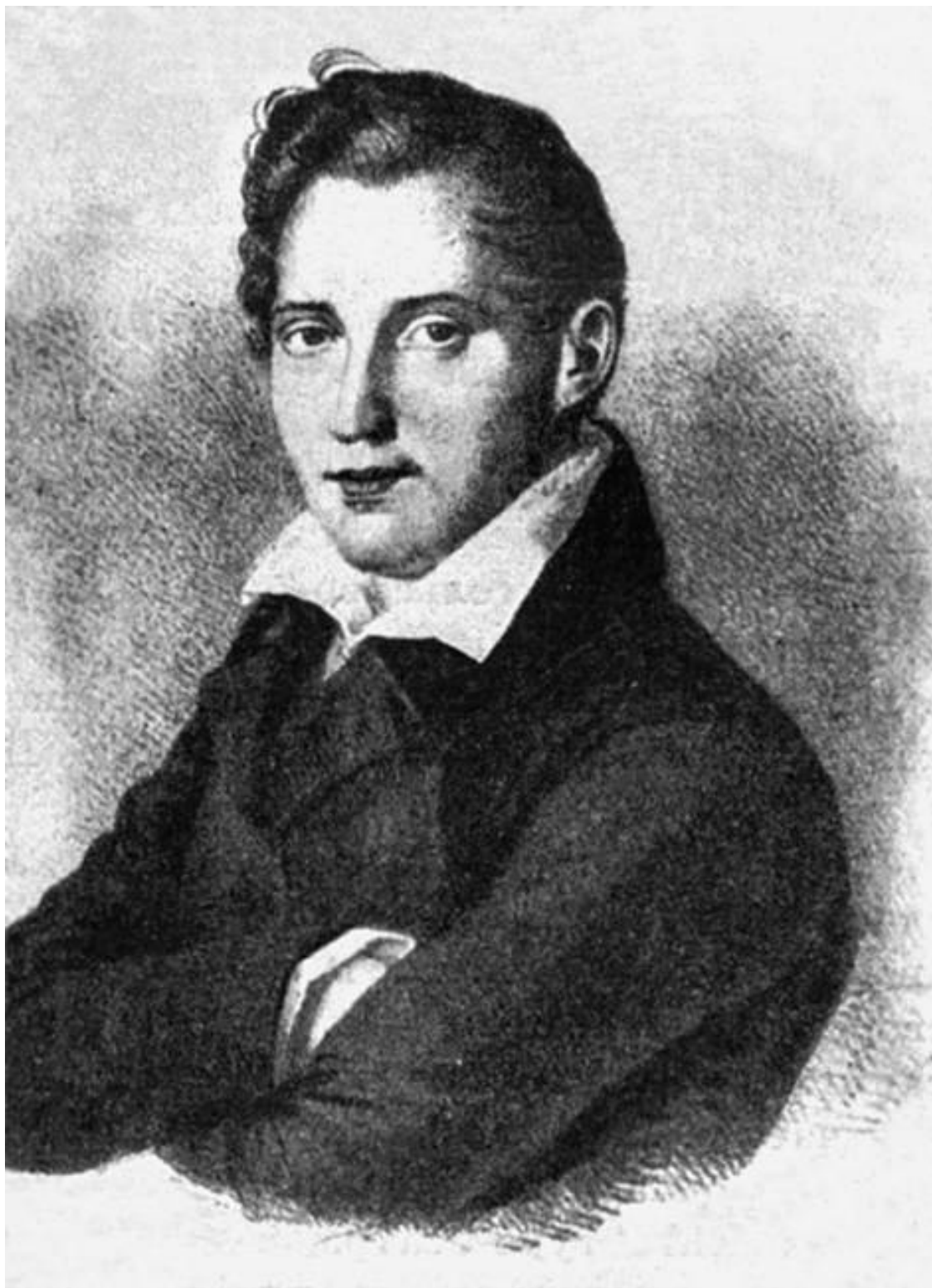
Николай Дюр. Гравюра 1830-х гг.

Театральной карьере Николай был обязан родной тетке – Екатерине Колосовой. Именно легендарная балерина содействовала поступлению племянника в Петербургское театральное училище, где педагогом Николая стал великий балетмейстер тех лет Шарль Дидло. Но быстрый успех на драматической сцене родной сестры Любви и двоюродной сестры Александры заставил юношу задуматься о верности избранного пути. В итоге Николай так и не стал танцовщиком и в 1828 году дебютировал на сцене в роли Грифьяка (комедия А.А. Шаховского