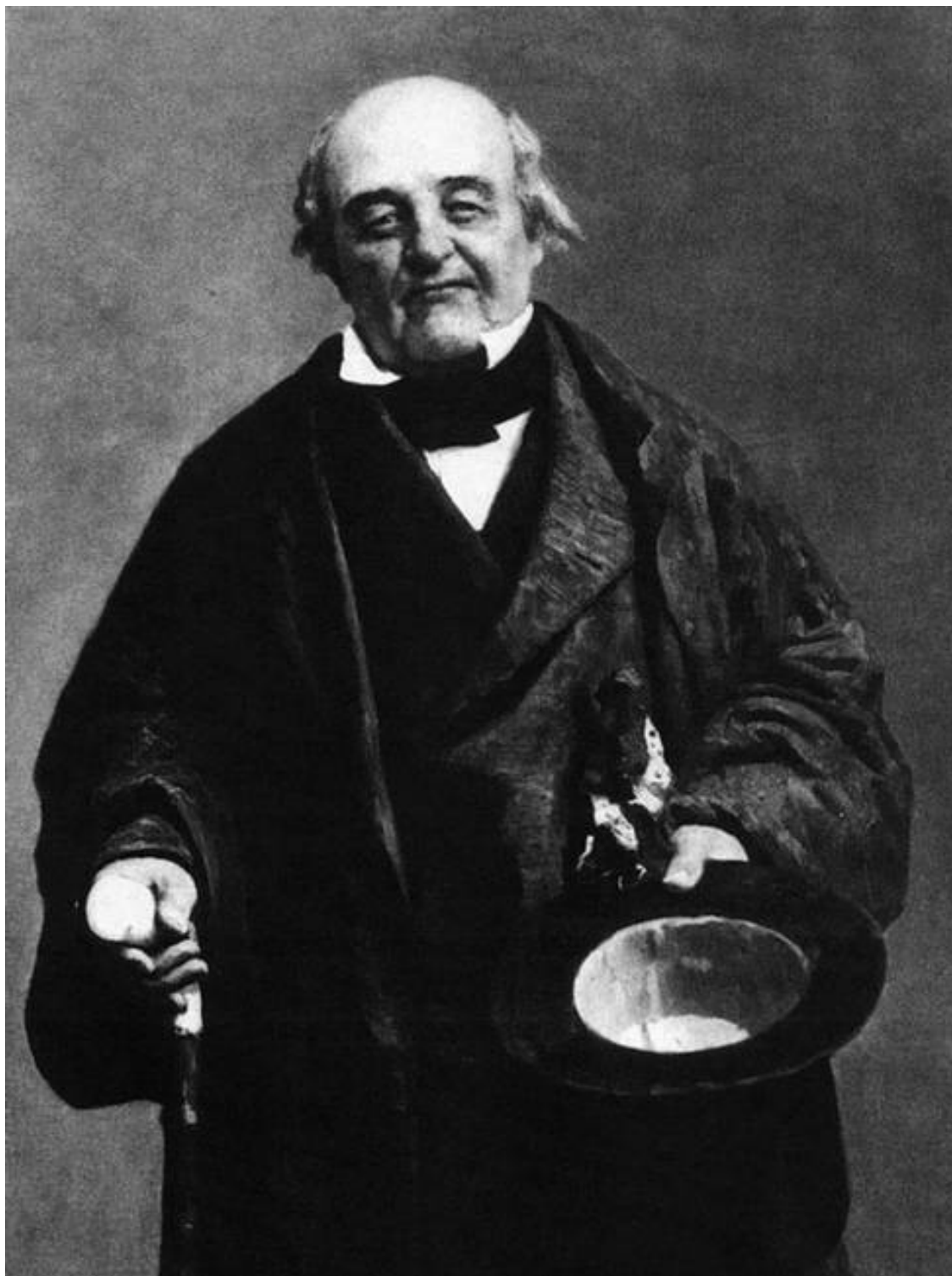
Михаил Щепкин. Фото второй половины XIX в.

Новыми гранями гений актера заблистал в 1830-е годы, когда он создал на сцене образы Фамусова («Горе от ума» А.С. Грибоедова), Городничего («Ревизор» Н.В. Гоголя; его Городничий, по воспоминаниям современников, был «героический, величавый мошенник, одаренный государственной мудростью и удивительной находчивостью») и Шейлока («Венецианский купец» У. Шекспира). Однако, оценив широкие возможности Щепкина, русские драматурги (и публика), по большому счету, так и не увидели в нем актера-Протея, способного на самые невероятные перевоплощения, видящего в своих персонажах глубины, о которых часто не догады-