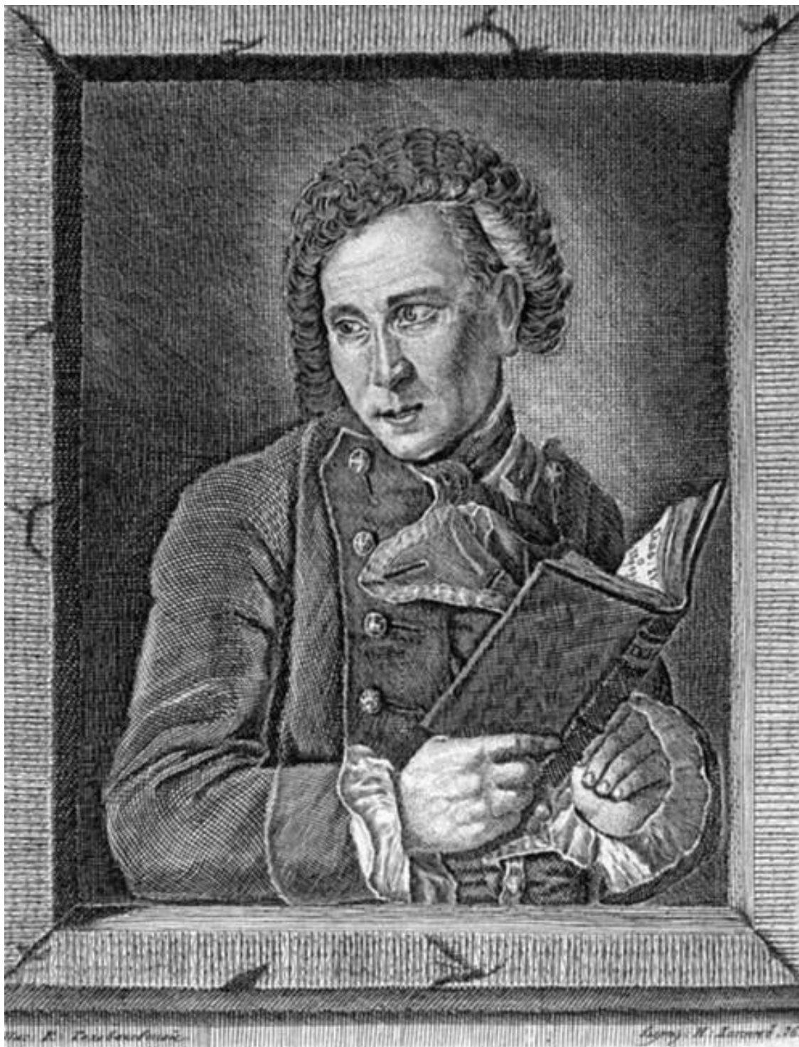
Яков Шумский. Гравюра XVIII в.

Обладая прекрасным голосом, Шумский получил известность также в качестве оперного певца, причем стал первым исполнителем партий Афанасия в опере «Несчастье от кареты» В.А. Пашкевича, Крестьянина в опере «Санкт-Петербургский гостинный двор» М.А. Матинского, Анкудина в опере «Мельник – колдун, обманщик и сват» М.М. Соколовского. Одновременно актер вел большую преподавательскую работу.