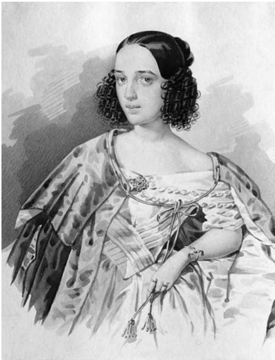
Варвара Асенкова. Акварель 1839 г.

Помочь Варе взялся знаменитый актер Иван Сосницкий, в паре с которым играла Александра Асенкова. По ее просьбе Сосницкий начал учить девушку актерскому мастерству, но поначалу был потрясен полным отсутствием в юной Асенковой хотя бы минимального таланта и интереса к занятиям. Сосницкий уже собирался махнуть рукой на бездарную ученицу. Но во время одного из уроков Варя с неожиданным темпераментом прочла монолог из пьесы «Мать и дочь – соперницы», и проницательный актер понял, что с Асенковой можно и нужно работать. Сосницкий предложил ей роль в своем бенефисе – водевилях «Сулейман II» Ш. Фавара и «Лорнет» Э. Скриба. И день 21 января 1835 года неожиданно для всех ознаменовался рожде-