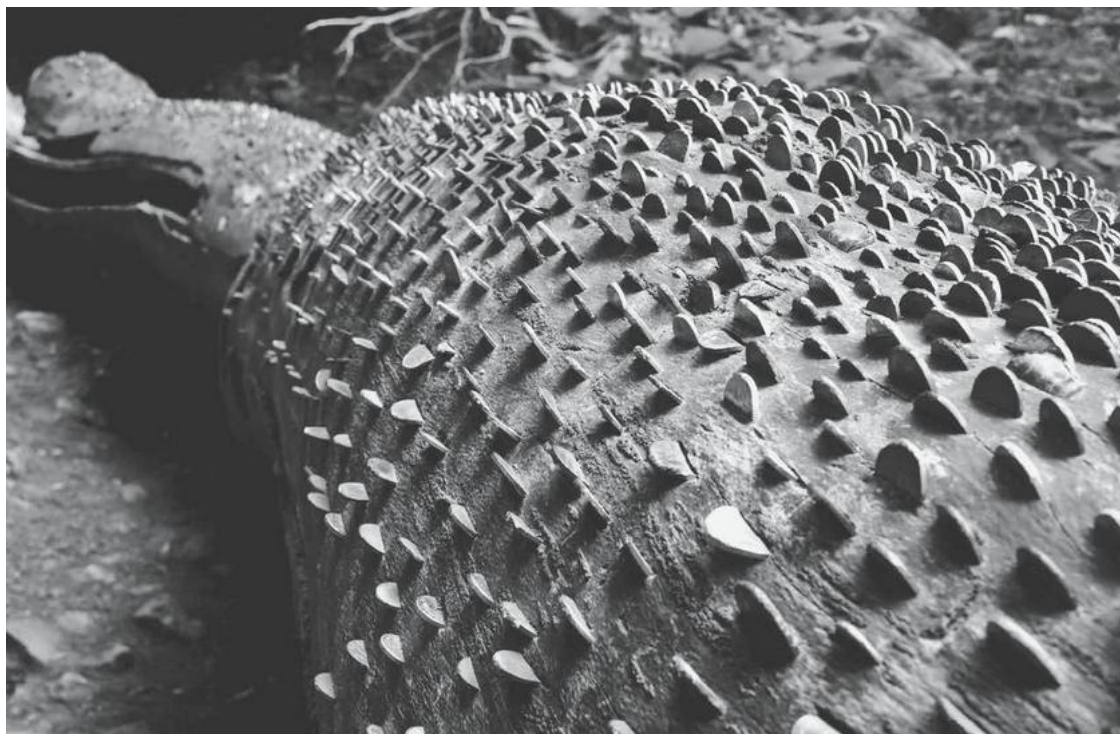
Рис. 1.8. Монетное дерево, Мейлском Вуд, Глостершир, Великобритания.

Интересным примером в этом ряду являются так называемые «монетные деревья», распространенные на Британских островах (рис. 1.8) 50 . За последние три столетия сотни такого рода деревьев, пней и бревен были забиты тысячами монет. По большей части это совсем недавняя человеческая деятельность, которая демонстрирует поныне продолжающуюся эволюцию. Первоначально монеты забивались в дерево для ритуального исцеления, однако сегодня эта практика поддерживается только в виде простого подражания. Люди, проходящие рядом с монетными деревьями и незнакомые с их историей, тем не менее не желают уклоняться от нее, чтобы не навлечь на себя беду 51 .