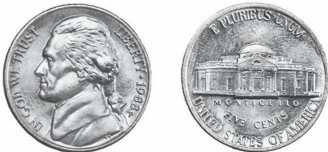
Рис. 1.11. Мельхиоровая пятицентровая монета, Филадельфия, 1988 г. Томас Джефферсон / Монтичелло.