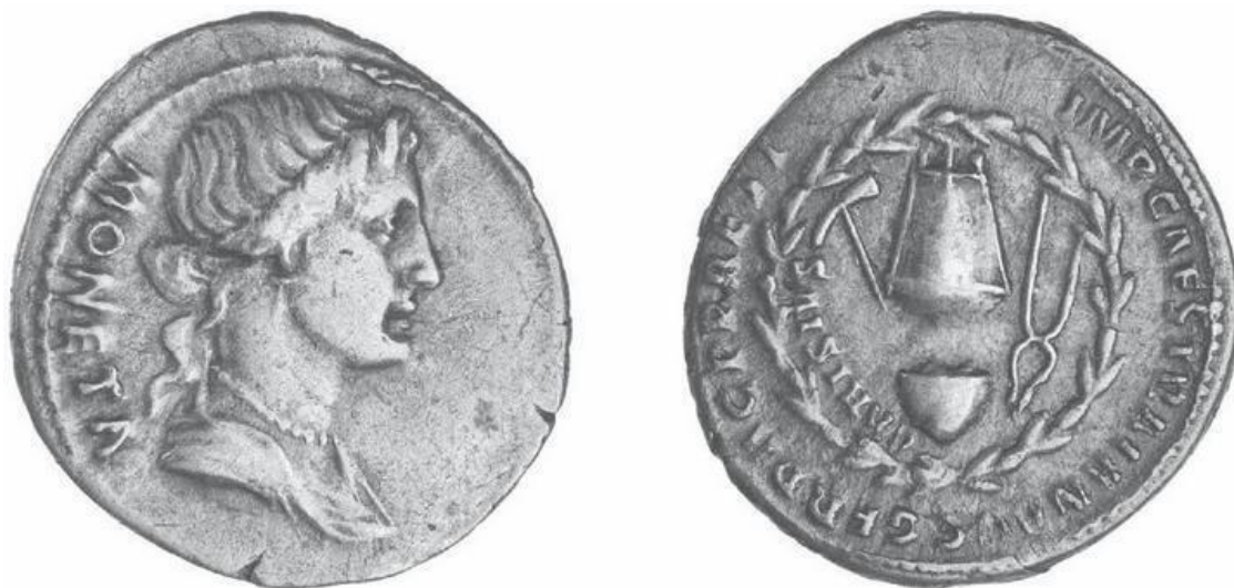
Рис. 1.3. Серебряный денарий Траяна, Рим, 98–117 гг. Юнона Монета / Инструменты для чеканки.

Очевидно, что изменчивая концепция денег продолжает развиваться и в наши дни. Вообще, английский термин money «деньги», как и группа родственных ему понятий, таких, как monetize «монетизировать», monetary «монетный», mint «монетный двор» и mintage «монетное производство» 31 , обязаны своим происхождением римской богине Юноне Монете. Ее изображение появляется на некоторых античных монетах вместе с инструментами, использовавшимися для изготовления монет (рис. 1.3).