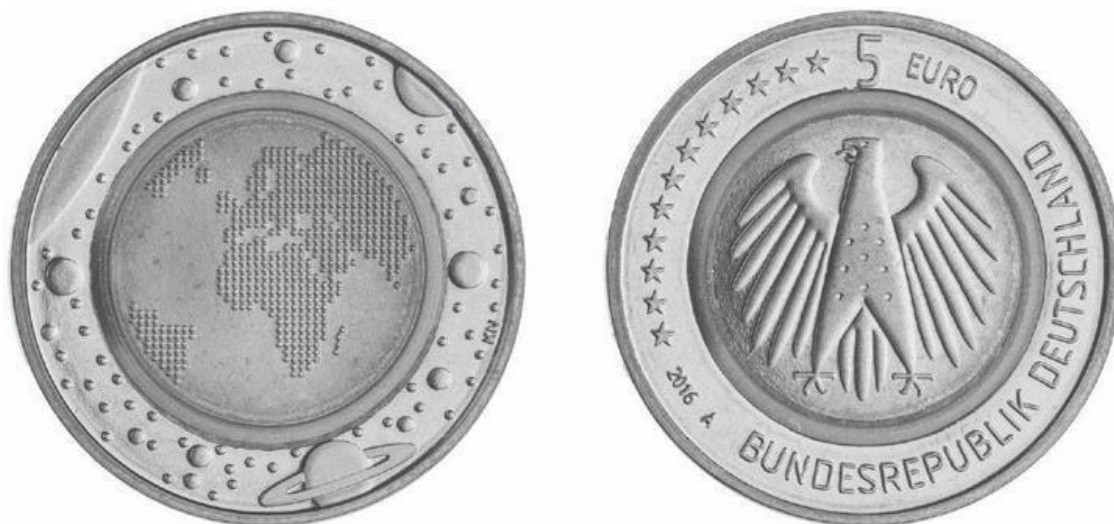
Рис. 1.5. Мельхиорово-пластиково-мельхиоровая 37 монета в пять евро, Берлин, 2016 г. Карта мира / Орел. ANS 2018.8.1. Воспроизводится с разрешения Американского нумизматического общества.

В 1961 году Королевский монетный двор Великобритании экспериментировал с выпуском пластиковых монет, которые так и не попали в обращение; однако в 2014 году непризнанное государство Приднестровье, расположенное недалеко от Черного моря, впервые в мире выпустило в обращение пластиковые монеты четырех разных форм, переливающиеся различными яркими цветами 38 . В Германии была выпущена монета достоинством в пять евро со встроенным пластиковым кольцом (рис. 1.5), добавление которого было нацелено на борьбу с фальшивомонетчиками; при этом каждый монетный двор, выпускавший такие монеты, использовал свой цвет пластикового кольца. Зачастую, мы можем образно сказать, что «деньги говорят», однако в Монголии эта фраза обретает реальный, а не переносный смысл: на монгольской монете 2007 года в 500 тугриков изображен портрет Джона Кеннеди и написана фраза «Ich bin ein Berliner» из его знаменитой речи 1963 года в Западном Берлине, которая к тому же начинает воспроизводиться после нажатия крошечной кнопки. Эти выпущенные ограниченным тиражом монеты продавались быстрее, чем коллекционеры успевали повторить за Кеннеди по-немецки «я – берлинец» 39 .