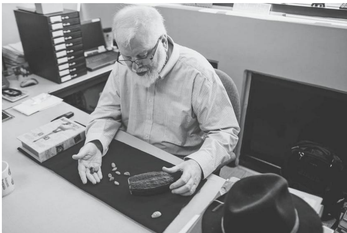
Рис. 1.6. Автор со стручком какао и его семенами, использовавшимися в качестве денег в ранней Мезоамерике.

Когда мы говорим, что деньги не растут на деревьях, мы забываем изобретательных мезоамериканцев 42 . Первые европейские исследователи удивлялись тому, что жители Нового Света ценили какао выше золота и использовали его в качестве денег (рис. 1.6). Один летописец XVI века писал: «Я прекрасно понимаю, что люди со слабым воображением обвинят меня в фантазиях, когда я рассказываю о деревьях, приносящих деньги» 43 . Он называл их «счастливыми деньгами» и превозносил удовольствие, получаемое от них 44 . Конечно, мы с вами не можем выпить наши деньги, как майянские аристократы, однако мы можем таинственным образом превращать кусочки бумаги, пластика, дешевых металлов или даже неосязаемый цифровой код в чашку дымящегося какао. С самого начала процесса приручения животных и ведения сельского хозяйства крупный рогатый скот и другие живые существа служили валютой для человека.