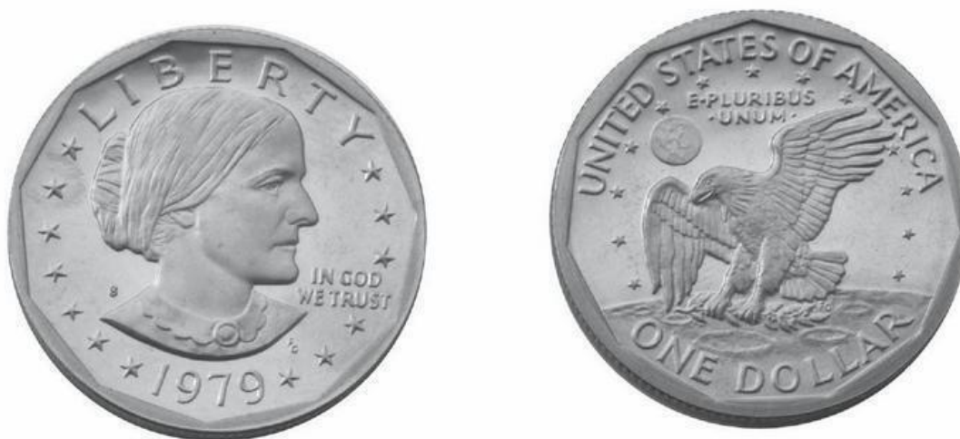
Рис. 1.12. Мельхиорово-медный доллар США, Сан-Франциско, 1979 г. Сюзан Б. Энтони / Орел приземляется на Луну. ANS 1983.156.41.

практически неотличим от монеты в 25 центов: разница в размерах между долларом Энтони и четвертаком составляла всего 2,24 мм. В результате доллар Энтони оказался в прямой конкуренции с четвертаками, играющими незаменимую роль в размене и сдаче. Впрочем, единственный честный способ проверить наши предположения – это провести в этой монетарной битве полов эксперимент с номиналами меньше доллара.