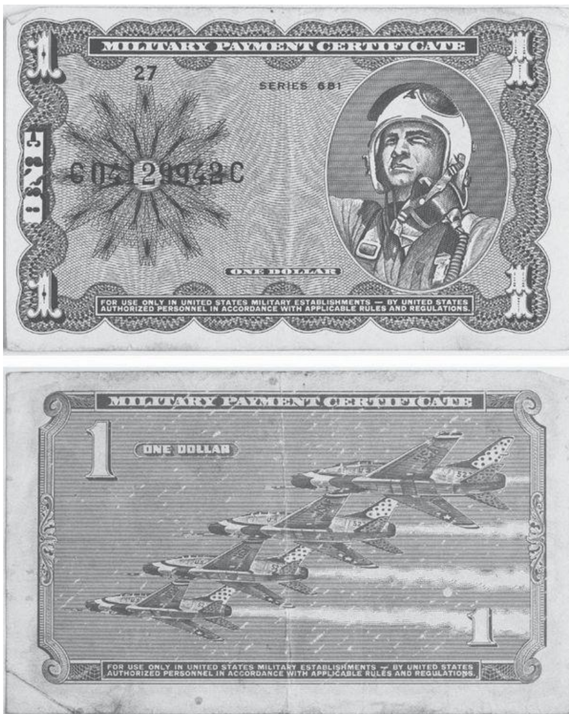
Рис. 1.4. Боны Министерства обороны США для использования в Южном Вьетнаме, Вашингтон, 1969–1970 гг. Пилот / Истребители. ANS 2018.14.4. Воспроизводится с разрешения Американского нумизматического общества.

В Германии, разоренной после Первой мировой войны, гиперинфляция вынуждала бедствующие общины печатать собственные деньги для чрезвычайных ситуаций на алюминиевой фольге, шелке или кусочках дерева. Министерство обороны США во время вьетнамской войны выпускало специальные боны оккупационных властей для военнослужащих (рис. 1.4), что практикуется и сегодня в войсках, дислоцированных в Афганистане 36 .