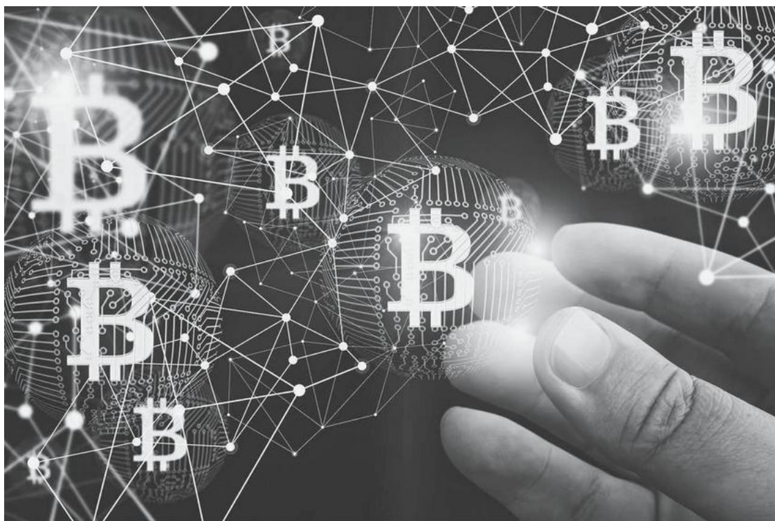
Рис. 1.2. Биткоин: пример дематериализованной криптовалюты.