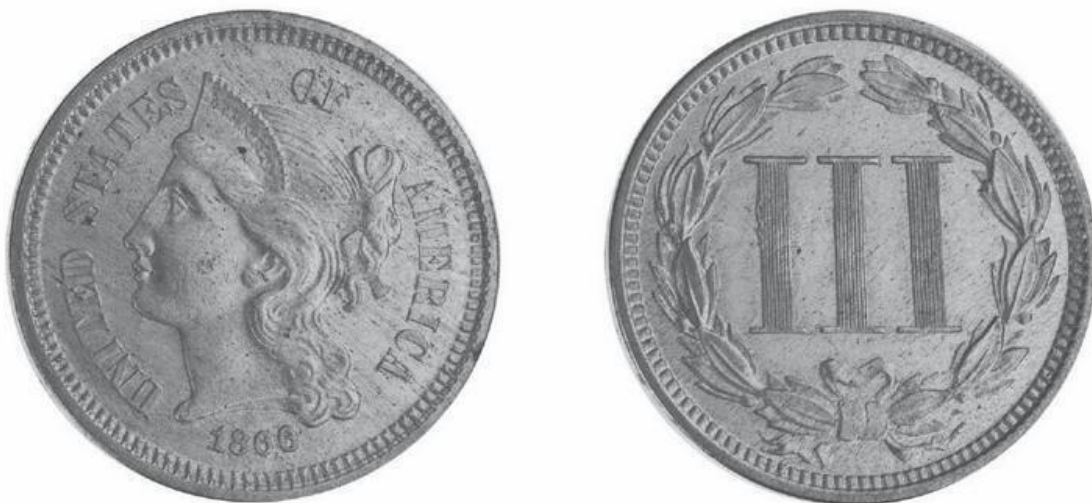
Рис. 1.13. Медно-никелевая трехцентровая монета, Филадельфия, 1866 г. Свобода / Число III в венке. ANS 1908.93.145. Воспроизводится с разрешения Американского нумизматического общества.