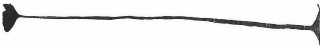
Рис. 1.7. Железные деньги кисси из Либерии. ANS 0000.999.75838. Воспроизводится с разрешения Американского нумизматического общества.

Зачастую деньги были живыми существами, а в некоторых культурах они даже могли иметь душу. Ярким примером такого отношения являются деньги Западной Африки, называемые кисси (рис. 1.7) 46 . Эта валюта, которую начали изготавливать в конце XIX века из скрученных железных стержней, имела на одном конце «ухо» ( нлинг ), а на другом «ногу» ( кодо ). Когда стержень ломался, то он терял всякую ценность и уже не мог обращаться в качестве валюты, если только шаман не «исцелял» его должным образом. Его ритуал восстанавливал сбежавшую душу денег и возвращал стержню силу. Европейские колонизаторы отменили обращение кисси , но они до сих пор используются в церемониальных обрядах.