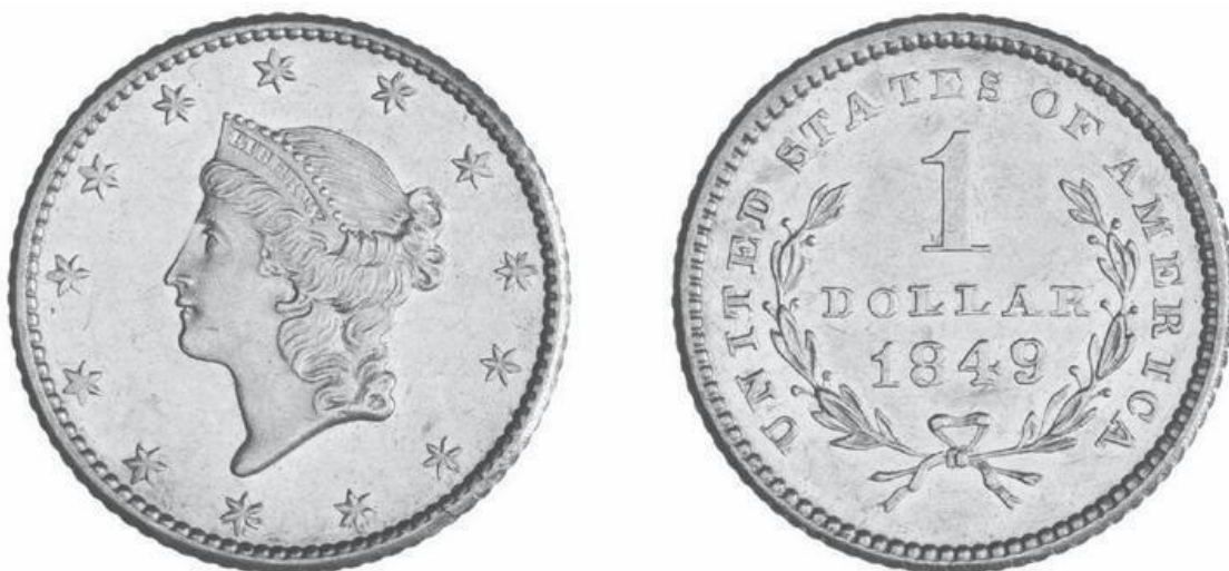
Рис. 1.1. Золотой доллар Федерального резервного банка США, 1849 год. Свобода / Венок 21. ANS 2010.37.1.

Именно поэтому люди и поныне могут найти в своих карманах и кошельках дань уважения Линкольну – как отчеканенную на одноцентовой монете, так и напечатанную на пятидолларовой купюре. И то и другое теперь деньги, обе они – валюты и обе «отчеканены» конституционной властью в стране, спасенной, помимо прочего, благодаря расширительному толкованию одного-единственного слова.