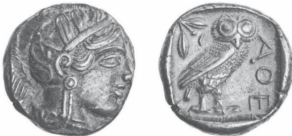
Рис. 1.14. Серебряная тетрадрахма), Афины, 450–400 гг. до н. э. Афина / Сова. ANS 1949.128.2.

свою собственную валюту и одновременно выражали через нее уникальность своей полисной идентичностью. Монеты стали нести характерный рисунок, который нумизматы называют «тип», и, зачастую, надпись, которая называется «легенда» 76 . Благодаря этим типам и легендам, монеты быстро приобрели новую функцию – эффективных посредников, передававших ключевую информацию из рук в руки. Дизайн древних монет увековечивал исторические события, рекламировал местные продукты, продвигал различные ценности и религиозные культы, демонстрировал военную мощь, а также распространял изображения выдающихся произведений искусства и архитектуры. Например, на афинских городских монетах была изображена богиня Афина, покровительница города, первые буквы названия города (ΑΘΕ), мудрая сова (до сих пор являющаяся символом обучения) и оливковая ветвь, символизирующая основной сельскохозяйственный экспорт полиса (рис. 1.14). Таким образом, в дополнение к своим денежным функциям, монетная чеканка могла копировать, хранить и доставлять информацию способом, недоступным папирусу, пергамену и бумаге. Самые ранние монеты запечатлели в прочных металлах мимолетную историю забытого прошлого, работая как крошечные компакт-диски в античном мире, лишенном других средств массовой коммуникации.