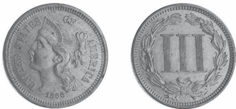
Рис. 1.13. Медно-никелевая трехцентовая монета, Филадельфия, 1866 г. Свобода / Число III в венке. ANS 1908.93.145.

келям или десяти даймам или четырем четвертакам. Это – сильно урезанная система монетной чеканки, которую сегодняшние дети унаследовали от прежних времен, когда американцы имели дело и с полуцентовыми медными монетами (фототабл. 2) и с трехцентовыми никелевыми монетами (рис. 1.13).