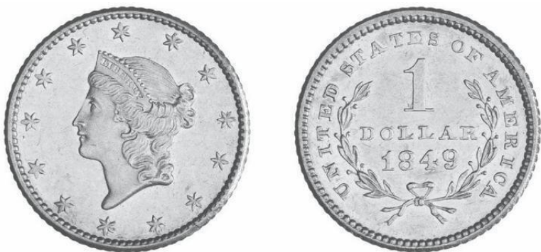
Рис. 1.1. Золотой доллар Федерального резервного банка США, 1849 год. Свобода / Венок 21 . ANS 2010.37.1. Воспроизводится с разрешения Американского нумизматического общества.

хоть они и укоренены в прошлом, однако же они обеспокоены своим будущим. В результате, новый зеленый цвет банкнот занял место рядом с традиционным золотым цветом монет и деньги перестали быть только металлическими.