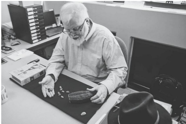
Рис. 1.6. Автор со стручком какао и его семенами, использовавшимися в качестве денег в ранней Мезоамерике.

Римляне вообще называли богатство pecunia , хорошо зная, что оно происходит от pecus «скот» 45 . Этот же корень объясняет и английский термин pecuniary «денежный». Ровно поэтому англичане называют бедняка cowless , то есть «безкоровным», а техасцы опишут пустозвона выражением all hat and no cattle «сам в шляпе, а скотины не имеет». Ко-