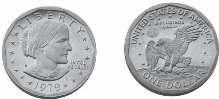
Рис. 1.12. Мельхиорово-медный доллар США, Сан-Франциско, 1979 г. Сьюзан Б. Энтони / Орел приземляется на Луну. ANS 1983.156.41. Воспроизводится с разрешения Американского нумизматического общества.

В связи с различными номиналами интересно отметить, насколько быстро мы забываем, сколько их было в денежной истории США. В детском саду, куда ходит мой внук, висит плакат «Монеты» с большими картинками, которые подписаны «пенни», «никель», «дайм» и «четвертак» 73 . Текст плаката объясняет относительную стоимость каждого номинала, описывает его цвет и называет президента, изображенного на нем. Дети запоминают повседневную математику плаката, согласно которой сто пенни равняются двадцати ни-