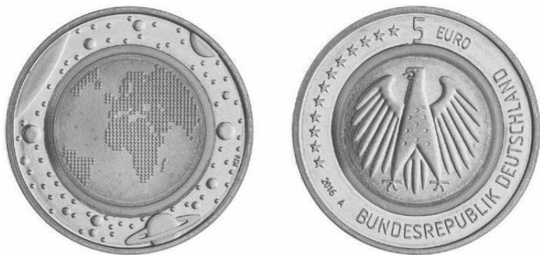
Рис. 1.5. Мельхиорово-пластиково-мельхиоровая 37 монета в пять евро, Берлин, 2016 г. Карта мира / Орел.

В Германии, разоренной после Первой мировой войны, гиперинфляция вынуждала бедствующие общины печатать собственные деньги для чрезвычайных ситуаций на алюминиевой фольге, шелке или кусочках дерева. Министерство обороны США во время вьетнамской войны выпускало специальные боны оккупационных властей для военнослужащих (рис. 1.4), что практикуется и сегодня в войсках, дислоцированных в Афганистане 36 .