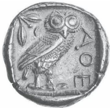
Рис. 1.14. Серебряная тетрадрахма), Афины, 450–400 гг. до н. э. Афина / Сова. ANS 1949.128.2. Воспроизводится с разрешения Американского нумизматического общества.