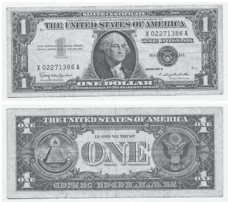
Рис. 1.9. Бумажный доллар, США, 1957 год. Джордж Вашингтон / Символы. ANS 1978.30.10.

и крылатый дракон в Британии или же американское «Annuit cœptis» («Он одобрил начинания») и всевидящее око, выглядывающее из-за недостроенной пирамиды (рис. 1.9, обратная сторона)?