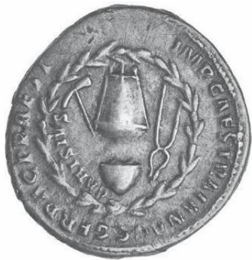
Рис. 1.3. Серебряный денарий Траяна, Рим, 98–117 гг. Юнона Монета / Инструменты для чеканки.

Наречение богини Юноны эпитетом Moneta , происходящим от латинского слова monere «предупреждать», связано с древними легендами о том, что Юнона предупреждала римлян о приближающейся опасности. Поскольку римляне открыли свой первый монетный двор именно в ее храме, то кусочки металла, полученные здесь в процессе чеканки, стали называться «монетами» 32 .