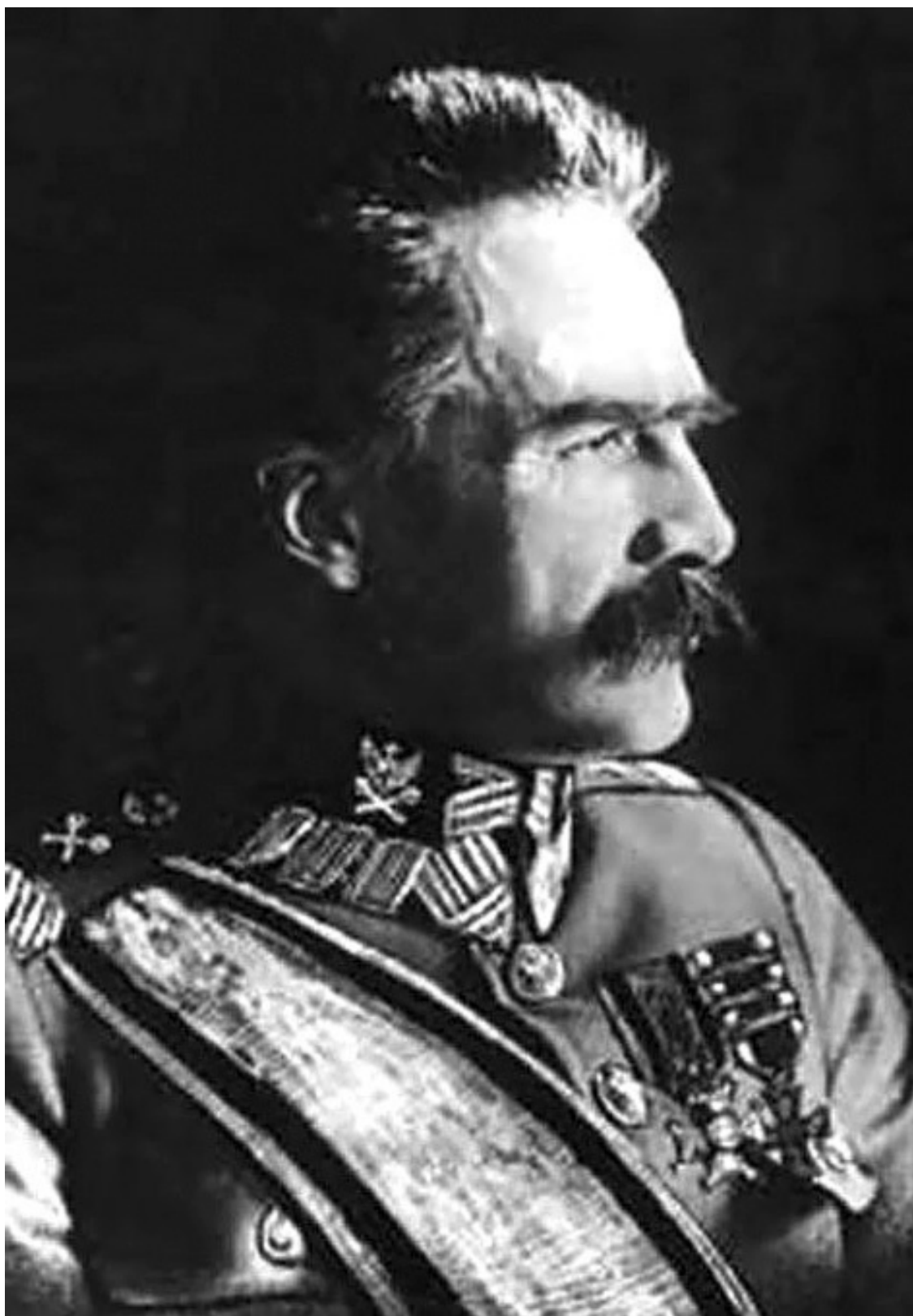
Начальник Польши Юзеф Пилсудский