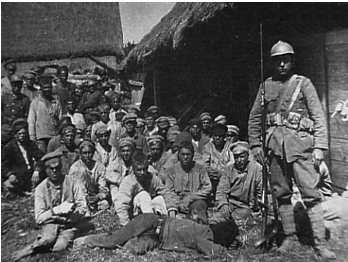
Красноармейцы в польском плену 1920 г.