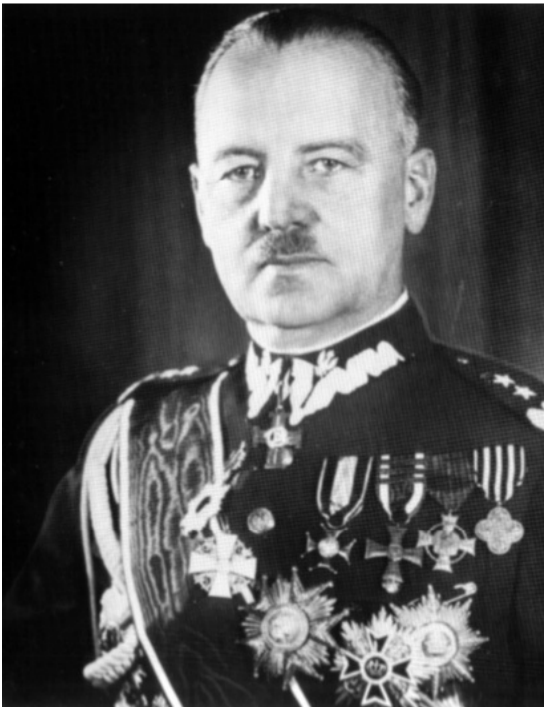
В.Сикорский – глава Польши в эмиграции. Лондон 1942 г.