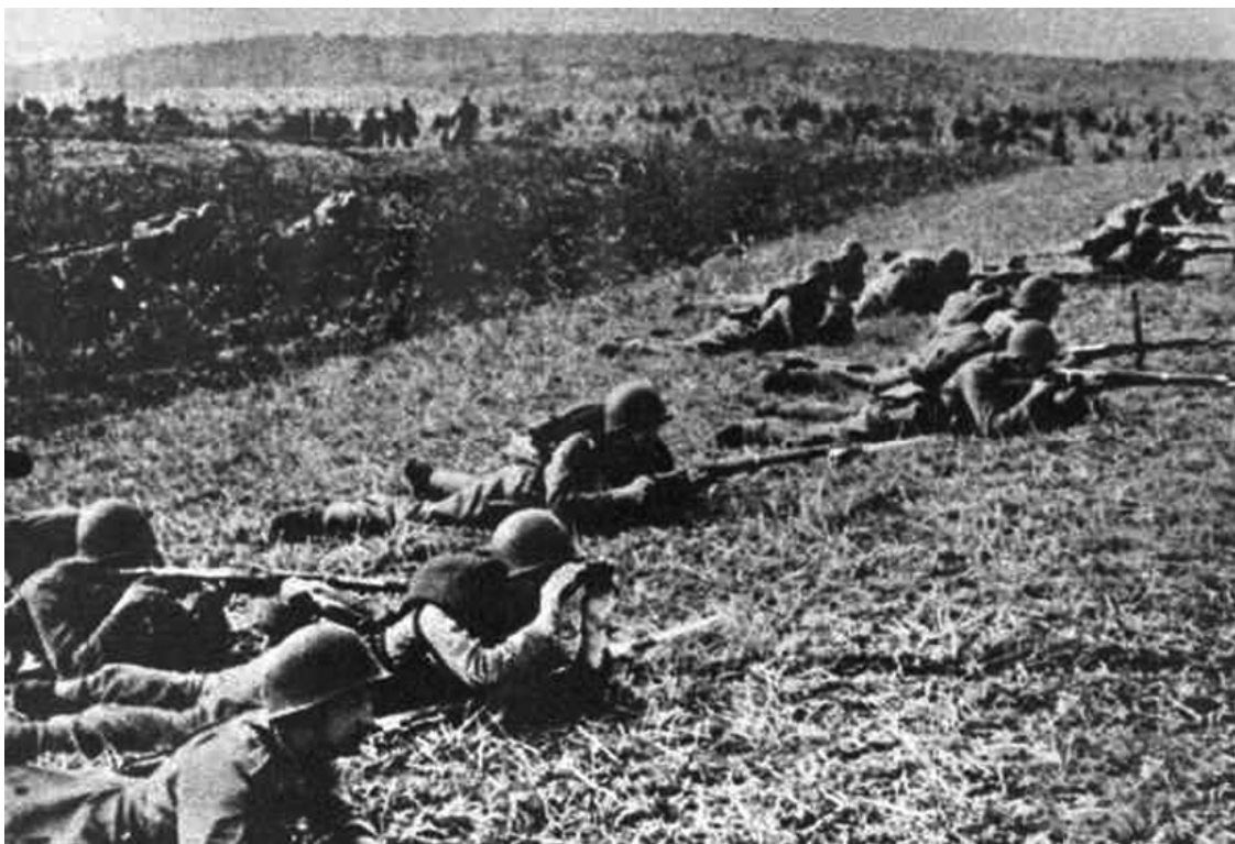
Польская пехота в обороне