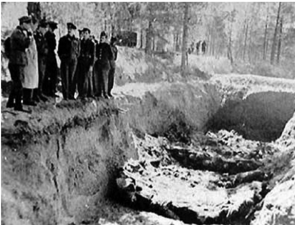
«Находка» немцами захоронений польский офицеров в Катыни. 1943 г.