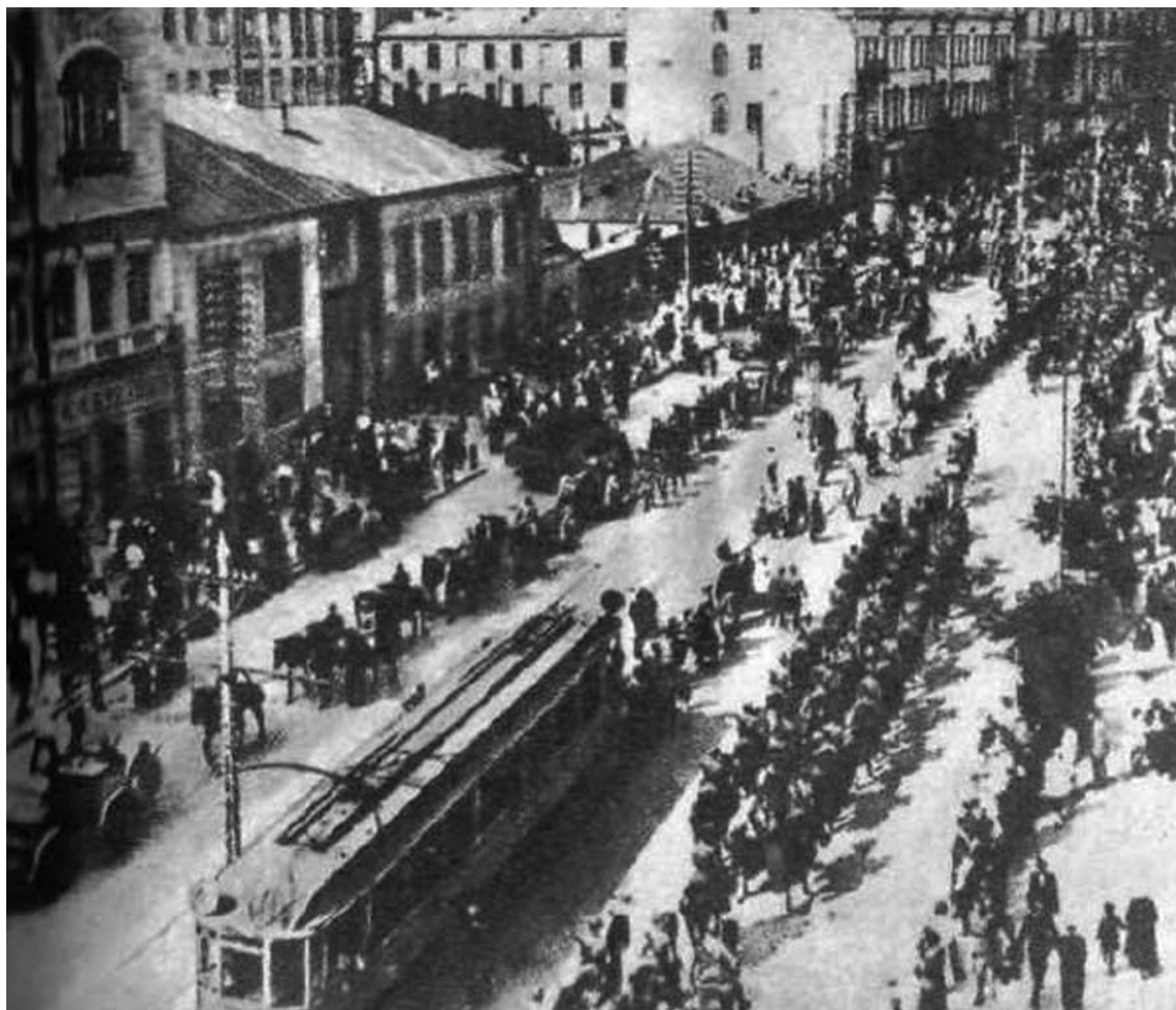
Польско-украинские войска вступают в Киев. 1920 г.