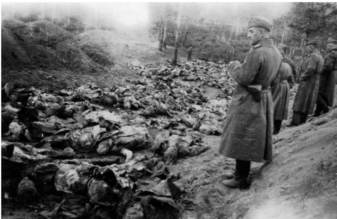
Штабеля жертв в Катыни, складированные с немецкой пунктуальностью