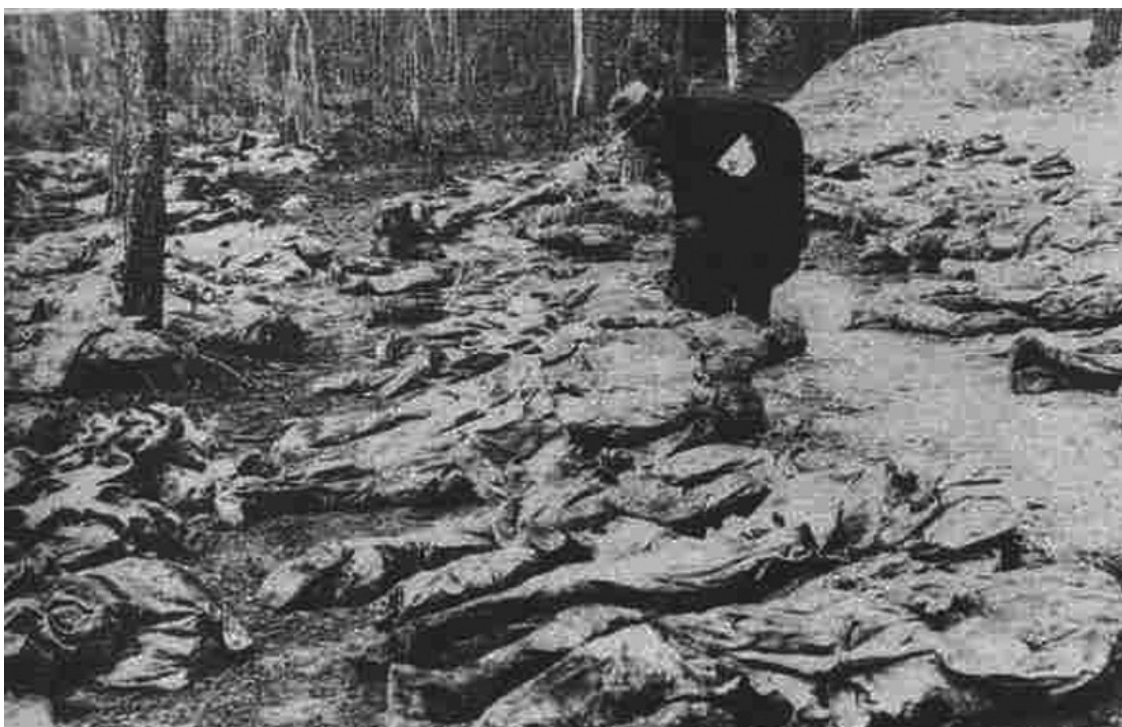
Свезённые трупы польских граждан и «найденные» немцами в Катыни