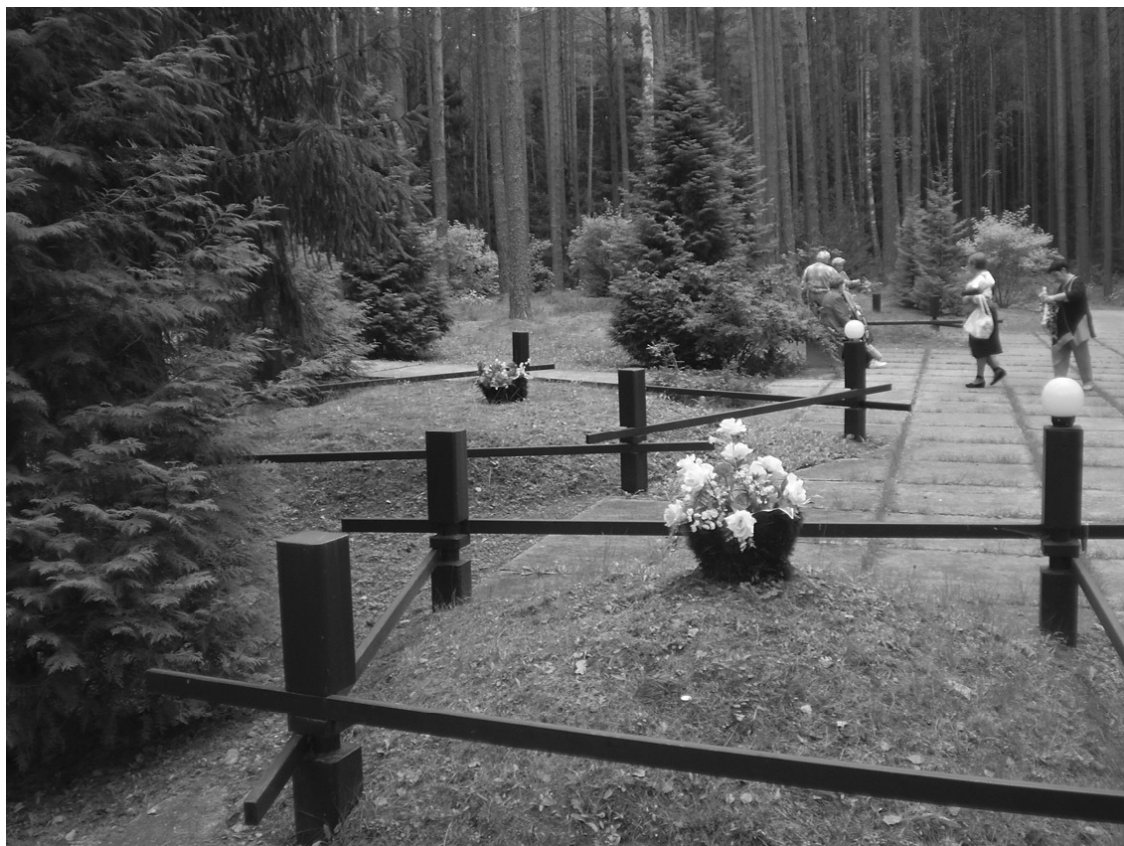
Скромный мемориал советским военнопленным, погибшим в Катыни от рук фашистов