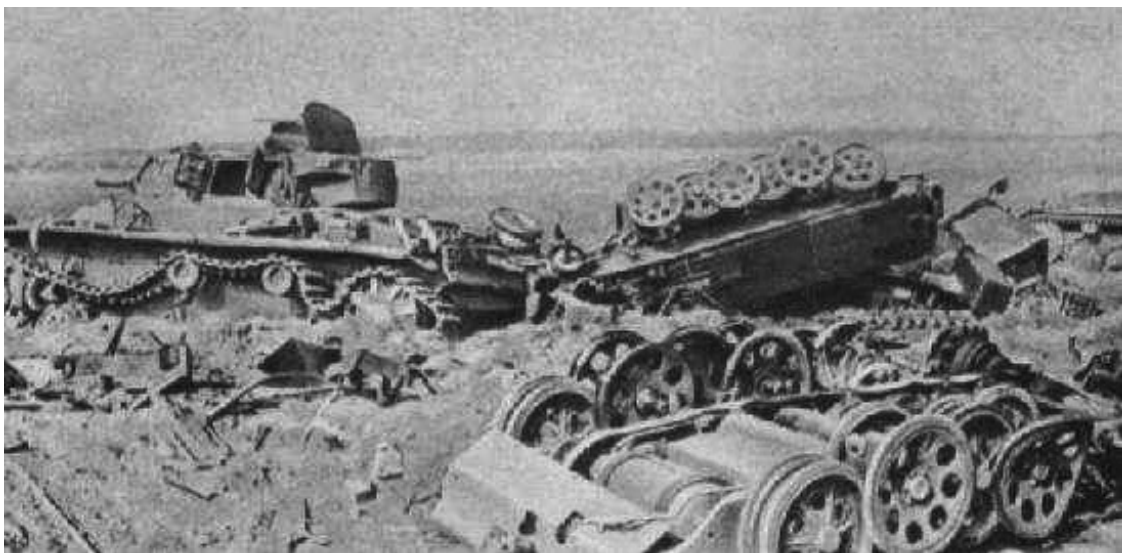
Бои за Смоленск. 1941 г.