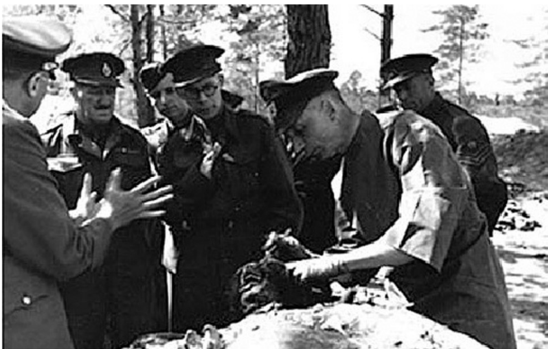
Немцы рассматривают трупы поляков в Катыни. 1943 г.