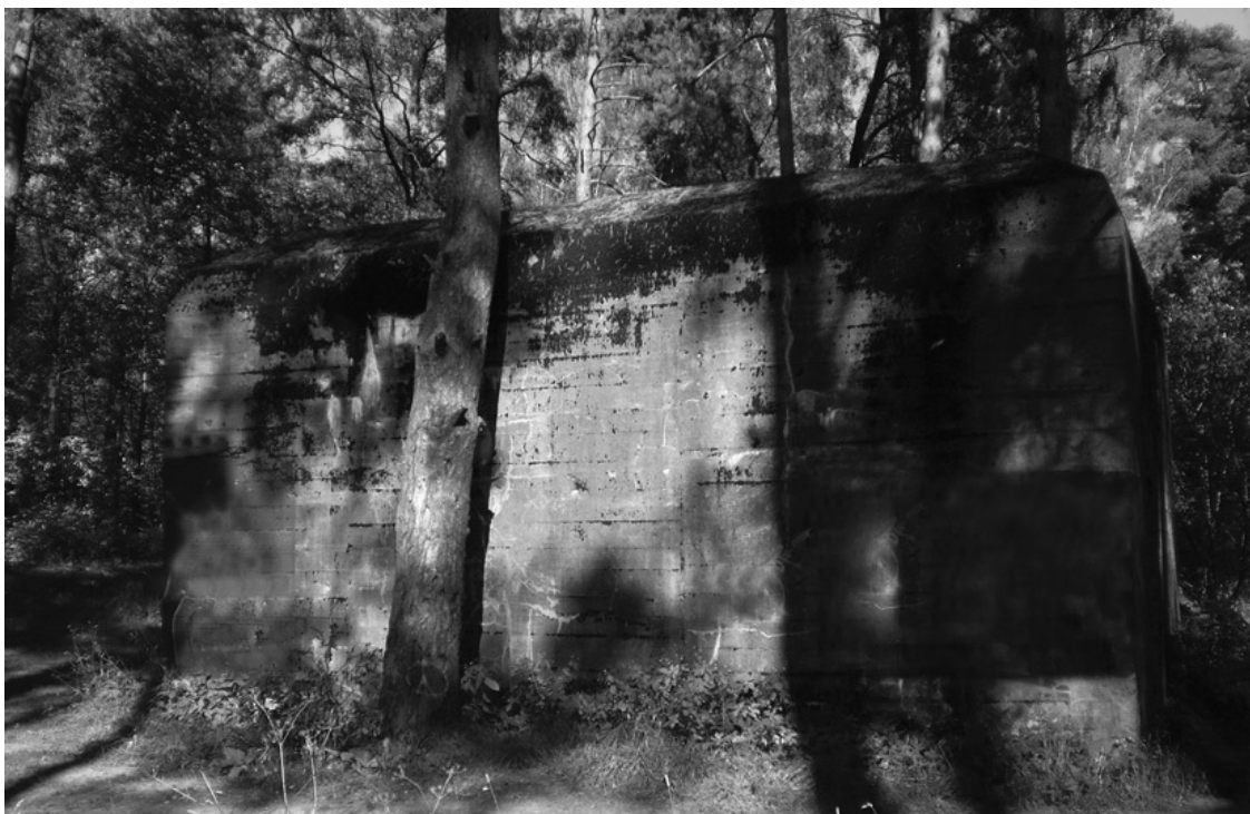
То, что осталось от бункера Гитлера под Смоленском. 2010 г.