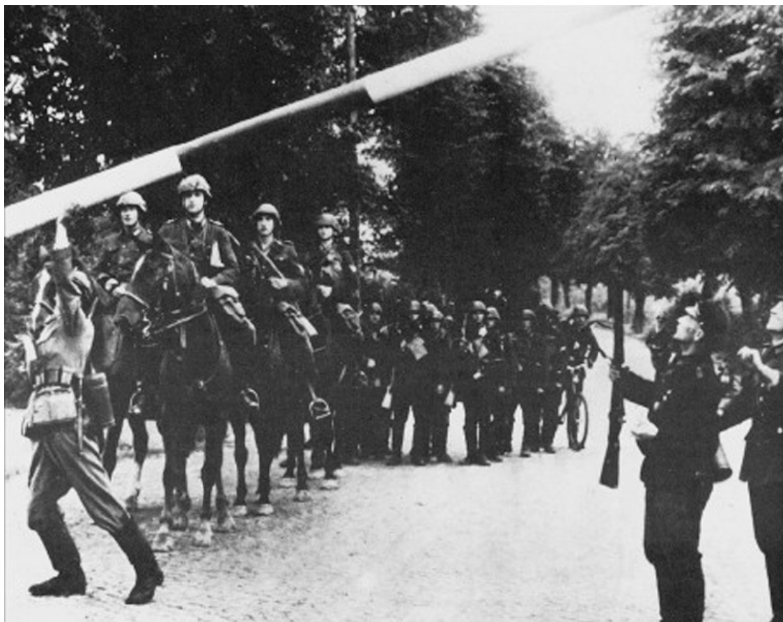
Переход польской границы немецкими солдатами 1.9.1939 г.