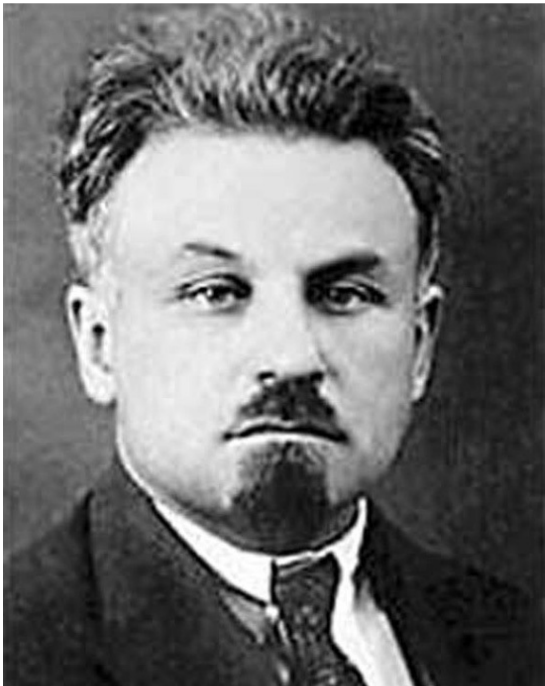
Гроза польских шпионов А.Х. Артузов