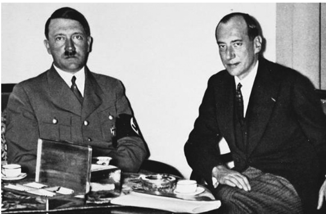
Гитлер и министр иностранных дел Польши Юзеф Бек