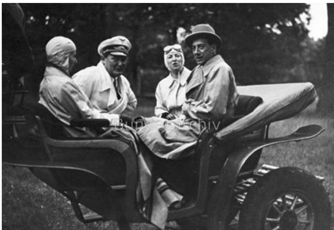
«Визит» Геринга в Польшу