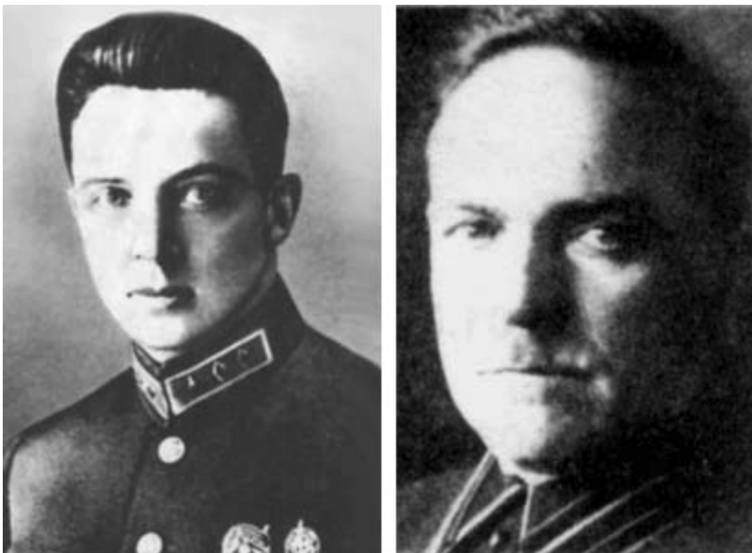
Бывший резидент польской разведки, ставший сотрудником ОГПУ Игнатий Сосновский