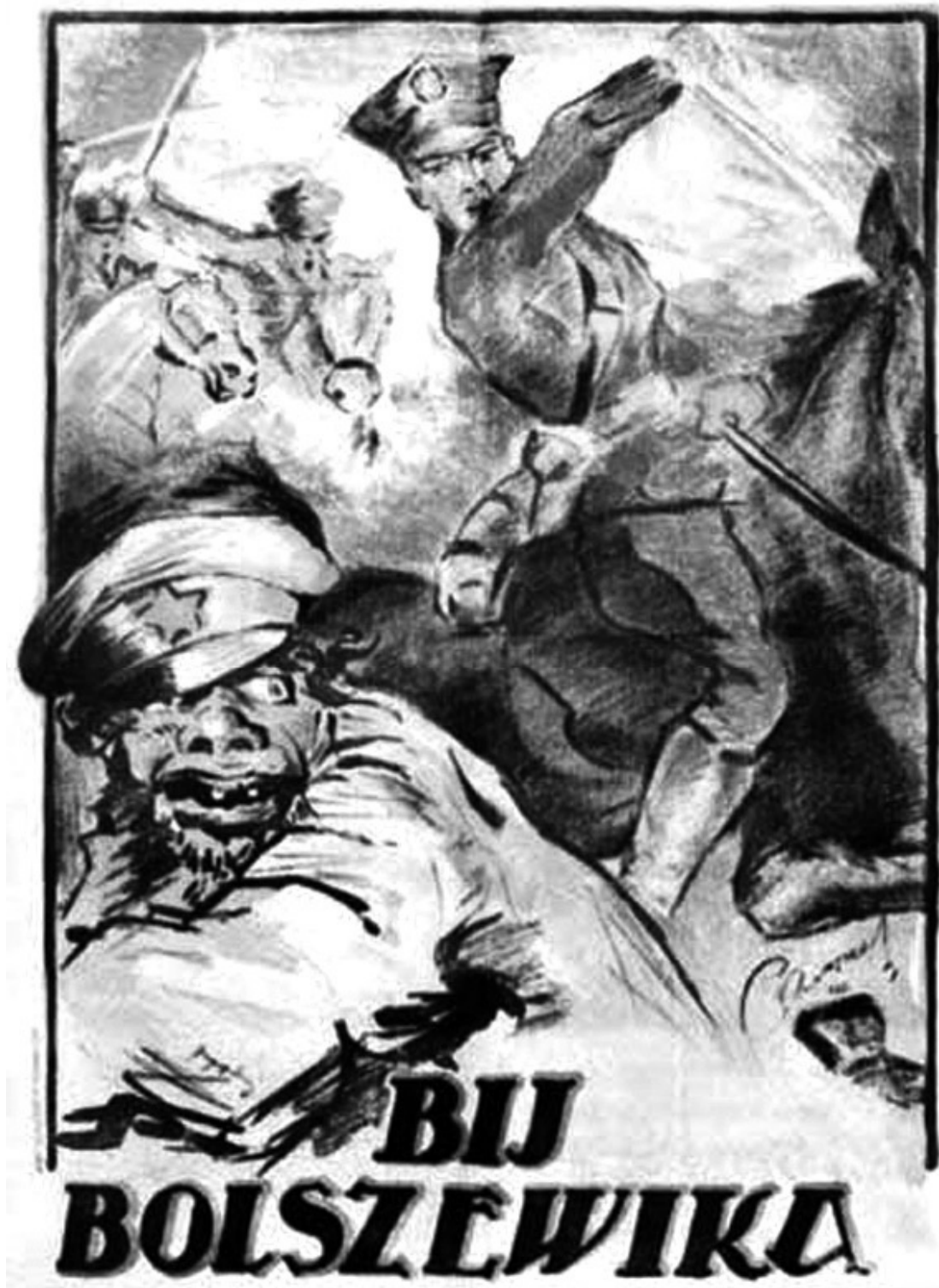
Польский плакат с изображением красноармейца. 1920 г.