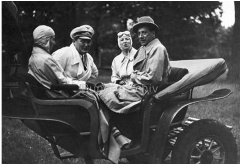
«Визит» Геринга в Польшу