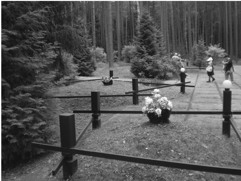
Скромный мемориал советским военнопленным, погибшим в Катыни от рук фашистов