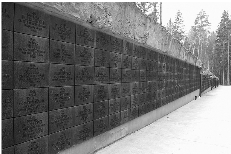
Помпезный мемориал погибшим польским офицерам