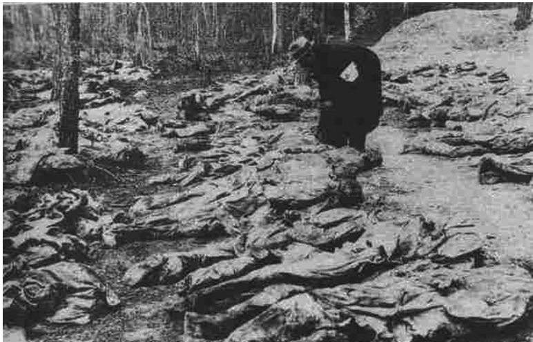
Свезённые трупы польских граждан и «найденные» немцами в Катыни