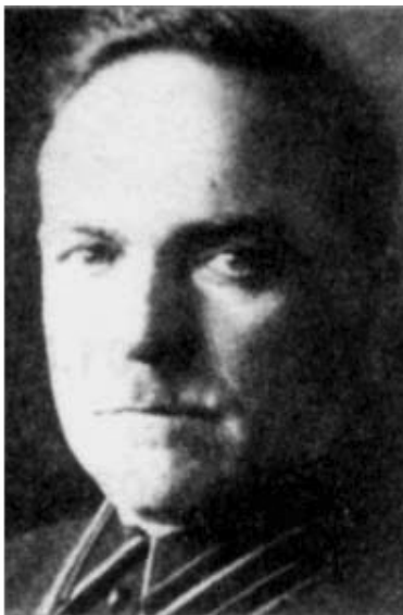
Бывший резидент польской разведки, ставший сотрудником ОГПУ Игнатий Сосновский