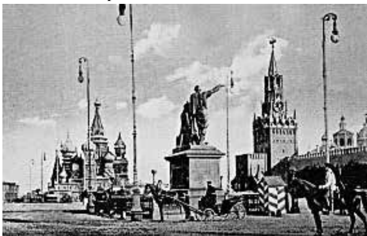
Красная площадь. Памятник Минину и Пожарскому. Конец XIX в.

Очень характерным для московского быта был и сам образ высокочтимого святого. Блажь, иначе – юродство, воспринималась в Древней Руси как вид подвижничества. Василий Блаженный обличал жестокость и бесчеловечность Ивана Грозного, и царь покорно выслушивал его обвинения. Был Василий коренным москвичом, родился в пригородном селе Елохове, где сегодня стоит московский кафедральный Елоховский собор, в крестьянской семье. Родители его отдали учиться сапожному мастерству, но однажды у совсем еще юного Василия обнаружился дар предвидения. О пришедшем заказать сапоги заказчике он сказал, что тот на следующий день умрет, что и произошло. И тогда 16-летний Василий оставил хозяина, родителей, принял на себя подвиг юродства, без крова и одежды, возложив на себя вериги. Василий Блаженный, между прочим, предсказал страшный московский пожар 1547 года, в котором погибла большая часть Москвы и много людей. Прямота и честность святого так ценилась москвичами, что и красивейший в столице собор они стали называть его именем.