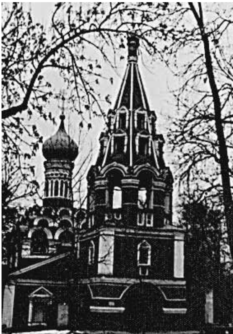
Москва. Донской монастырь. Старый собор

Это было военное чудо, спасшее Москву, точнее – все Московское государство. Бегство татар из-под столицы в июле 1591 года. И в память о чуде – решение царя Федора Иоанновича заложить Донской монастырь и строить его «не жалеючи сил». Впрочем, исходило такое решение, само собой разумеется, не от государя – от действительного правителя России, Бориса Годунова.