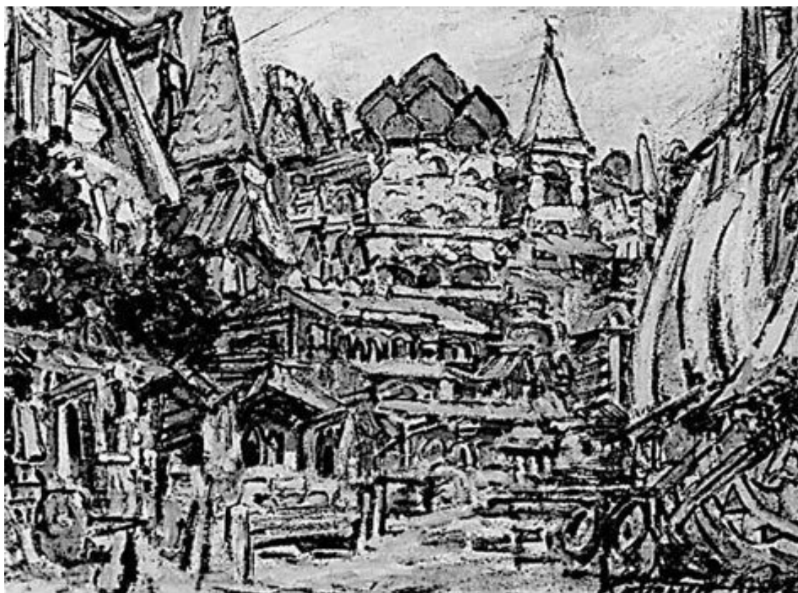
К. А. Коровин. Эскиз декорации к опере «Садко»

Незадолго до своей кончины в 1898 году художница Елена Поленова напишет: «Всегда с особым чувством проезжаю станцию с длинным названием Лосиноостровская. Как-то стало принятым спешить в Абрамцево, а вот если писать лес для сказок, пожалуй, стоило бы остановиться на Лосином. Есть в нем что-то таинственное, которое не разрушают даже первые строящиеся здесь дома. Плотники суетятся, подводы едут...»