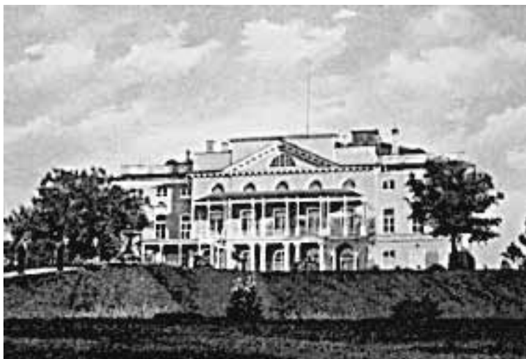
Нескучный сад. Дворец. Начало XX в.

Да, Москва и на самом деле тонула в ухабах. На 200 тысяч ее населения (всего в середине XVII столетия население государства составляло двенадцать с половиной миллионов человек) приходилось четыре с половиной километра бревенчатых и дощатых мостовых, иначе говоря, «мостов» через непролазную грязь. Да еще предполагалось проложить 155 сажен по Арбату.