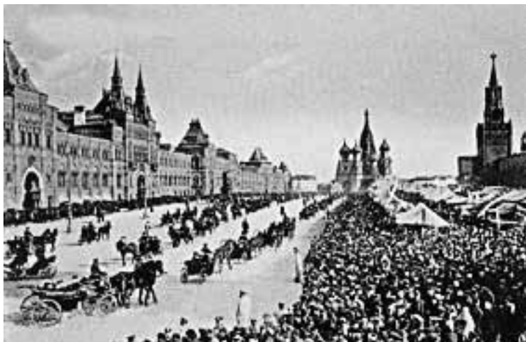
Красная площадь. Конец XIX в.

Красная площадь – красивейшая и самая почитаемая площадь России. Недаром сегодня она вошла в число историко-культурных памятников всемирного значения. Кремлевские стены со Спасскими и Никольскими воротами. Здание Исторического музея, о котором мы говорим отдельно. ГУМ. И, конечно же, Василий Блаженный, как мы его называем, а правильно – собор Покрова что на Рву. Но сначала обратимся к истории площади, неразрывно связанной с собором. Само по себе ее название Красная, иначе говоря, по-славянски, красивая, вошло в обиход лишь во второй половине XVII века. А появилась площадь в конце XV столетия, когда строивший кирпичный Кремль великий князь Иван III освободил здесь место для торговли. Отсюда и пошло первое название ее – Торг. Но в 1508–1516 годах вдоль кремлевских стен был прорыт для оборонных целей ров, через который к проездым кремлевским воротам перекинули мосты. Во всю длину рва встали каменные зубчатые стены. В XVI веке здесь стояла деревянная церковь Троицы, собственно и площадь стала именоваться Троицкой.