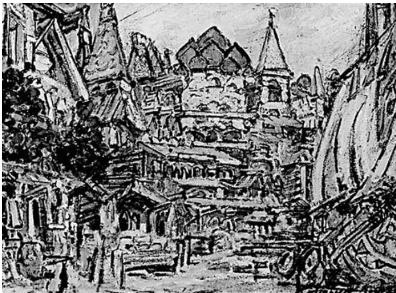
К. А. Коровин. Эскиз декорации к опере «Садко»

Лосиноостровская возникает как дачный подмосковный поселок. Само понятие Лосиного острова означало в обиходе старого русского языка бугор, сухое место среди топей. К острову в таком смысле относилась собственно правая (от Москвы и от железнодорожной линии) часть поселка, расположенная на песчаном грунте. Левая была более низкой, глинистой и сыроватой. Но именно с этой стороны селятся одни из первых застройщиков Лосиноостровской московские банкиры Джамагаровы.