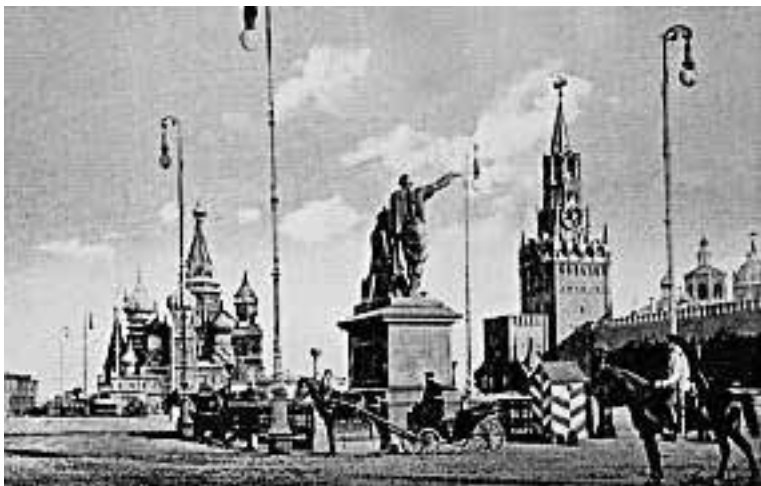
Красная площадь. Памятник Минину и Пожарскому. Конец XIX в.

юного Василия обнаружился дар предвидения. О пришедшем заказать сапоги заказчике он сказал, что тот на следующий день умрет, что и произошло. И тогда 16-летний Василий оставил хозяина, родителей, принял на себя подвиг юродства, без крова и одежды, возложив на себя вериги. Василий Блаженный, между прочим, предсказал страшный московский пожар 1547 года, в котором погибла большая часть Москвы и много людей. Прямота и честность святого так ценилась москвичами, что и красивейший в столице собор они стали называть его именем.