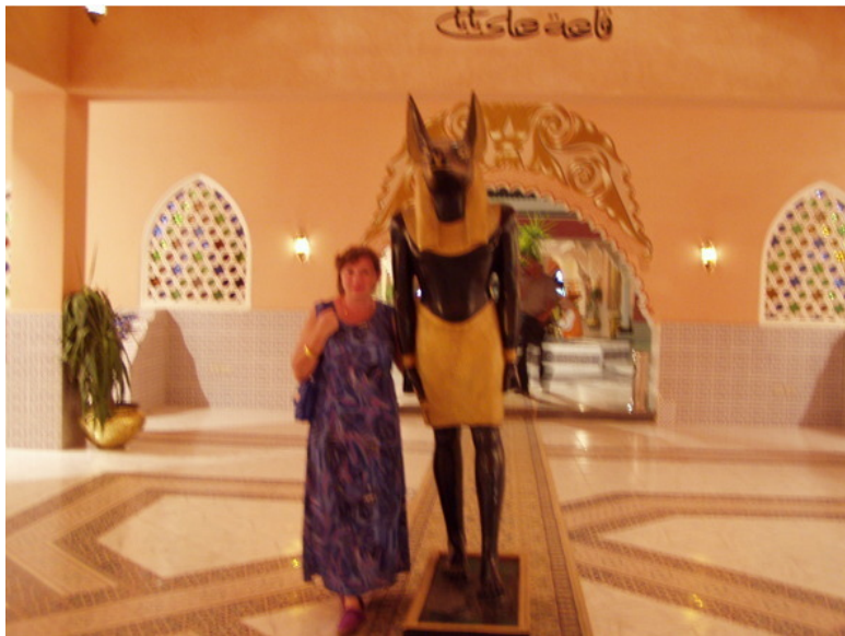
Внутри комплекса «1001 ночь»