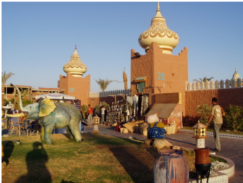
«1001 ночь» в Шарме

В самом Шарме не так много мест для посещения – Old Market, Наама Бей, «Тысяча и одна ночь», дельфинарий – вот, пожалуй, и все. В старом городе есть отличный рыбный ресторанчик, где кормят вкусно и недорого. Всем рекомендую его посетить. В Наама Бей есть смысл съездить за покупками и погулять по набережной. Туристы приезжают в Шарм за пляжным отдыхом, ну и за покупками. А все интересные места находятся за пределами города.