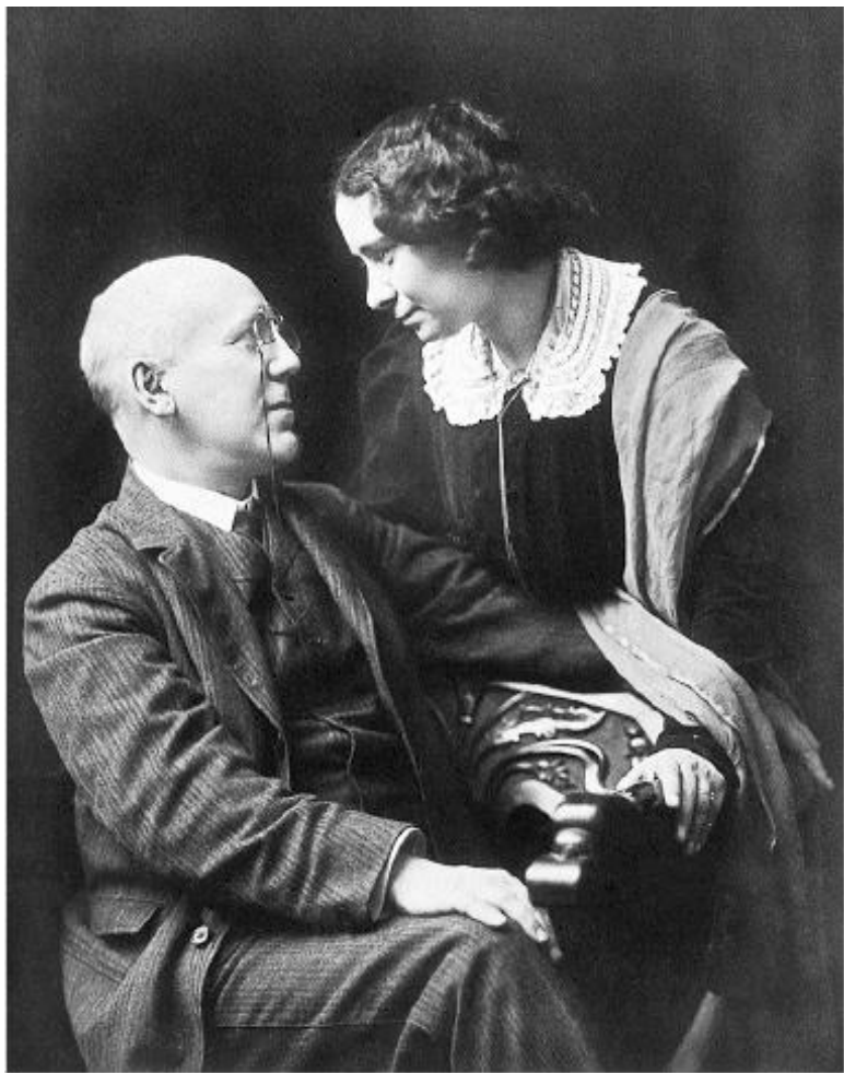
Федор Сологуб с женой Анастасией Чеботаревской. Нача-