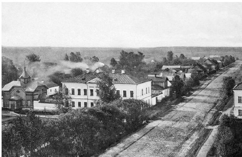
Город Крестцы. Начало XX века 6

машнего скота, принято было (в рамках освящения христианским смыслом языческой традиции) закалывать жертвенное животное – это прямо намекает на совершенное Передоновым убийство, жертвой которого пал его похожий на барашка друг. Что лишний раз подчеркивает распространенный тезис, что в великом произведении нет ничего случайного.