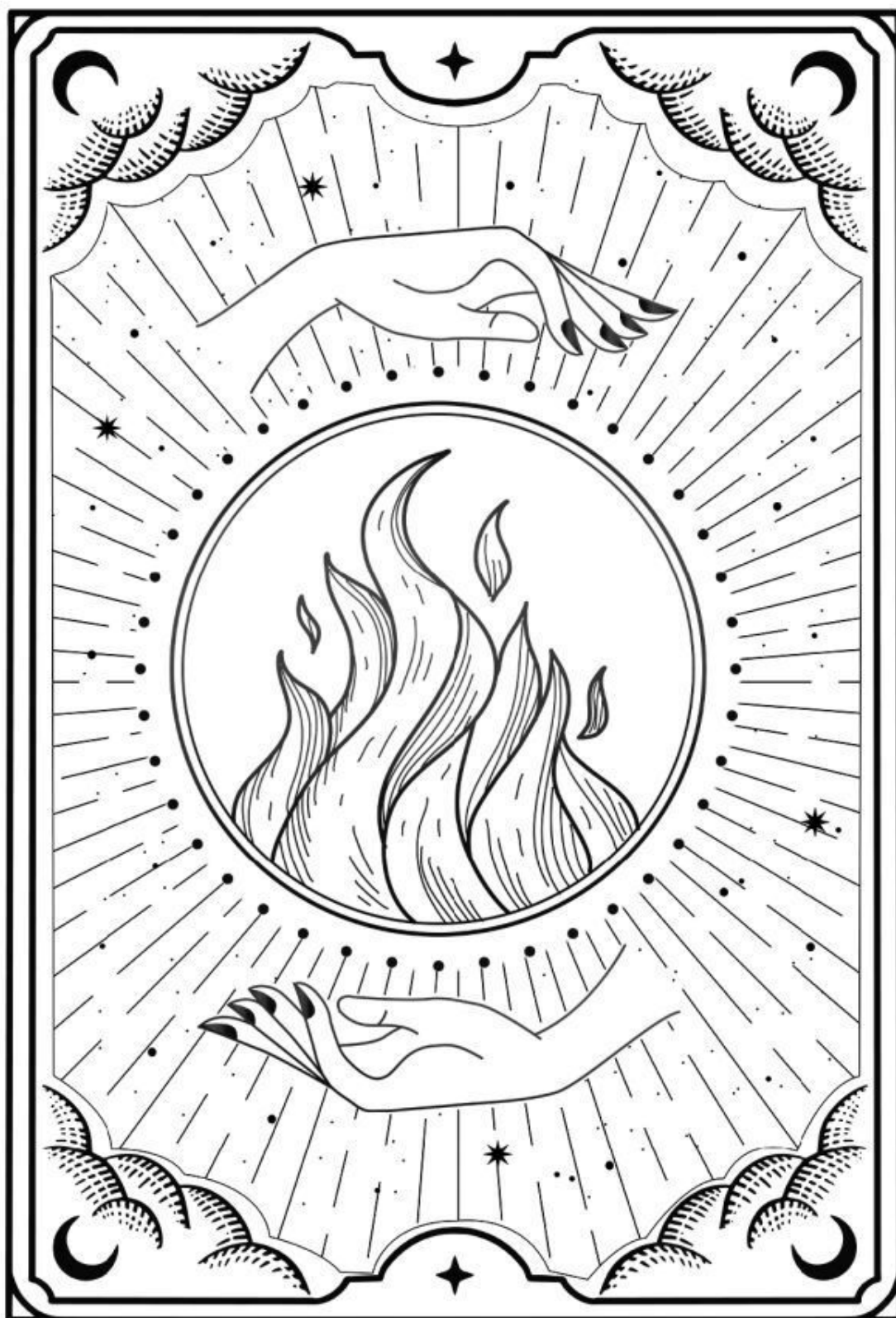
Повелительница стихии Огня Благословенная охотница