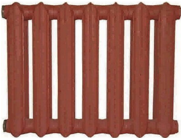
«Классика жанра»: модель MC-140-500

Между собой секции (или блоки) соединяются с помощью резьбовых nipples, которые, как и сами секции, имеют с одной стороны правую резьбу, с другой – левую.