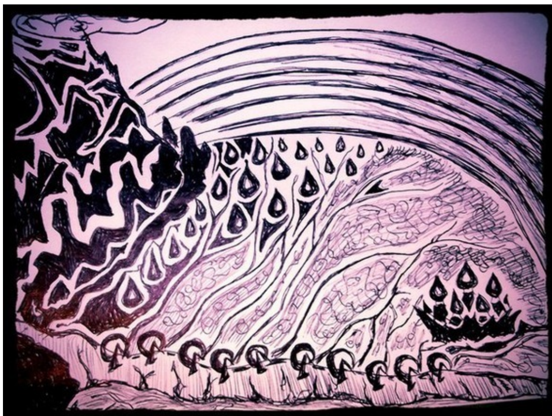
Долина Радужных Снов

Страна Стихолепия располагалась рядом с Долиной Радужных Снов таким образом, что если провести вокруг них контур, то получилось бы сердце, разделённое ровно посередине глубоким каналом, где когда-то протекала искристая река. Но много лет назад она внезапно исчезла, а вместе с ней Стихолепия лишилась волшебных облаков, которые наполнялись серебристыми парами реки, являясь источником света. Без них вся страна погрузилась во мрак.