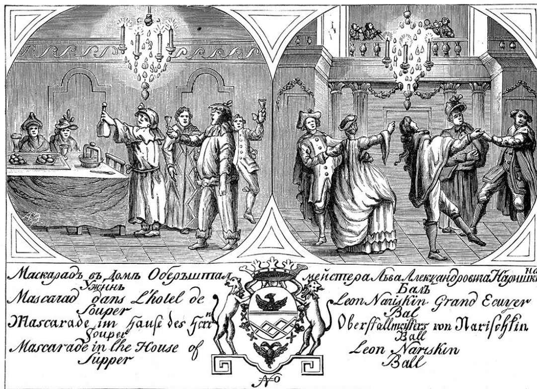
Пригласительный билет на маскарад к Льву Александровичу Нарышкину, 1760-е годы