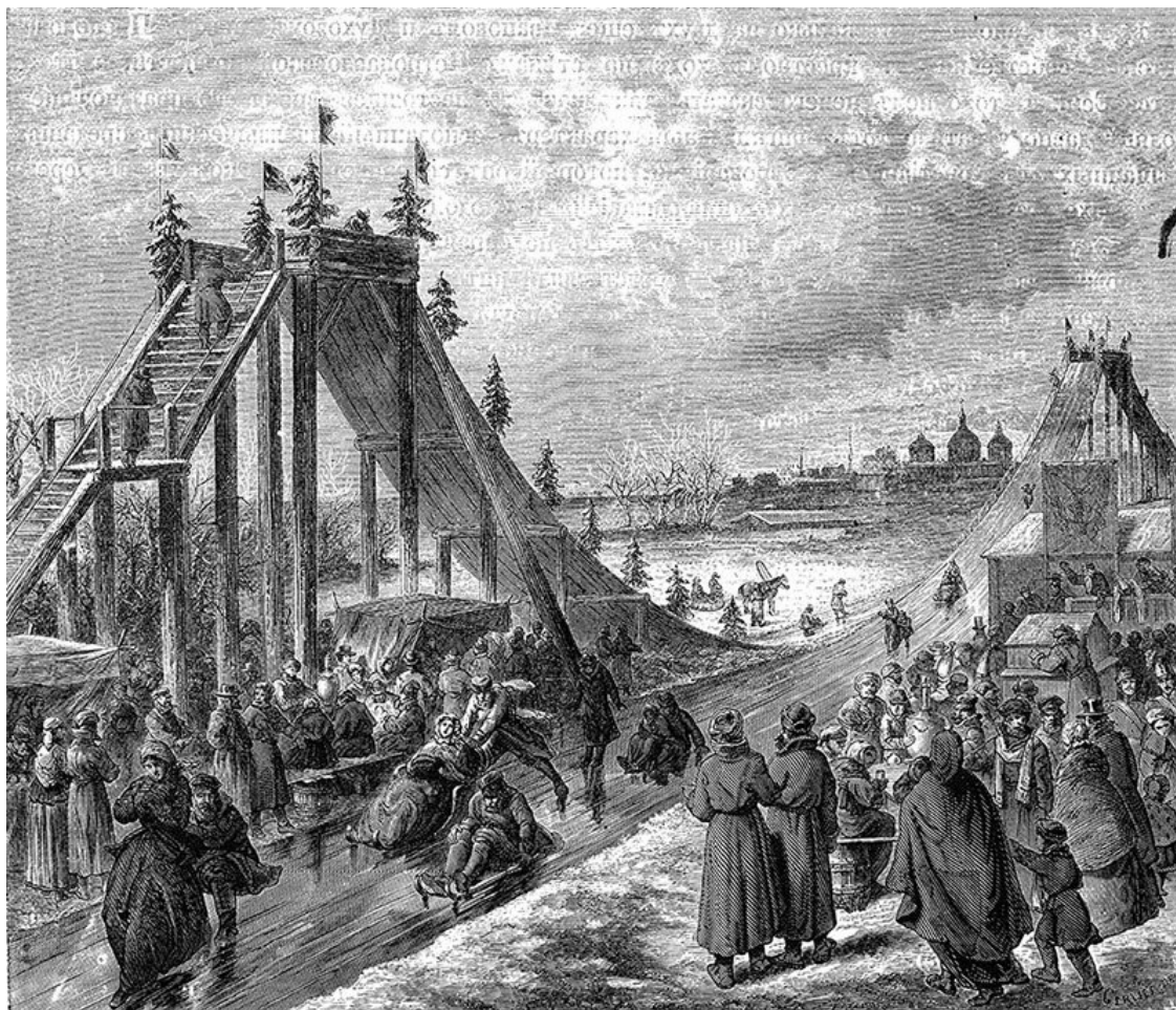
Праздничные катания, 1780-е годы

В памятниках древней литературы мы находим упоминания о такой двойной системе отсчета начала года. Близкие к языческим временам источники переломным часто назначают святочный период, и тот факт, что он совпадает с Рождеством, а все остальное летоисчисление благополучно ведется от сотворения мира, никого не смущал. Дело было совсем не в недавно укоренившемся христианском празднике, а в пережитках солнечного культа, который еще сохранял свою силу.