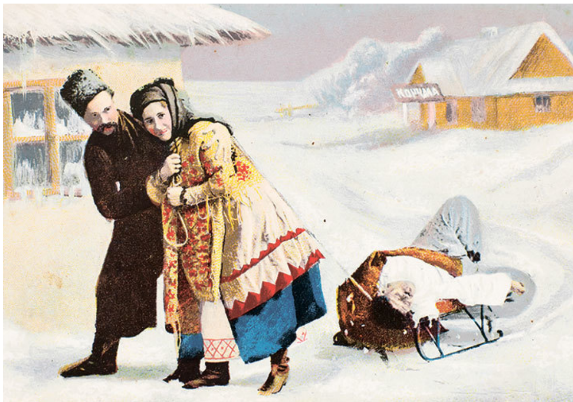
Дореволюционная открытка «Жена везет пьяного мужа с посиделок», 1850-е годы

На эти праздничные «беседы» собирались всей деревней, без различия пола и возраста. В назначенную для праздника избу приходили соседи, а также парни и девушки из деревень в округе – и 10, и 15 верст не считались за расстояние. Девушки чинно рассаживались на лавках от печки до лицевого угла и от него до красного окна... Молодицы, старухи и женатые мужики, не участвующие в забавах, занимали места на лавках у печи и в само действие не вмешивались, были просто заинтересованными зрителями. Это правило нарушалось только в том случае, если молодежь, развеселившись, забывала о безопасности – в этом случае кому-то из старших женщин позволялось покинуть свое место в сторонке и остудить горячие головы – надо было следить за тем, чтобы не случилось пожара. Для неженатых молодых тоже было определено свое место: они размещались от красного окна до угла, где висели образа, «почестного», и от него до заднего, «полоненого» угла, направо от входа. Хозяин стоял у стола и принимал от парней деньги – за право посещения сборных бесед надо заплатить, да это и понятно, ведь дом после таких сборищ (а чего только во время этих праздников не случалось!) необходимо было приводить в порядок.