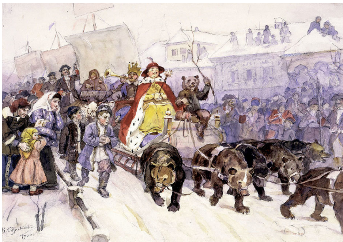
Василий Иванович Суриков «Большой маскарад в 1772 году на улицах Москвы», 1900 год

или тогда, когда празднуем пришествие в мире Сына Божия, Им же мы от долгов вечных и от уз нерешимых свободимся? От начала Христовой церкви ни пастыри, ни прочие христиане в посланиях и деяниях своих не писали числа лет ни от сотворения мира, ниже от Рождества Иисуса Христа, но именами настоящих (современных) римских консулов означали время. Только в шестом веке в римской церкви начали означать время от Рождества Христова, а в греческой за полторы тысячи лет не означивано и недавно означати стали, и то еще не повсеместным обычаем. Что же теперь скажете, слепые хронологи? Какая мечтаете лета Божии? И кто и где непреступно означати она узаконил? И кто и когда новолетие привязал к сентябрю? Привязано было, ведаем, но не крепким союзом. Силен же другой обычай, и разрешити союз тот, колыми же паче силен есть устав монарший».