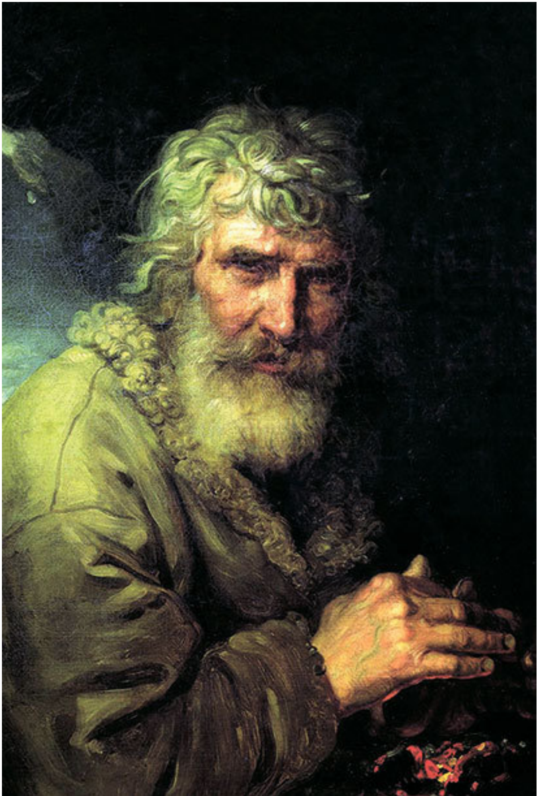
Владимир Лукич Боровиковский «Аллегория зимы», 1804 год

Игрище созывалось состоятельными крестьянами, имевшими в своей семье несколько девок. На игрище, как и на ссыпки, звали соседей, обращаясь с просьбой к хозяину дома, чтобы он пожаловал со всей семьей. Обычно следовал ответ – обещание прислать молодежь и полу-