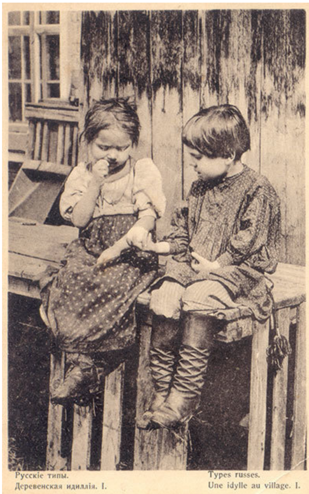
Дореволюционная открытка из серии «Русские типы»