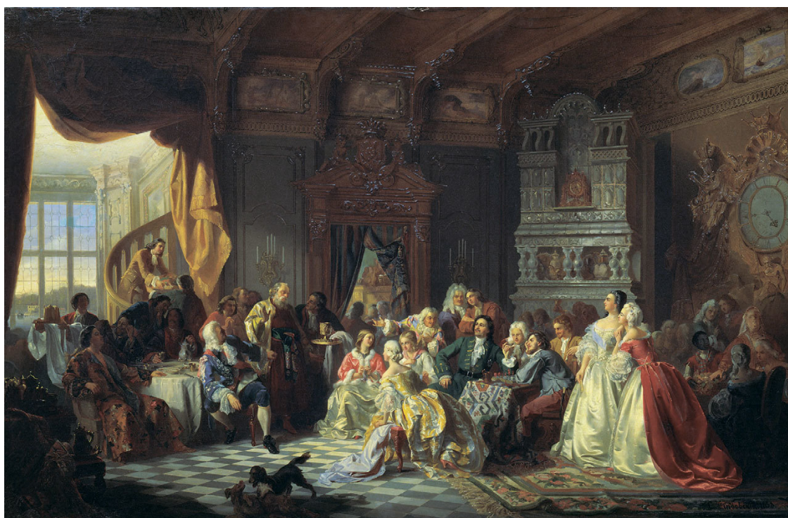
Станислав Хлебовский «Ассамблея при Петре I»

Адам Олеарий, немецкий путешественник, географ и ориенталист, автор «Описания путешествия Голштинского посольства в Московию и Персию» так живописует торжественное празднование 1 сентября в 1636 году: «На дворцовом дворе собралось более 20 тысяч чело-