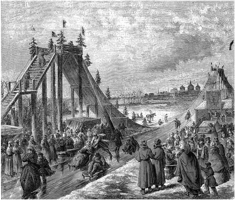
Праздничные катания, 1780-е годы

Но и остальные земли не отставали: зимнее солнцестояние было самым любимым временем в деревне – бытовые заботы отходили на второй план, и начинались праздники.