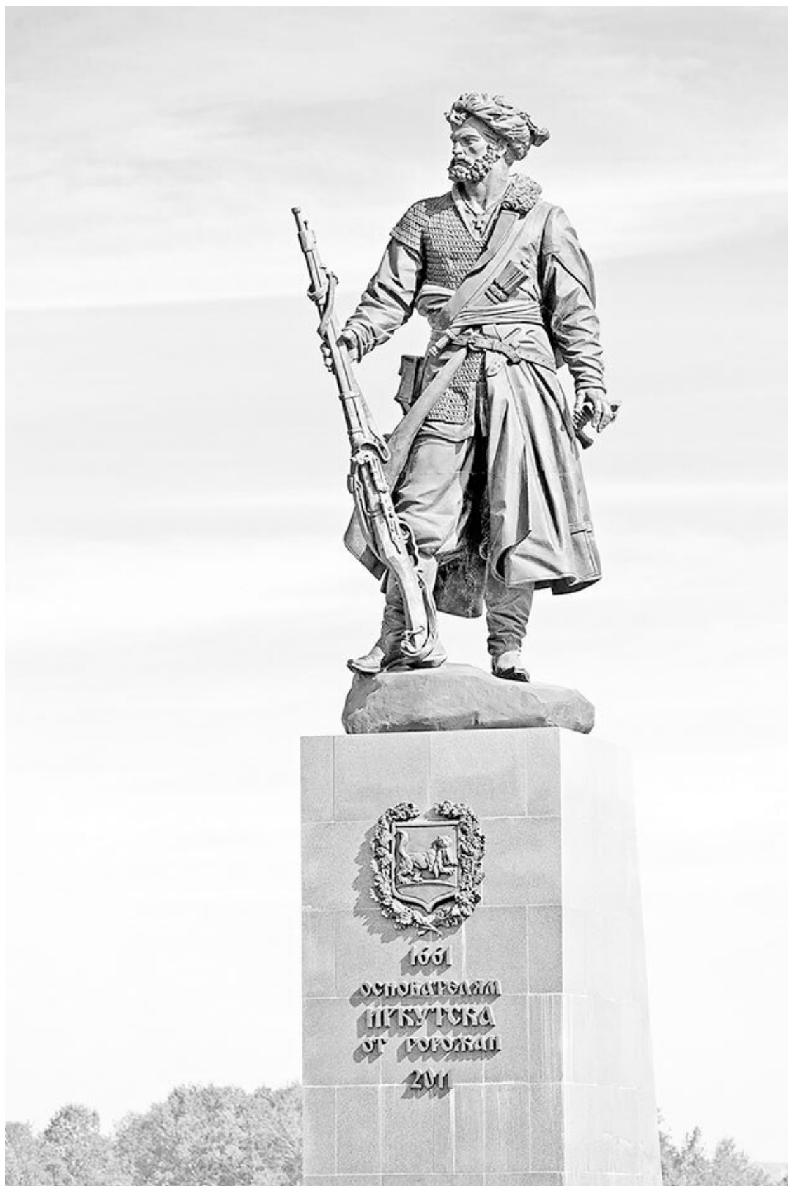
Памятник основателям Иркутска

Была у них и официальная цель: «провести новых землиц» и «привести их под государеву руку». Покорители Сибири не сомневались, что «добрым словом и пистолетом» они убе-