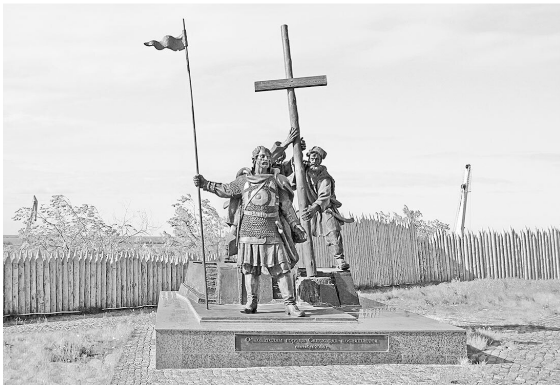
Памятник основателям в Салехарде

Служилые люди получали от казны жалование деньгами, хлебом, солью и овсом для лошадей. Впрочем, каждый четвёртый служилый предпочитал, чтобы вместо жалованья его наградили бы «землёй и травой». Пашня и покосы приносили гарантированный доход, а жалование могли задержать или недодать. Бывало, что в отдалённых острогах казаки сидели без платы по несколько лет. Служилые искали дополнительный заработок. В свободное время они возделывали поля, занимались промыслами, держали мельницы и кузницы, торговали. В середине XVII века в Тобольске служилые люди составляли половину от общего числа купцов, ремесленников и охотников.