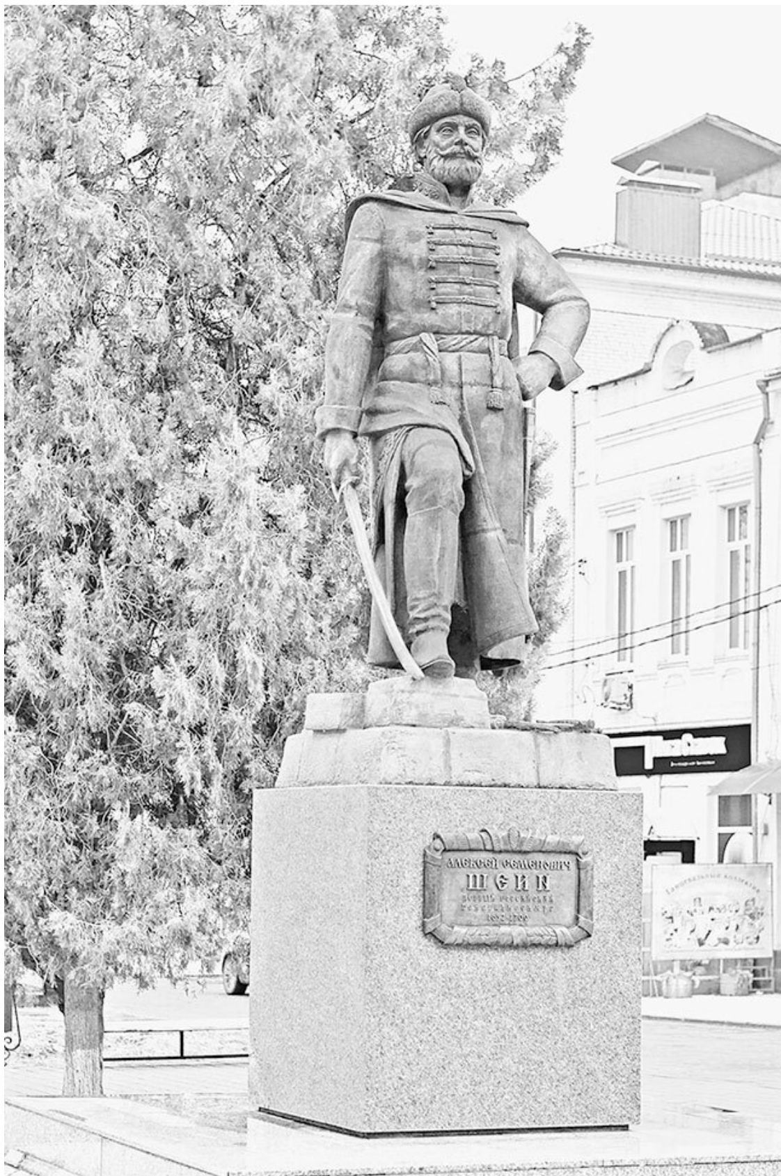
Памятник воеводе Алексею Шеину в Азове

Служить в Сибирь отправляли минимум на два года. При назначении воевода получал от царя пространный «наказ» – инструкцию. Явившись на место, воевода объявлял «государево