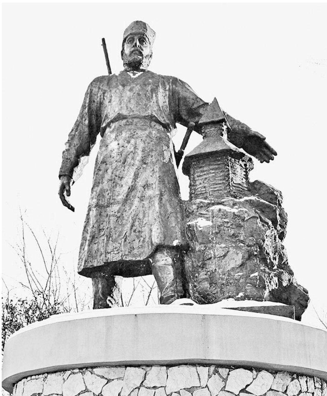
Памятник Петру Бекетову в Чите

«Для прииску и приводу новых земель» воеводы Якутска рассылали отряды во все стороны света. От бурят русские узнали, что на юге есть огромное, как море, озеро Байкал (Лама), «вода в нём стоячая и пресная, а рыба всякая и зверь морской», и богаты те места серебряными рудами. Семьдесят пять суровых казаков атамана Курбата Иванова в июле 1643 года выбрались на жёлто-сине-зелёный берег Байкала и сняли шапки. Густое горное небо, рассыпчатый песок. Корявые кедрачи похожи на камлающих шаманов – стоят на двухметровых ходулях корней, из-под которых за триста лет уже выдуло почву. Казаки прошли вдоль Байкала шестьсот километров. Курбат Иванов составил первый чертёж озера, но не сумел вернуться домой – на этой райской земле он погиб в сражении с бурятами.