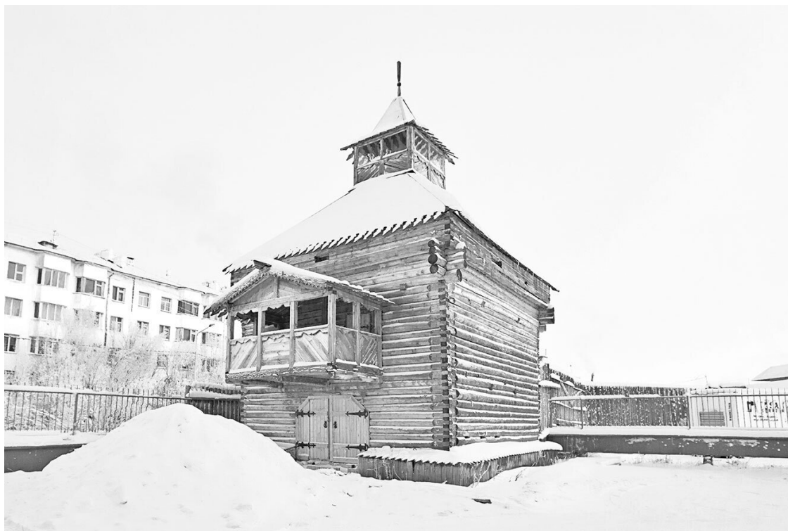
Башня Якутского острога

К началу XVII века русские уже освоили Обь и успели проведать пушного зверя в окрестностях города Мангазеи, тогда – главного опорного пункта Сибири. Охотников тянуло на восток к нетронутым местам и подальше от государевых сборщиков ясака. От обских хантов и селькупов русские узнали о реке Енисей (Ионесси). Поисковые экспедиции открыли четыре волока из бассейна Оби в бассейн Енисея, и за двадцать пять лет землепроходцы обследовали гигантскую реку со всеми притоками до её впадения в Ледовитый океан. В верховья шли на стругах и дощаниках, поднимаясь против течения на шестах или бечевой, к устью плыли на морских кочах под парусами. Рейды растягивались на годы. Победы над инородцами, богатый ясак и слухи о новых землях, полных сокровищ, давали силы преодолевать голод и холод, бороться с ледяными заторами, стремнинами и гнусом. Государственный контроль над территорией русские закрепляли строительством крепостей. Енисейский острог стал важным форпостом в Средней Сибири и базой для продвижения на Лену и на Байкал.