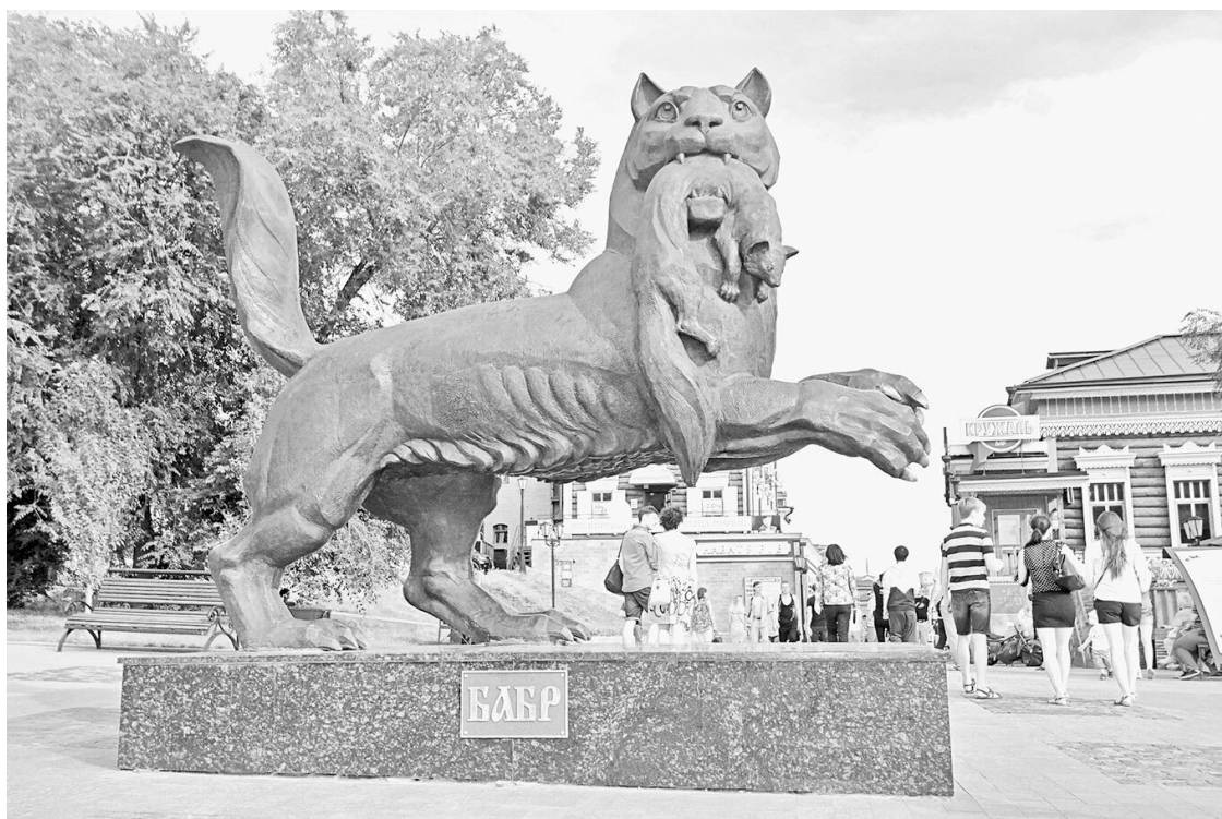
Бабр – символ Иркутска

У охотников сложилась особая суровая культура промысла, появились своя этика, свои приметы и поверья. Например, считалось, что бобры бывают двух видов: «бояре» и «холопы». На охоте брать надо только «бояр», потому что они толстые и с пышными шкурами, а «холопы» – тощие и потрёпанные. Была своя промысловая терминология, непонятная чужакам: какие-то «пупки», «подчеревеси», «гагче ярцы», «недокуни» и «недопёски». Волчий хвост назывался «полено», лисий – «труба», медвежий хвостик – «пых».