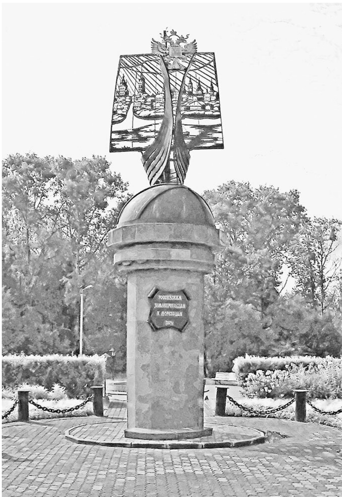
Памятник землепроходцам и мореходам в Тотме

Вскоре после экспедиции Москвитина по Амуру с боями прокатился отряд «письменного головы» Василия Пояркова, пришедший с Лены. Вслед за ним к амурским волнам явился стрелецкий отряд Петра Бекетова; Бекетов пришёл уже с Байкала, и его маршрут станет частью