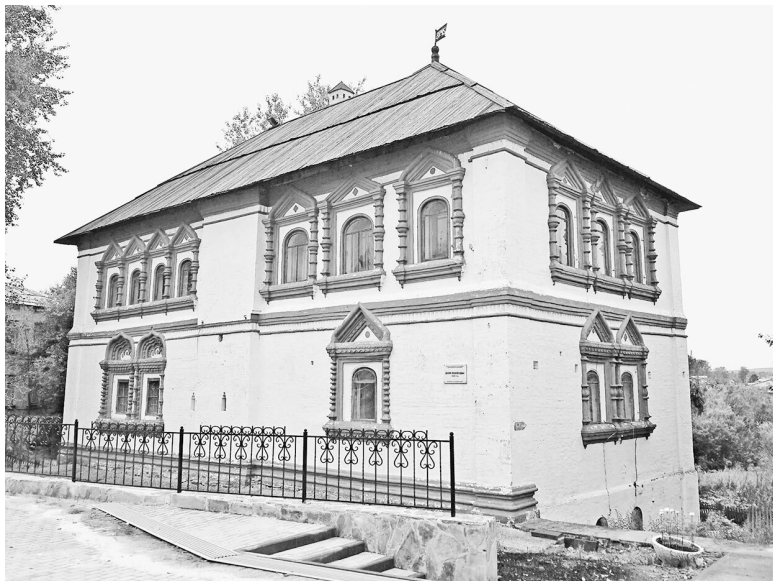
Дом воеводы в Соликамске

ственную внешнюю политику: самим принимать и отправлять послов в восточные державы.