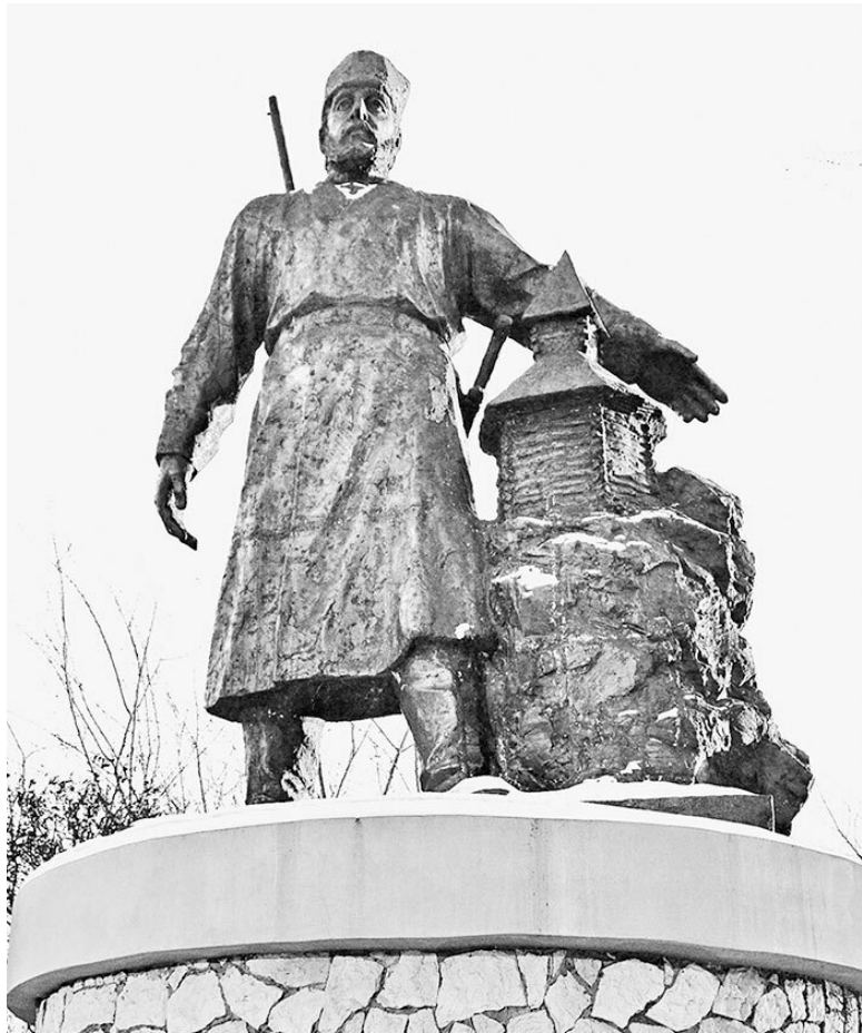
Памятник Петру Бекетову в Чите

«Для прииску и приводу новых землиц» воеводы Якутска