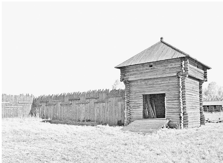
Юильский острог в музее Академгородка

дели без платы по несколько лет. Служилые искали дополнительный заработок. В свободное время они возделывали поля, занимались промыслами, держали мельницы и кузницы, торговали. В середине XVII века в Тобольске служилые люди составляли половину от общего числа купцов, ремесленников и охотников.