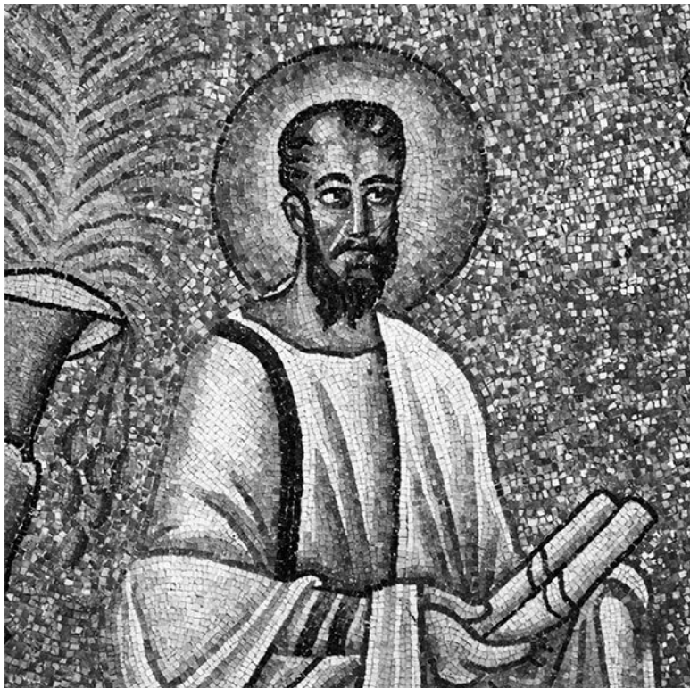
Апостол Павел. Фрагмент мозаики. Арианский баптистерий, Равенна, Италия. VI в.

...Ураган налетел внезапно – моряки называют этот разрушительный ветер эвраквилон. Он пригоняет с востока черные тучи, а потом одним ударом гасит свет, обрушивает сверху потоки воды, меняет местами небо и море и всем ко-