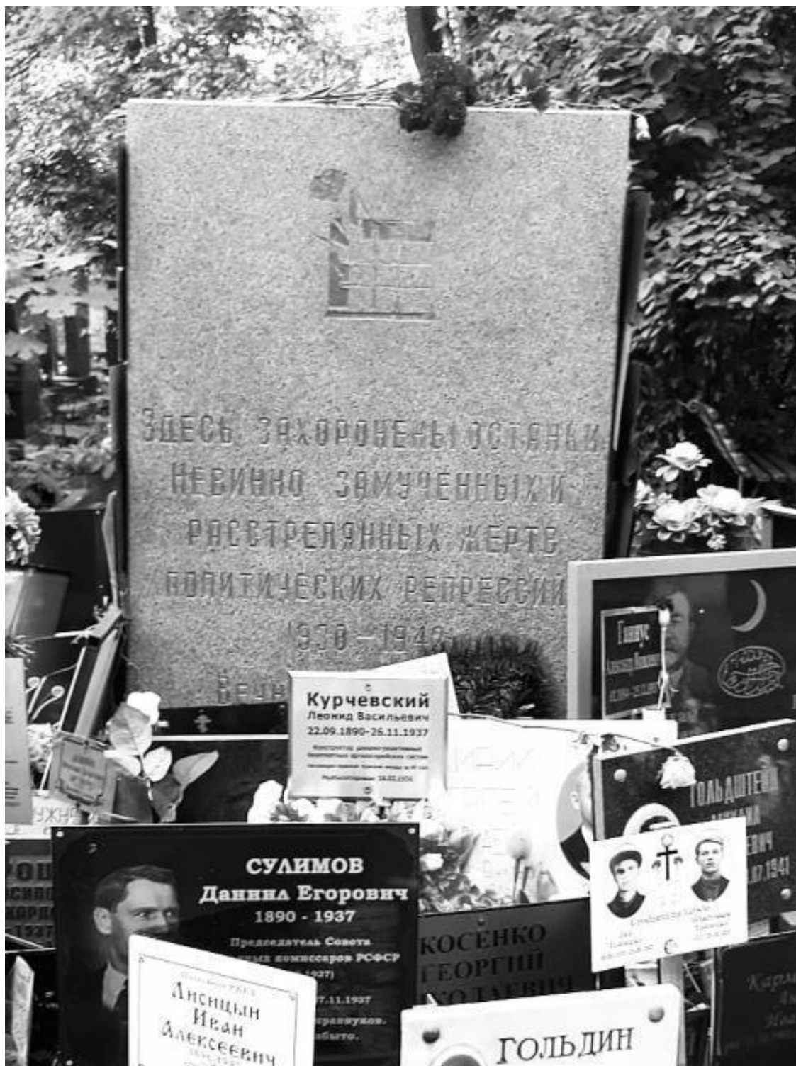
Могила невоинно погибших прахов № 1. Москва, Донское кладбище, 2022 г.