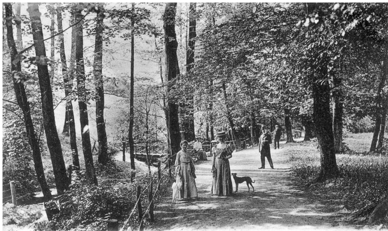
Königsberg i. Pr. Louisenwahlpartie