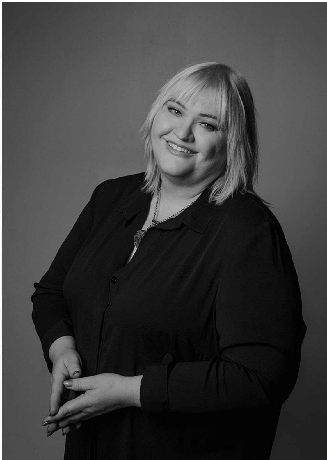
История восьмая «Ювелирная история» г. Париж, 2006