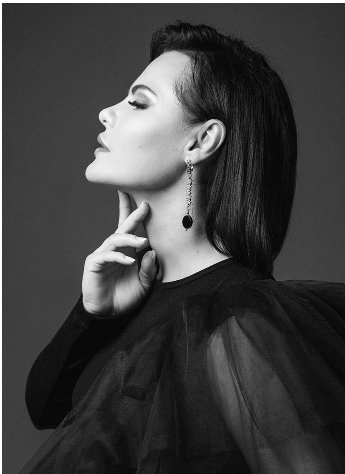
История пятая «Сильная женщина» г. Ярославль, 1995