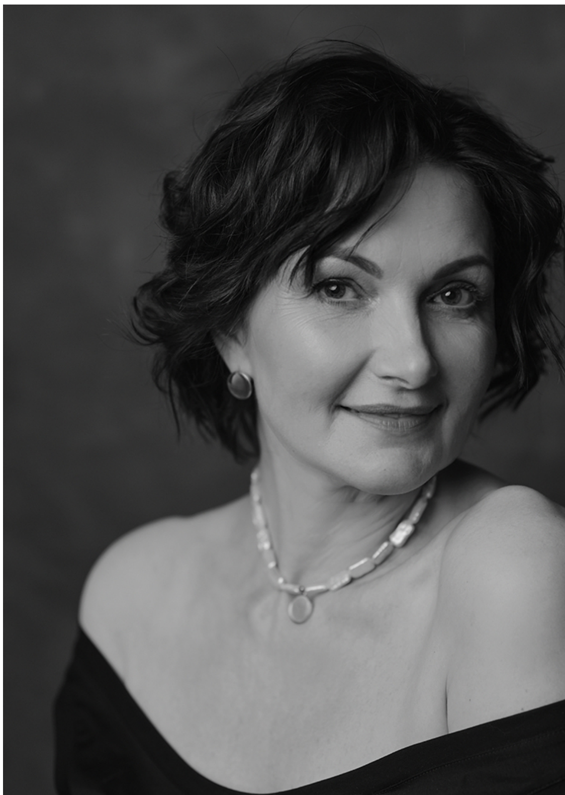
История девятая «Цветочная фея Мадейра»