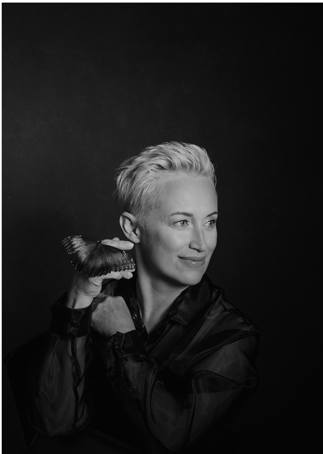
История десятая «Лёгкость бабочки»