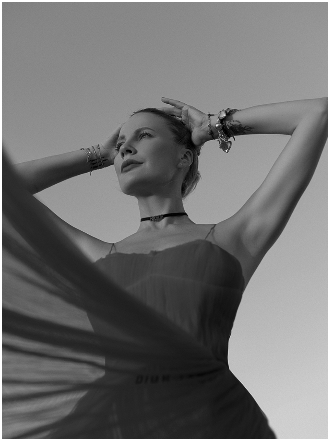
История вторая «Изменить всё, не изменяя себе» г. Москва, 2005