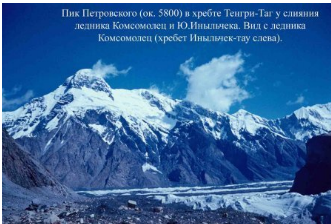
Пик Петровского (ок. 5800) в хребте Тенгри-Таг у слияния ледника Комсомолец и Ю.Иныльчека. Вид с ледника Комсомолец (хребет Иныльчек-тау слева).