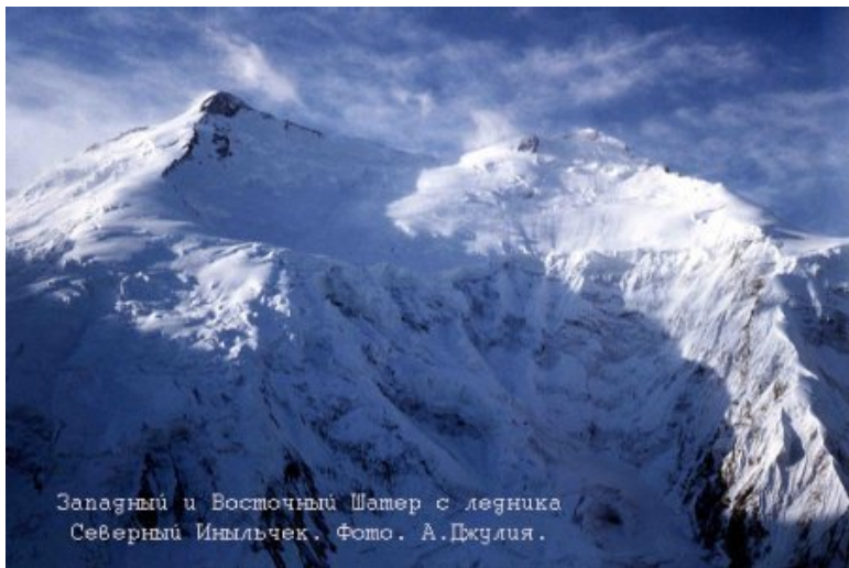
Западный и Восточный Шатер с ледника Северный Иньльчек.

Альплагерь «Каракол», Романцову, СРОЧНО! 07.08.91. 07.12