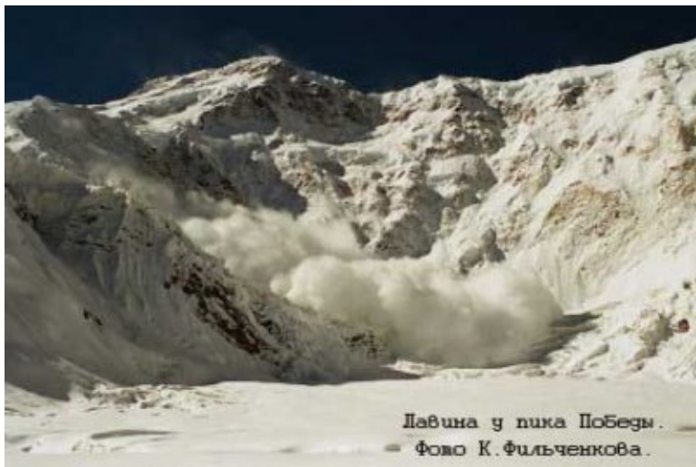
Лавина у пика Победы.

МАЛ СИ, Ишимову, СРОЧНО! 07.08.91, 07.00