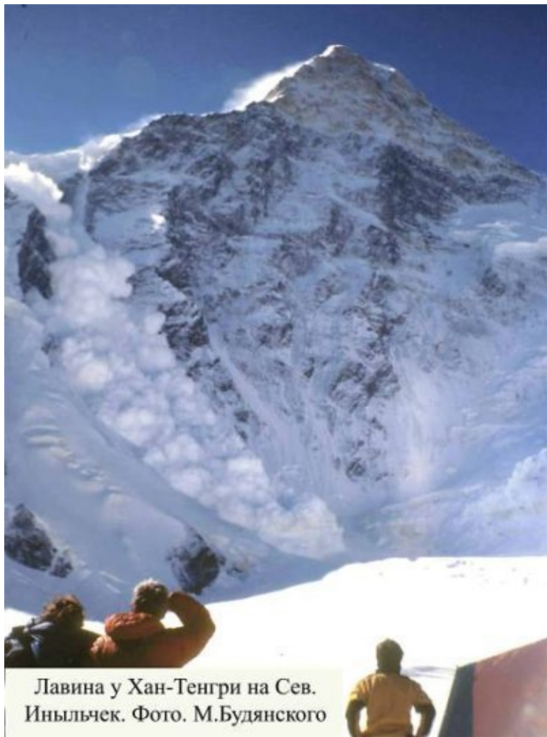
Лавина у Хан-Тенгри на Сев. Иныльчек.