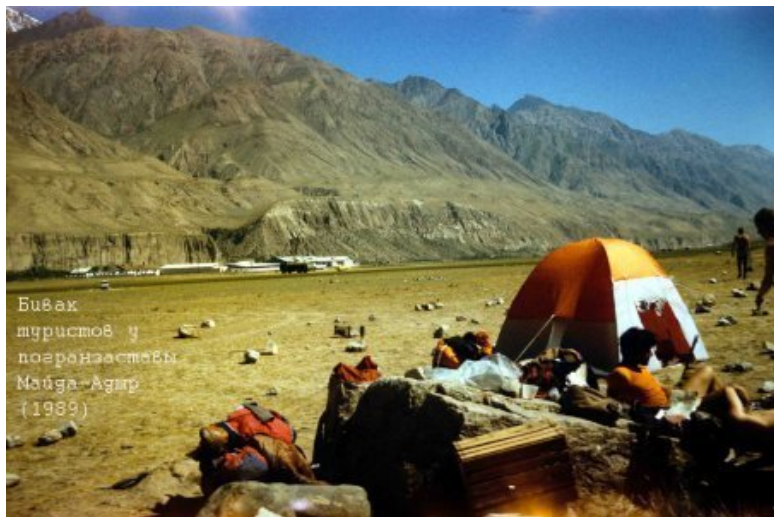
Бивак туристов у погранзаставы Майда-Агир (1989)