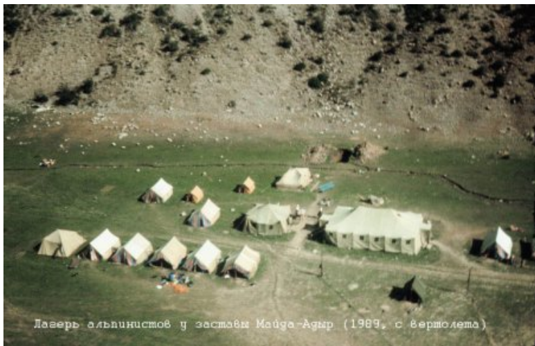
Лагерь альпинистов у заставы Майда-Адыр (1989, с вертолета)