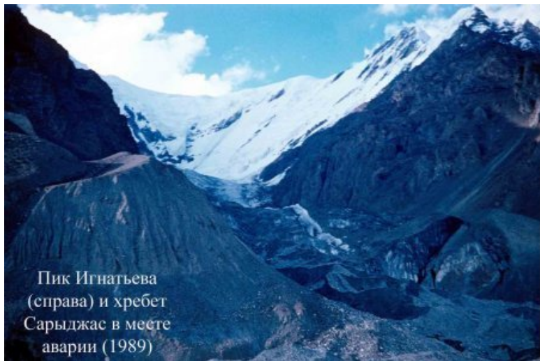
Пик Игнатьева (справа) и хребет Сарыджас в месте аварии (1989)