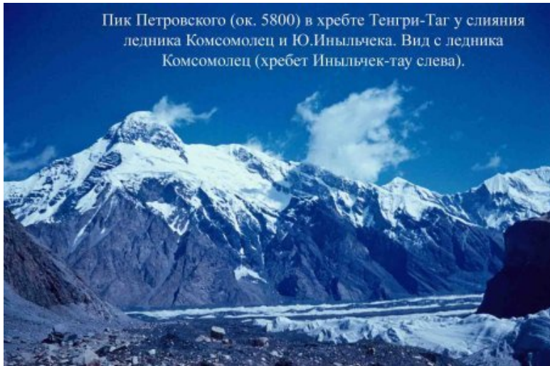
Пик Петровского (ок. 5800) в хребте Тенгри-Таг у слияния ледника Комсомолец и Ю.Иньльчека. Вид с ледника Комсомолец (хребет Иньльчек-тау слева).

Сборная группа тщательно подготовилась на совместных тренировках, заявила и защитила маршрут, прошла техническую проверку на скальном рельефе, получила «добро» МКК и КСС, получила подписи и печати в маршрутных документах, регистрационный номер и контрольные сроки... По прибытии в КСС сроки прохождения контрольных точек маршрута, – МАЛ ЮИ, МАЛ СИ и срок окончания похода попали под контроль КСС и в Ленинграде, и в местной об-