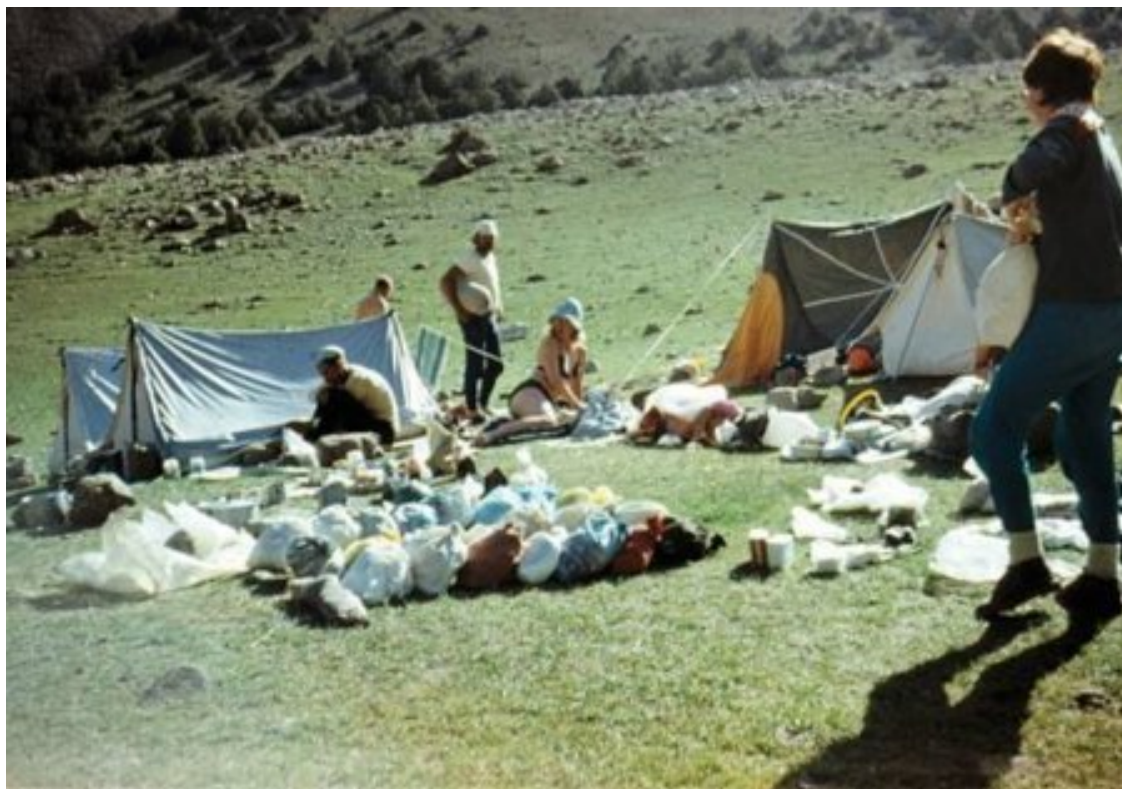
Распределение груза перед выходом в поход. Высокий Алай, 1983.