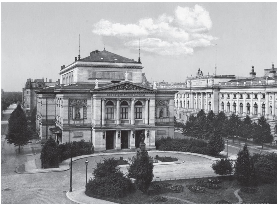
НОВЫЙ КОНЦЕРТНЫЙ ЗАЛ И БИБЛИОТЕКА В ЛЕЙПЦИГЕ. ФОТОГРАФИЯ СДЕЛАНА МЕЖДУ 1890–1900 ГГ.

обладает очень хорошим голосом. Что касается методов музыкального преподавания, то и в этом отношении сомнений быть не могло: консерватизм, самый строгий, был основной традицией всего поколения Бахов, и, следовательно, учить нужно было тому и так, чему и как учили в свое время самого учителя. В числе других, в то время общепринятых, музыкальных сочинений у Христофора Баха был и один более новый сборник произведений знаменитых тогдашних композиторов: Фроберга, Пахельбеля, Букстехуда и других. Этот сборник, по мнению молодого консерватора, ни в коем случае нельзя было и не следовало давать в руки неопытному ученику, ибо такая музыка была еще слишком нова для молодого человека и, пожалуй, могла подорвать в его глазах престиж старых музыкальных авторитетов. Учитель же должен был, напротив, всеми силами поддерживать эти авторитеты, и потому опасный сборник тщательно запирался в шкаф на ключ, а маленький Себастьян должен был изо дня в день твердить на клавесине произведения старых компонистов, как бы скучны и мертвы они ему ни казались. Эта система представлялась полезной вдвойне, ибо, во-первых, отучала от вредного легкомыслия, а во-вторых, развивала характер; Иоганну Христофору же было хорошо известно, что всякий дельный человек должен прежде всего обладать характером и что все Бахи обладали им в высокой степени.