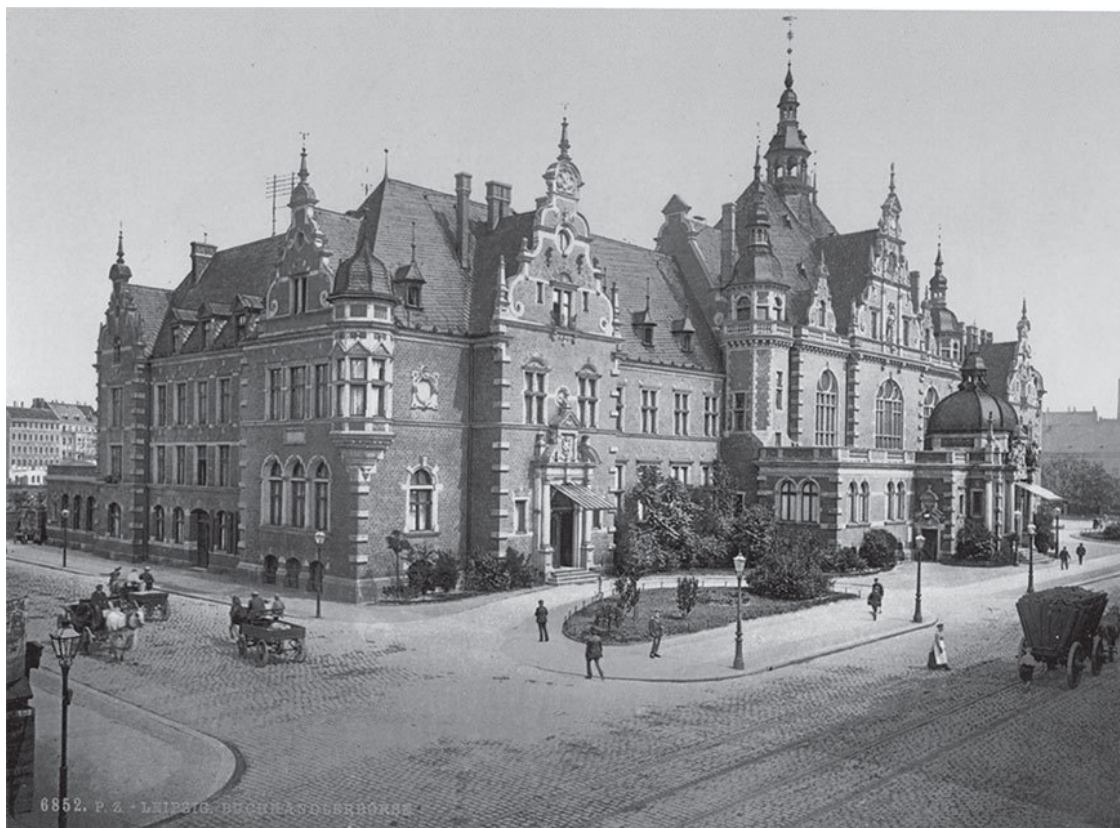
КНИГОТОРГОВЫЙ ДОМ В ЛЕЙПЦИГЕ – ГОРОДЕ, ГДЕ ЖИЛ И РАБОТАЛ БАХ. ФОТОГРАФИЯ СДЕЛАНА МЕЖДУ 1890–1900 ГГ.

Таковы были восходящие члены генеалогии Бахов и такова семья, воспитавшая в своих недрах будущего гениального музыканта. Но для более реального и, может быть, более близкого к истине представления о характере этой семьи мы сочли бы, пожалуй, небесполезным несколько смягчить тот отчасти строгий тон, каким говорили и каким обыкновенно принято говорить о предках Баха и их историческом прошлом. Мы, впрочем, уже упомянули о некоторой доле наивности, которая, несомненно, была присуща всей почтенной генерации, равно как и гению, ею порожденному. Наивность эта была, однако, самого добродушного и самого симпатичного свойства и, разумеется, вовсе не портила типа патриархального бюргера, каким был, например, отец композитора, почтенный органист Амвросий Бах, а в известной степени и гениальный сын его, как это мы увидим ниже, из данных биографии. Гений и трогательная детская наивность так легко уживаются вместе... Но, кроме этого замечания, для правильной характеристики знаменитой фамилии следует иметь в виду и то, что Эйзенах, где жила семья, так же как и Эрфурт, откуда она переселилась, были уголками такой глухой, захолустной провинции, которая неизбежно налагает на своих обитателей некоторый особый, трудно определимый, но всегда ощутимый отпечаток. Обстоятельство это также надобно оценивать и принимать как фон, на котором затем читатель может рисовать себе членов почтенной семьи со всеми их индивидуальными особенностями... Но возвратимся к нашему повествованию.