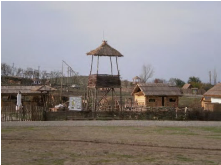
Атамань. Казачьи избы