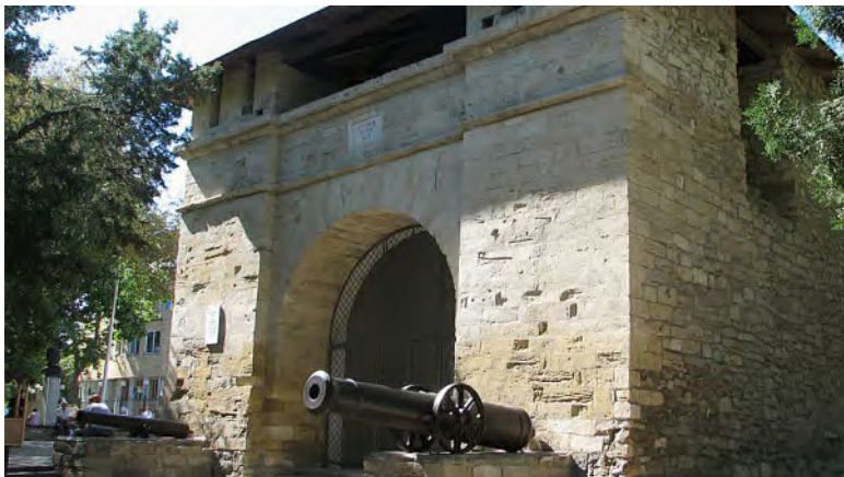
Русские ворота.