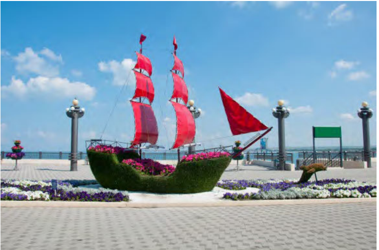
Анапская набережная. Алые паруса

Анапа – курортный город, расположенный на равнине. Здесь заканчиваются Кавказские горы, а вместе с ними галька сменяется песчаными пляжами. Добраться до Анапы можно поездом. Вокзал находится рядом с чертой города у пролетного шоссе (см. карту 2). Есть также аэропорт Витязево, связывающий Анапу с Москвой. Он находится в северном пригороде, недалеко от одноименного прибрежного поселка (см. карту 4).