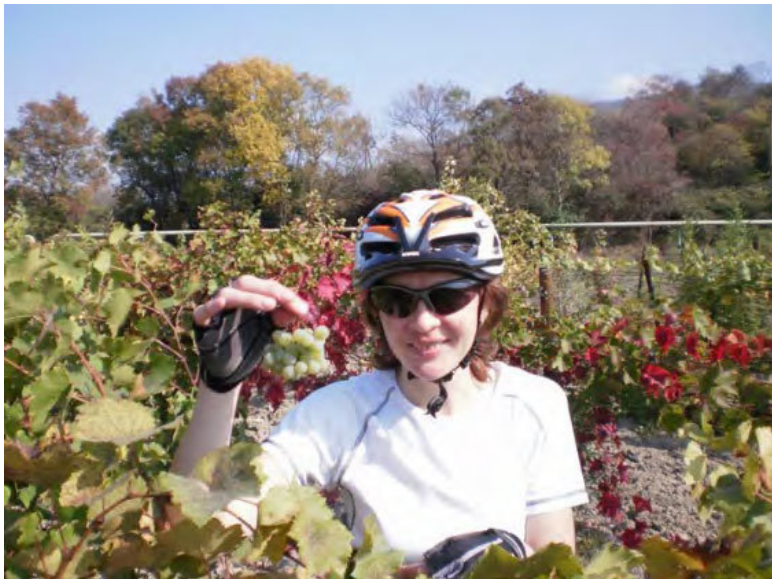
Виноградник под Камчаткой