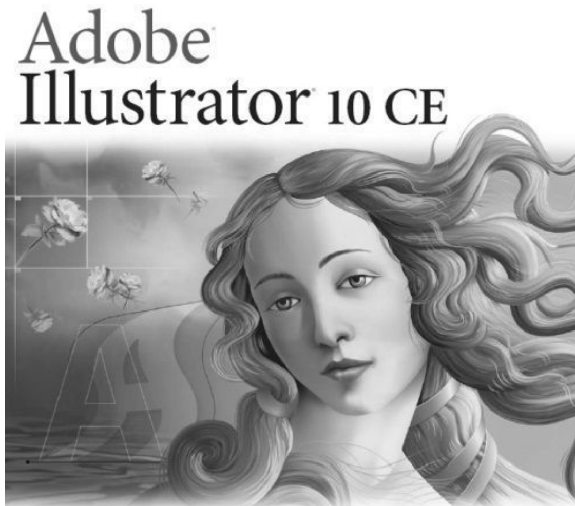
Рис. 1.5. Логотип программы Adobe Illustrator