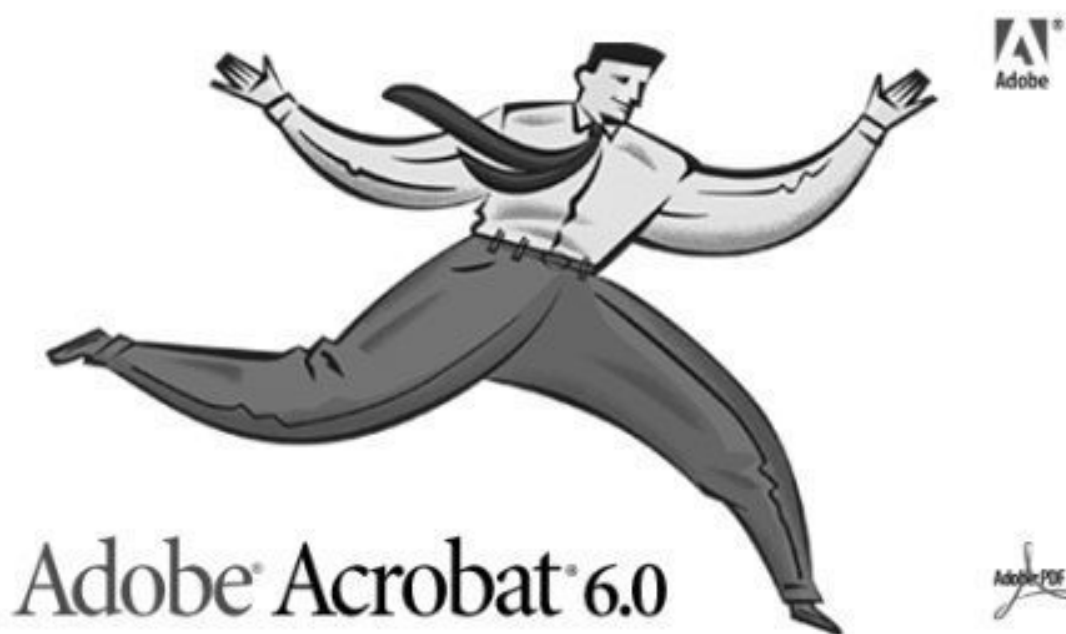
Рис. 1.11. Логотип программы Adobe Acrobat

□ Adobe Acrobat 6.0 Professional (это полновесный профессиональный вариант, включающий все возможности пакета – логотип программы приведен на рис. 1.11. Профессиональная редакция адресована всем, кто работает с графически сложными документами. Поддерживается возможность создания архивов и поиска по ним, имеются средства разметки и внесения комментариев, а также функции создания PDF-файлов из систем проектирования с сохранением слоев; поддерживаются большие форматы страниц. Acrobat 6.0 Professional призван помочь предприятиям, инженерам, творческим работникам и т. д., оптимизировать процесс работы со сложными, графически насыщенными документами, включая обмен ими, просмотр и архивирование. Стандартная и профессиональная редакции предлагаются в версиях для Windows и Macintosh).