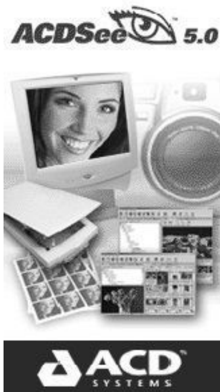
Рис. 1.10. Логотип программы ACDSee

ОЗУ и 40 Мб свободного места на диске. Программе необходимо окружение в виде Internet Explorer с версией не ниже 4.0.2, DirectX не ниже 8.0. Размер программы 13 Мб, цена программы $50.