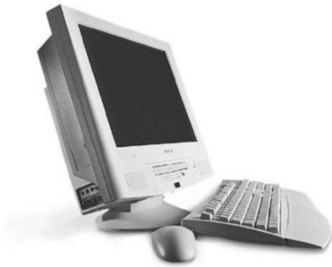
Рис. 2.1. Персональный компьютер

Кроме того, к компьютеру могут подключаться дополнительные (периферийные) устройства, к которым относятся, например: принтер, джойстик, сканер, музыкальная приставка, модем, плоттер, дигитайзер, цифровая фотокамера, световое перо (графический планшет) и др. Периферийные устройства в базовом варианте ПК могут отсутствовать, т. к. их наличие не является обязательным.