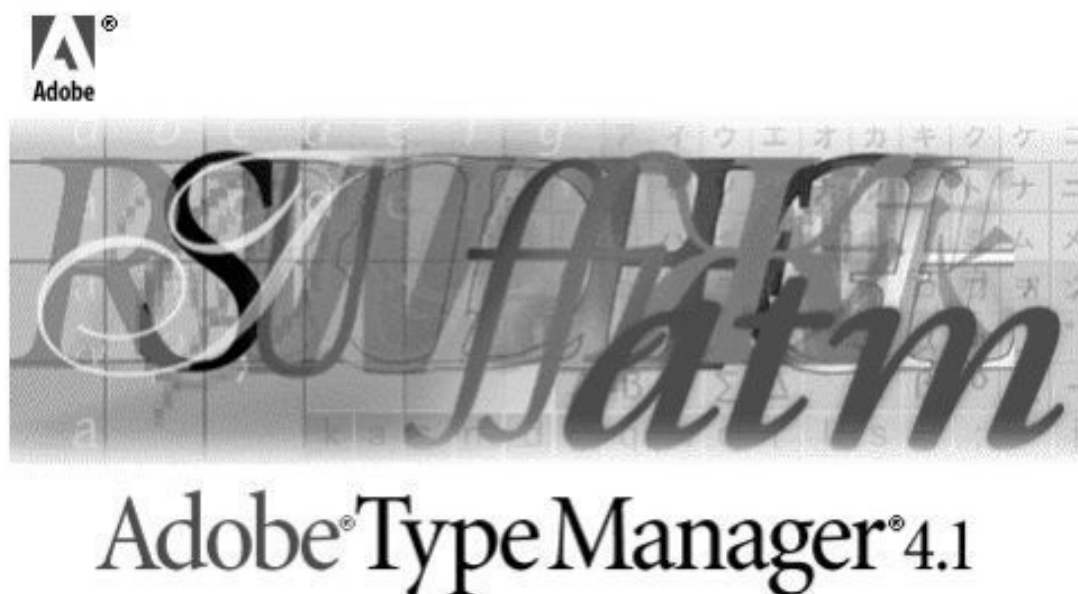
Рис. 1.8. Логотип программы Adobe Type Manager

При совместной установке MS TrueType и Adobe Type 1 полезно использовать утилиту Adobe Type Manager, логотип которой приведен на рис. 1.8. Эта программа включает в себя принтерные шрифты Adobe PostScript и утилиту-растеризатор. Данный и другие подобные пакеты (например, Corel Bitstream Font Navigator) имеют свои панели управления для установки и настройки шрифтов. В отличие от встроенных принтерных шрифтов, шрифты Adobe Type Manager могут быть в точности воспроизведены на экране. Например, для выбранного вами любого шрифта любого размера Adobe Type Manager сгенерирует и выведет на экран его растровую версию.