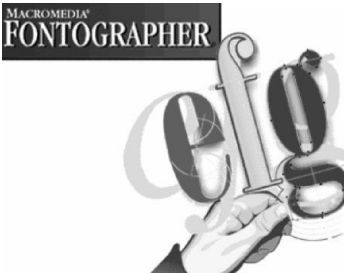
Рис. 1.9. Логотип программы Macromedia Fontographer

При создании нового или открытии уже существующего шрифта программа отобразит список символов, содержащихся в данном шрифте. Для каждого из них будет дана вся необходимая информация – литера, соответствующая данному символу, ее имя, различные кодировки.