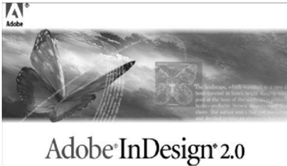
Рис. 1.2. Логотип программы Adobe InDesign

импортируемые данные из самых разнообразных структурированных источников вплоть до баз данных.