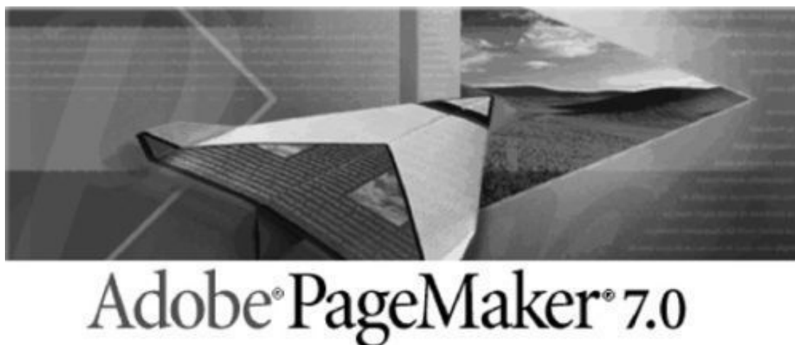
Рис. 1.3. Логотип программы Adobe PageMaker

Adobe PageMaker оперирует классическими инструментами компьютерной верстки – кадрами, слоями, на которых дизайнер размещает фреймы, и т. п. Самая ценная особенность Adobe PageMaker при подготовке бумажных публикаций – это мощнейший механизм работы с цветом. Пакет гарантирует точную цветопередачу на всех этапах создания документа без каких-либо потерь или искажений. В том случае, когда к публикации готовится сложное полноцветное издание, без этого не обойтись и зачастую именно этот фактор перевешивает все неудобства, связанные с чересчур усложненной моделью управления программой.