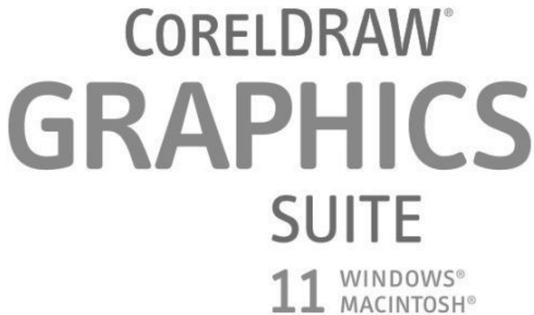
Рис. 1.6. Логотип программы CorelDRAW

Содержимое полного комплекта поставки (включая дополнительные приложения и утилиты):