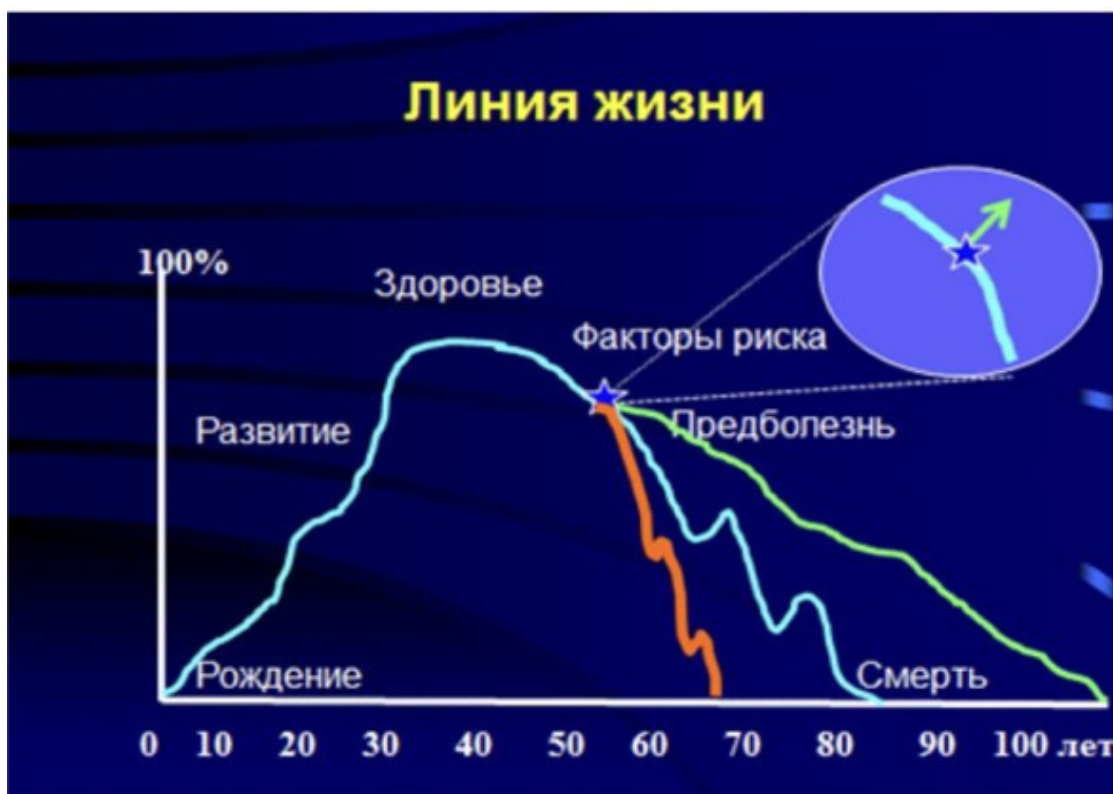
Рисунок из личного архива

Время – это единственная реальная, но, к сожалению, скоропреходящая ценность нашей жизни. Вот почему нас так душевно трогают стихи Мацуо Басё с его сожалением об уходящих мгновениях жизни. Отсюда, мы думаем, берет начало вечная мечта человека о бессмертии.