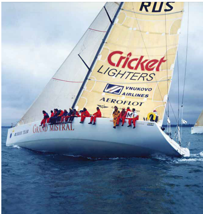
ЯХТА RUSSIAN TEAM GRAND MISTRAL В ПРОЛИВЕ СОЛЕНТ (ВЕЛИКОБРИТАНИЯ). 1996 ГОД.