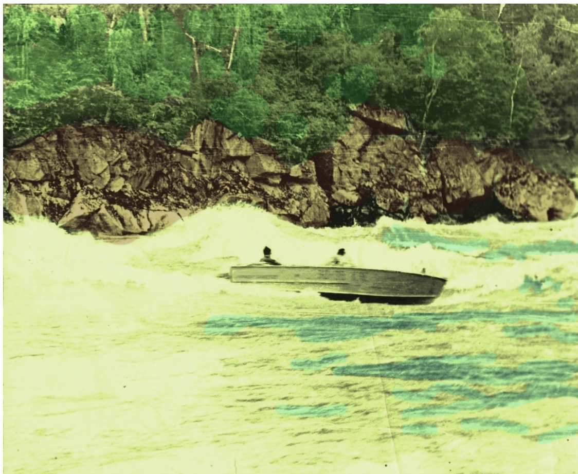
В Большом пороге