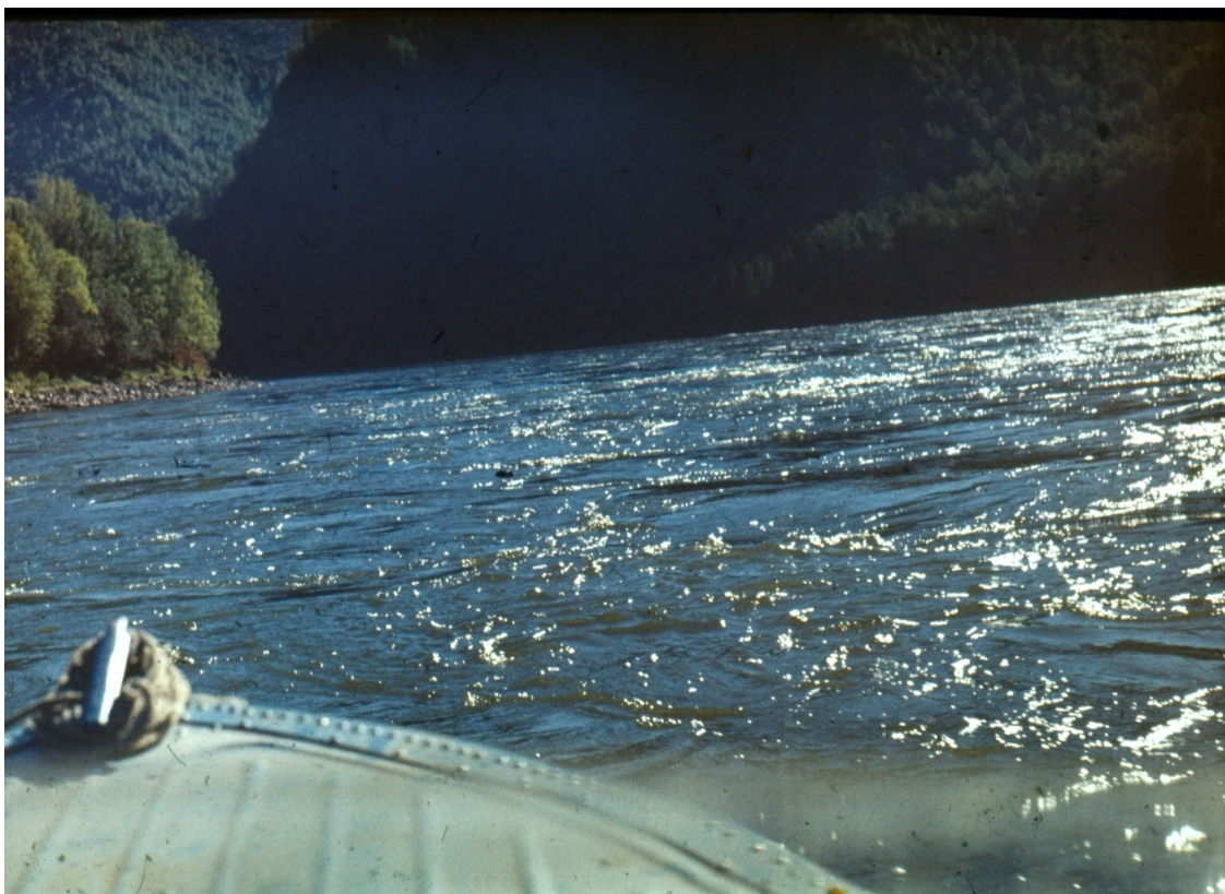
Провожаем Лето в Саянах